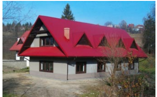
Nowy budynek oczyszczalni ścieków na Glinianym w Istebnej.

Roboty zostały wykonane w pełnym zakresie i w terminie ustalonym umowami. We wrześniu złożono wnioski o płatność, który dotyczył zwrotu poniesionych przez Gminę Istebna kosztów inwestycji (ogółem netto: 829.825,43.). W ostatni dzień października przedstawiciele Agencji Restrukturyzacji i Modernizacji Rolnictwa dokonali wizytacji terenowej. Obecnie czekamy na zwrot poniesionych w 2005 r. wydatków w wysokości 617.960,36 zł.