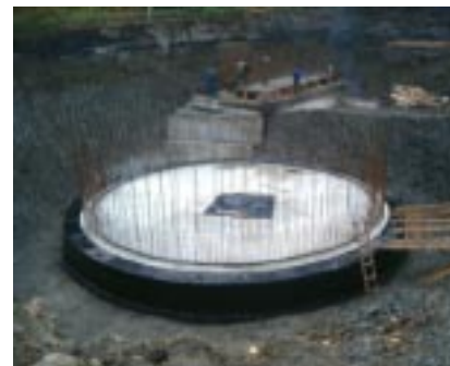
Fragment zbiornika zespolonego budowanej oczyszczalni.

przygotowawczych złożony został niezwłocznie po podpisaniu umowy o dofinansowanie w lipcu br. i po jego uzupełnieniu UG nadal oczekuje na środki finansowe. Takie finansowanie inwestycji, choć czasochłonne, zapewni płynność realizacji i umożliwi jej kontynuację bez większych obaw o utratę płynności.