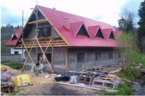
Budynek oczyszczalni ścieków na Glinianym w trakcie robót.

Zakończono kolejną inwestycję realizowaną w ramach Programu SAPARD.