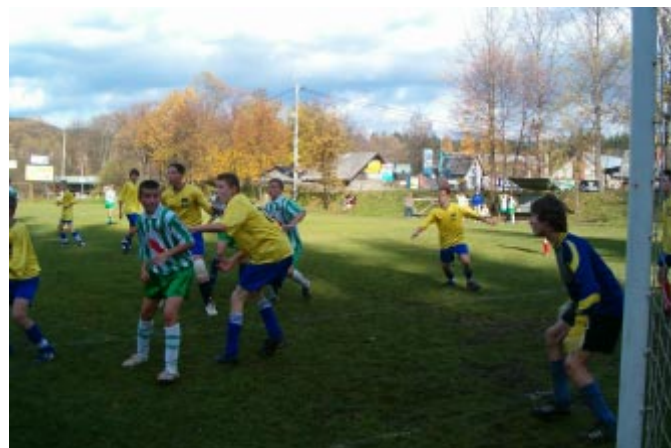
Gorące spięcie podbramkowe w meczu finałowym.

Triumfatorzy turnieju zagrają w powiatowych rozgrywkach finałowych.