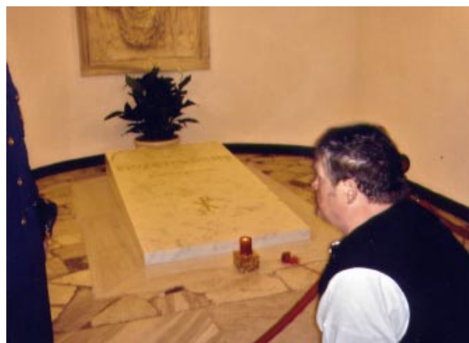
Istebnianie przed grobem Jana Pawła II.