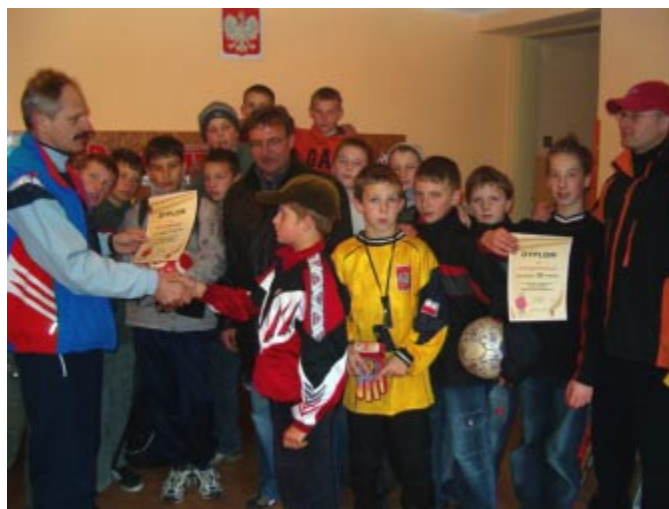
„Wręczenie dyplomów uczestnikom turnieju”.

Młodzi piłkarze z Koniakowa wezmą udział w eliminacjach powiatowych.