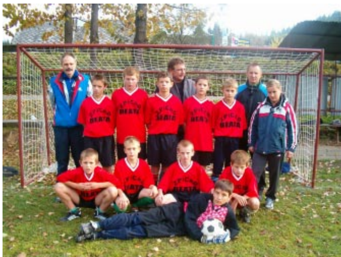
Triumfatorzy turnieju - SP 1 Koniaków z opiekunami i organizatorem turnieju.

Tak więc w meczu o trzecie miejsce spotkały się drużyny Ustronia i Wisła Jawornika. Mecz miał niecodzienny przebieg. Do przerwy drużyny strzeliły tylko 3 bramki, natomiast po przerwie aż 12. Ustroń prowadził już 5:1, potem był remis 5:5, a skończyło się na wyniku 10: 5 dla Ustronia.