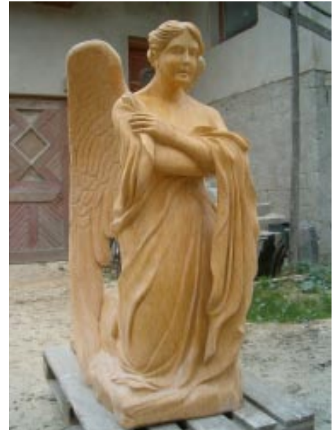
Tak się złożyło, że ten dwudziestoletni okres mogłem podsumować rzeźbą. Jest to "Anioł Nagrobny", którego dedykuję wszystkim bez wyjątku, którzy tworzyli kulturę i sztukę Trójwsi.