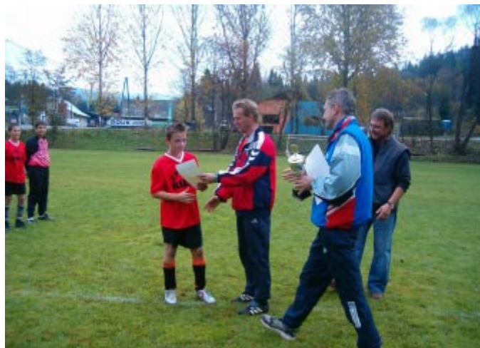
Wręczenie nagród kapitanowi zwycięskiej drużyny.