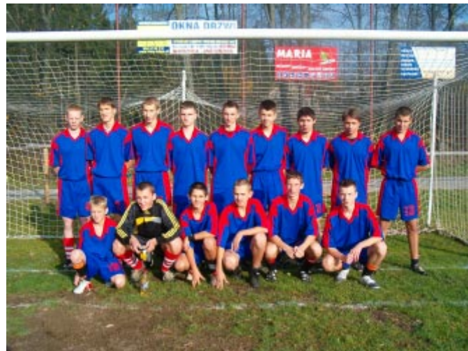
Reprezentacja gospodarzy - Gimnazjum Istebna.

Młodzi piłkarze reprezentujący Gimnazjum nr 1 w Ustroniu okazali się najlepsi w powiatowych eliminacjach gimnazjalistów w piłce nożnej, które odbyły się w środę 27 października na boisku "Pod Skocznią" w Istebnej. W finale pokonali swoich rówieśników z Goleiszowa 3:1.