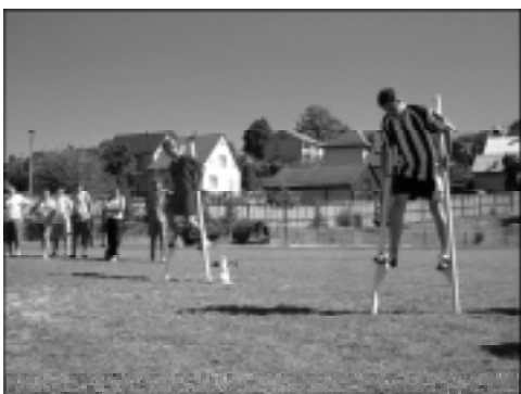
Wyścigi na szrudłach dostarczyły wielu emocji