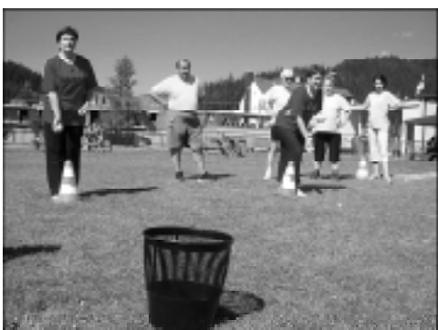
Nasze panie najlepiej celowały... do kosza