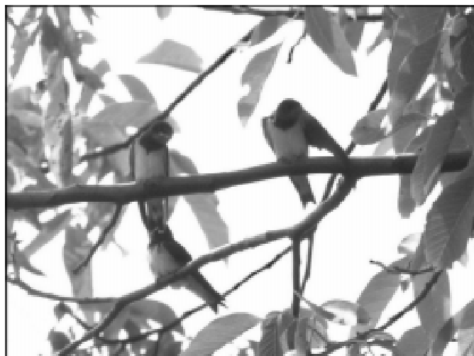
Na zdjęciu młode jaskółki dymówki tuż po wylocie z gniazda.