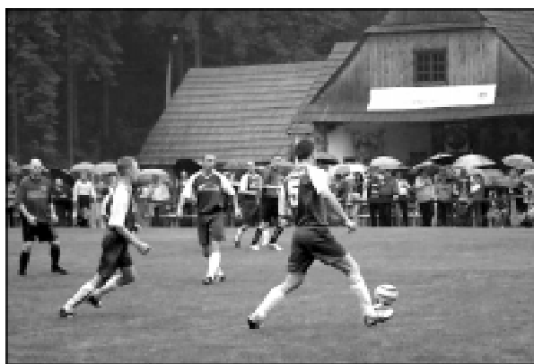
Fragment meczu z Puńcowem rozegranego w ramach Dożynek Gminnych

04.09.05 KP Trójwiesć - Zabrzeg Młodzicy 3:2; Juniorzy 0:3