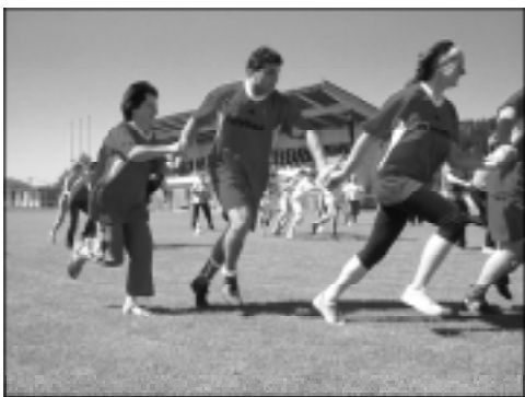
Gęsiego... w sztafecie gmin ważny był taki chwyt