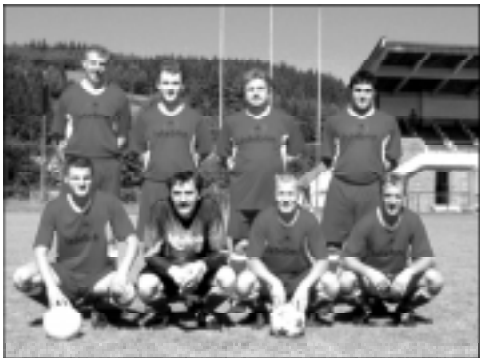
Nasza drużyna piłkarska

Reprezentacja Gminy Istebna wzięła udział w Międzynarodowej Spartakiadzie Gmin w Čiernem na Słowacji. To był już siódmy rocznik tej imprezy, w której oprócz naszej ekipy uczestniczyły także sąsiadujące ze sobą gminy Skalite, Svrčinovec oraz gospodarze - Čierne. Piękna pogoda i gościnność gospodarzy sprawiły, że impreza była bardzo udana.