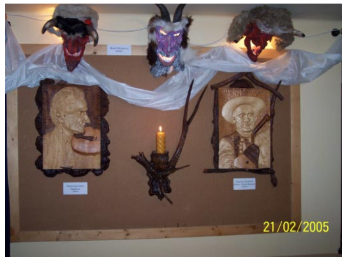
Płaskorzeźby i maski obrzędowe.