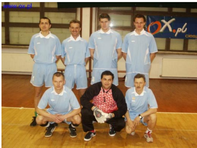
Nasza drużyna przed turniejem...

Znacznie trudniejszy był mecz półfinałowy, w którym na drodze naszej drużyny stanęła reprezentacja Cieszyna, która w poprzednich meczach spisywała się bardzo dobrze. I tym razem jednak nasz zespół okazał się zdecydowanie lepszy.