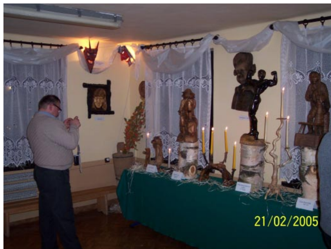
Fragment wystawy - rzeźby i wyroby artystyczne z korzeni.