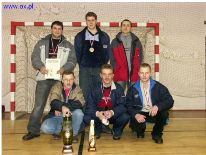
... i po turnieju