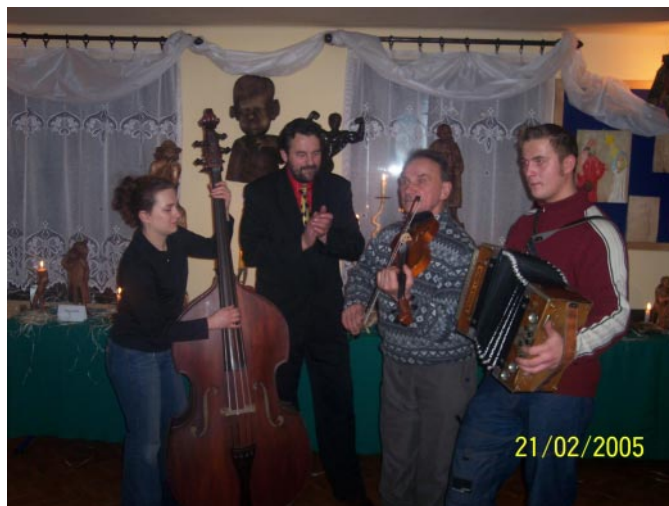
Kapela „Zwyrtni” stworzyła niepowtarzalny nastrój.