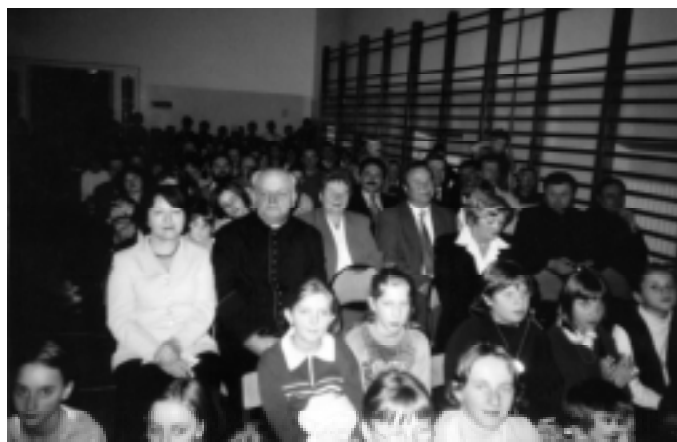
Na uroczystość przybyli goście ze Słowacji

Nasze świętowanie rozpoczęło się od złożenia kwiatów pod tablicą pamiątkową, ks. Józefa Londzina. W dalszej części obejrzelśmy uczniów w programie artystycznym, przybliżających kraje,