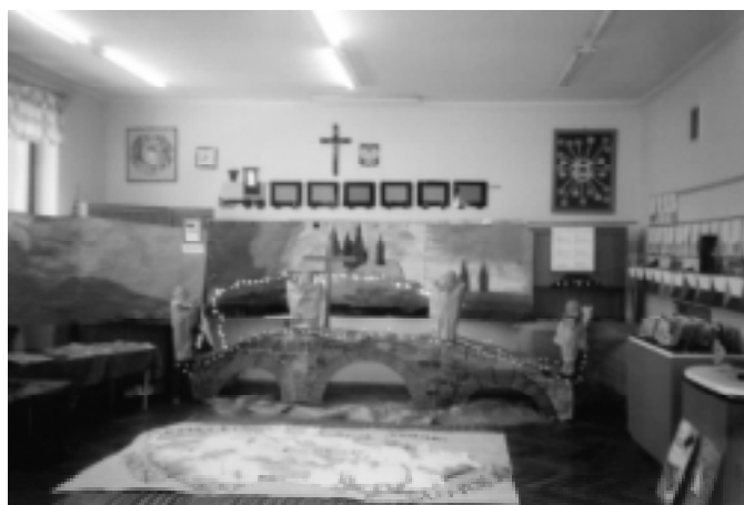
Kl. 2b zachęcała do zwiedzenia Czech.