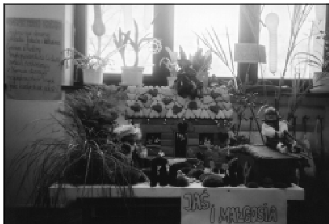
Klasa 1a i 1b przeniosły nas w krainę baśni europejskiej.