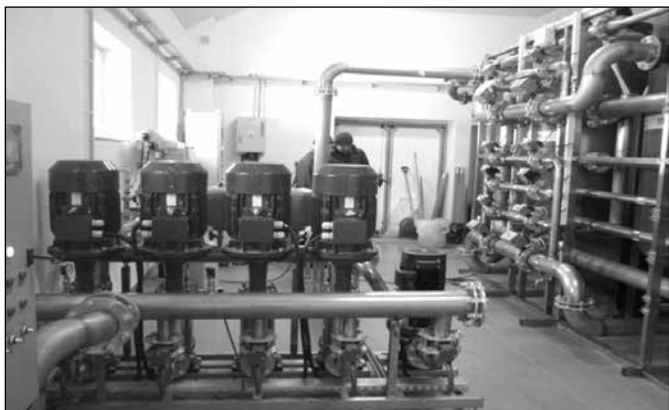
Stacja uzdatniania wody w Koniakowie Jasiówcze