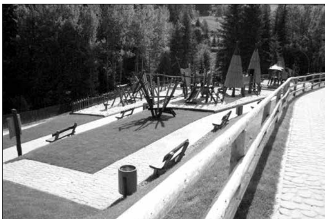
Akacyjny plac zabaw na Dzielcu w Istebnej

W ostatnich czterech latach kadencji realizowano również zadania związane z rozbudową infrastruktury wodno – kanalizacyjnej.