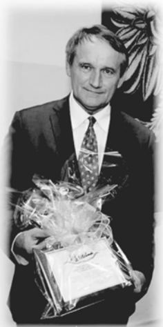
Wójt, Radni obecnej i minionych kadencji, sołtysi, pracownicy Urzędu Gminy i jednostek organizacyjnych.

Życzymy Panu wiele zdrowia, pomysłowości i szczęścia w życiu zawodowym i osobistym.