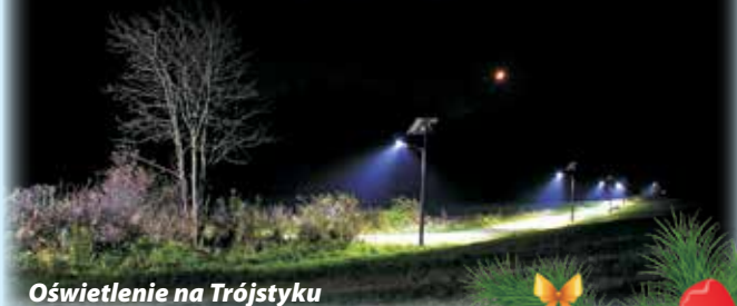
Oświetlenie na Trójstyku