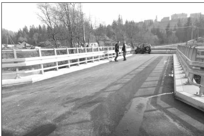
Most na Jasnowicach – Szymcze