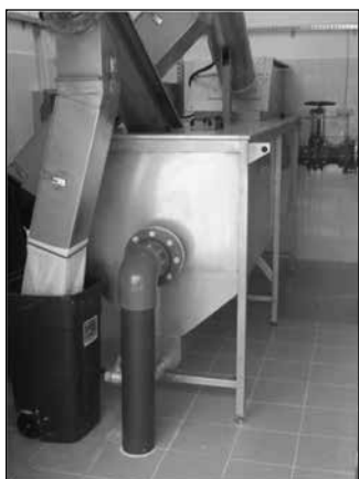
Siłopiaskownik na oczyszczalni ścieków w Gliniennym

Samorządowa rzeczywistość nie jest łatwa na co dzień. Machina procedur, przepisów, realia lokalnej rzeczywistości zmuszają do ciężkiej pracy i stawiają przed pracownikami coraz to nowe wyzwania. Za rozwojem małych samorządów kryje się mnóstwo planowania i pracy na poziomie globalnym. Ostatnie cztery lata dla naszej gminy to przede wszystkim ciężka praca związana z realizacją wielu ważnych dla gminy przedsięwzięć. Główny trzon tych działań stanowiły: