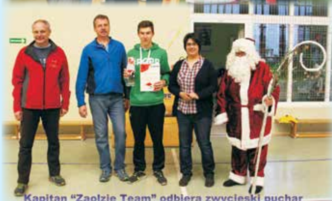
Kapitan "Zaolzie Team" odbiera zwycięski puchar