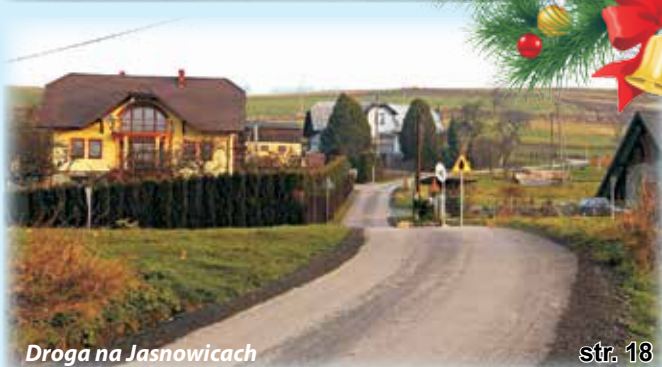
Droga na Jasnowicach