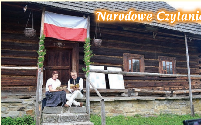
Narodowe Czytanie w Chacie Kawuloka