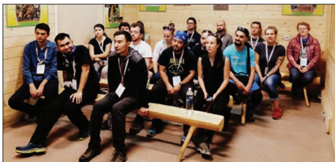
Uczestnicy konferencji w trakcie wycieczki w Karpackim Banku Genów, Muzeum Świerka i Wolierze Pokazowej Głuszców w Jaworzynie.

W ciągu trzech dni spędzonych na owocnych obradach, dyskusjach i prezentacjach, uczestnicy Geosymposium mieli możliwość wymiany doświadczeń oraz spostrzeżeń dotyczących prowadzonych przez nich badań zarówno pod względem merytorycznym, jak i praktycznym w obrębie różnych dziedzin naukowych. Poruszone zostały również tematy ochrony środowiska związane z zanieczyszczeniem atmosfery, spalaniem i niską emisją, które w ostatnich latach są jednym z głównych problemów dyskutowanych nie tylko w Polsce czy Europie, ale i na całym świecie.