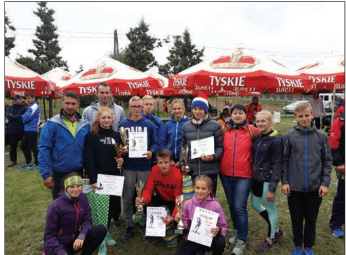
Zawodnicy i trenerzy NKS Trójwies Beskidzka w Markłowicach