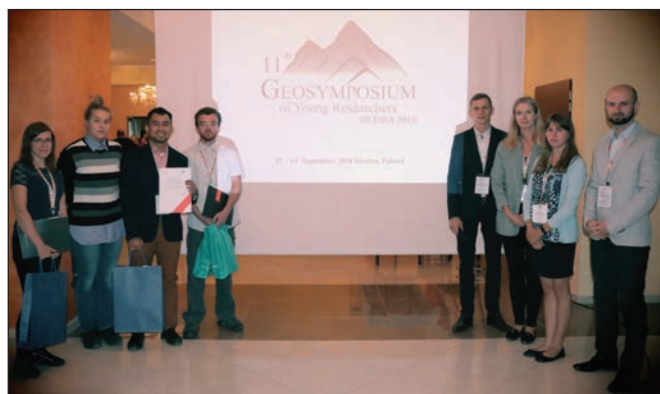
Nagrodzeni uczestnicy oraz przedstawiciele Komitetu Organizacyjnego 11-go Geosymposiumu Młodych Naukowców w trakcie uroczystego zamknięcia konferencji.

Na zakończenie konferencji zostały wręczone nagrody dla uczestników za najlepsze referaty wygłoszone w trakcie sesji ustnych i nagroda za najlepszy poster. Nagrody zosta-