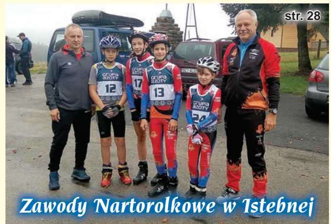
MP na nartorolkach Jelenia Góra