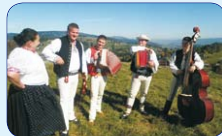
Zdjęcia z kręcenia filmu promocyjnego Gminy Istebna