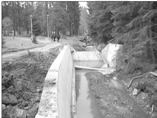
Mur betonowy w rejonie gimnazjum