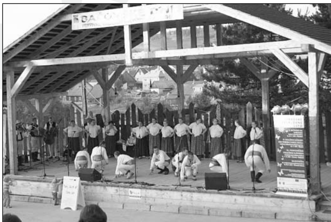
Bacovskie Dni, Festival Valaskiej Kultury

Zespół bardzo sobie ceni współpracę z oddziałem Górali Śląskich, biorąc czynny udział we wszystkich imprezach, które są przez nich organizowane, są to: mieszanie owiec, otwarcie nowej bacówki na Czubanuli w Baraniej, Świnty Jón na Ochodziej, Międzynarodowe Targi Pasterskie, rozsód owiec,