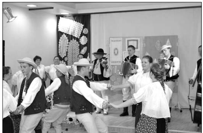
Występy na Łotwie i Litwie