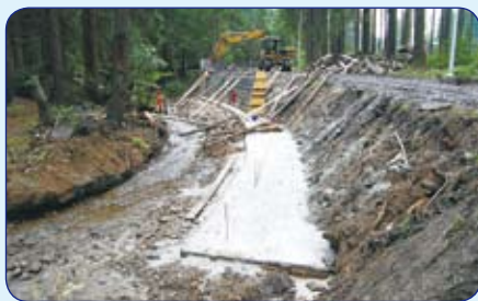
Roboty ziemne i betonowe