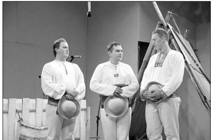
Występ konkursowy na Festiwalu Górali Polskich