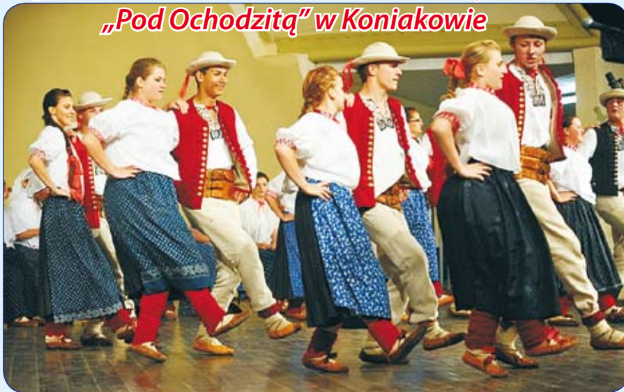
Występy podczas Tygodnia Kultury Beskidzkiej