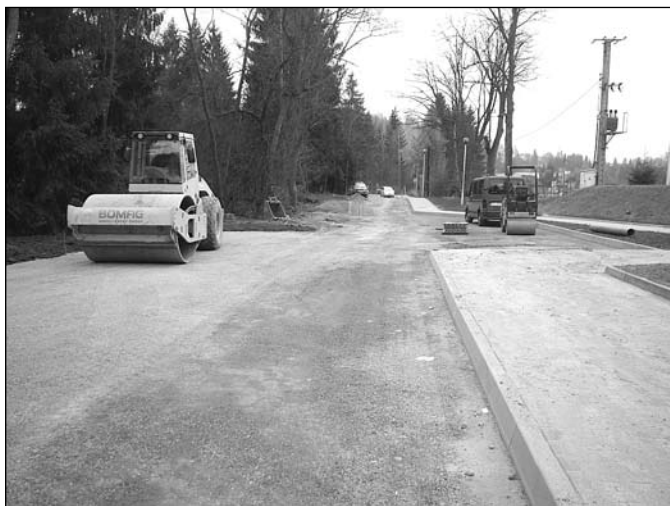
Droga obok gimnazjum

Pod koniec listopada zakończono realizację zadania inwestycyjnego pod nazwą: Remont drogi gminnej obok gimnazjum wraz z remontem koryta potoku Olecka w ramach usuwania skutków powodzi z 2010 r. Inwestycję realizowano wspólnie z Regionalnym Zarządem Gospodarki Wodnej w Gliwicach na podstawie porozumienia z dnia 5 sierpnia 2011 r. W ramach porozumienia wykonano remont drogi gminnej obok Gimnazjum wraz z elementami umocnień stanowiącymi zabezpieczenie i umocnienie skarp na drodze w km drogi od 0+000 do 0+760 oraz remont koryta potoku Olecka w km potoku 0+600 do 1+267 polegający na remoncie budowli regulacyjnych wraz z zabudową wyrw brzegowych.