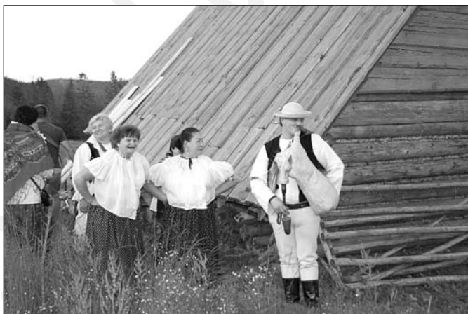
Otwarcie nowej Bacówki na Baraniej