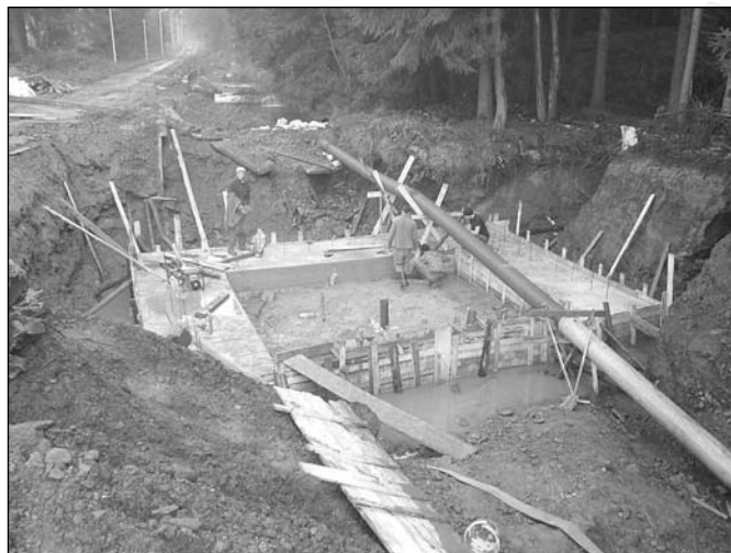
Fundament pod mur betonowy

Wykonane prace pozwolą nam dalej realizować roboty przy gimnazjum związane z budową ścieżki narto rolkowej na odcinku od gimnazjum wzdłuż potoku Olecka do połączenia z drogą Leśną prowadzącą na Olecki i Tokarzonkę. Prace te będą prowadzone wiosną 2012 r.