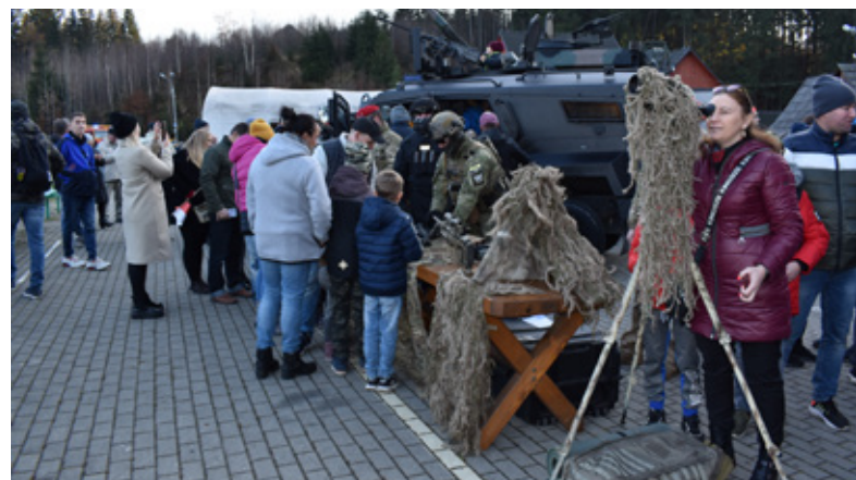
Prezentacja sprzętu wojskowego Goście VIP i uczestnicy Narodowego Święta Niepodległości