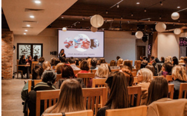
Uczestnicy debaty Światowego Dnia Wcześniaka