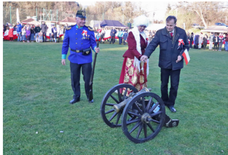
Narodowe Święto Niepodległości 2021