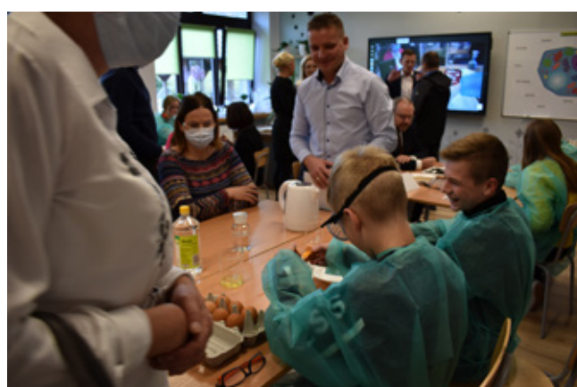
Zielona Pracownia „Życie nicią malowane...” | fot. Małgorzata Owczarczak