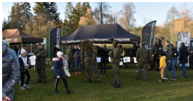
Prezentacja sprzętu wojskowego