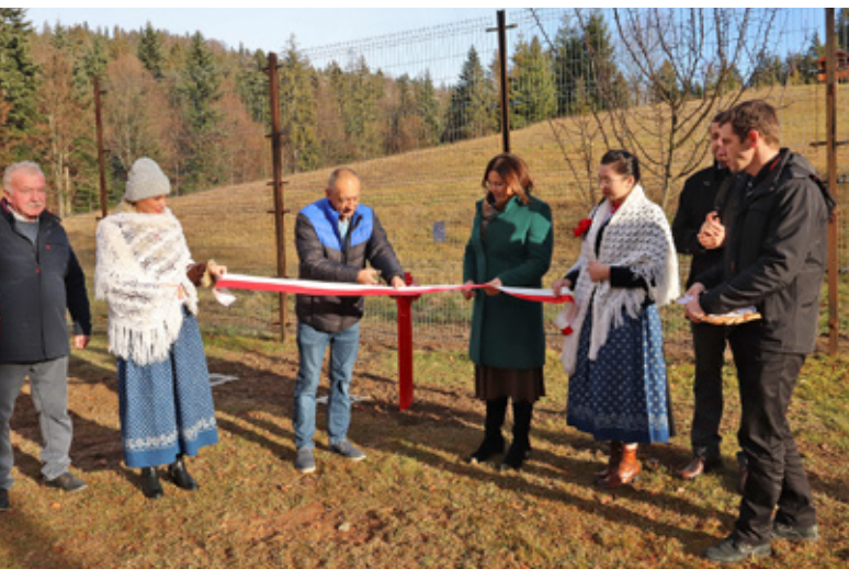
Uroczyste przecięcie wstęgi przy wodociągu w Rastocze

Wartość inwestycji wyniosła 317 850,59 złotych brutto, a całość inwestycji pokryta została ze środków własnych Gminy Istebna. W ramach zadania wykonano również nową instalację wody użytkowej oraz instalację przeciwpożarową.