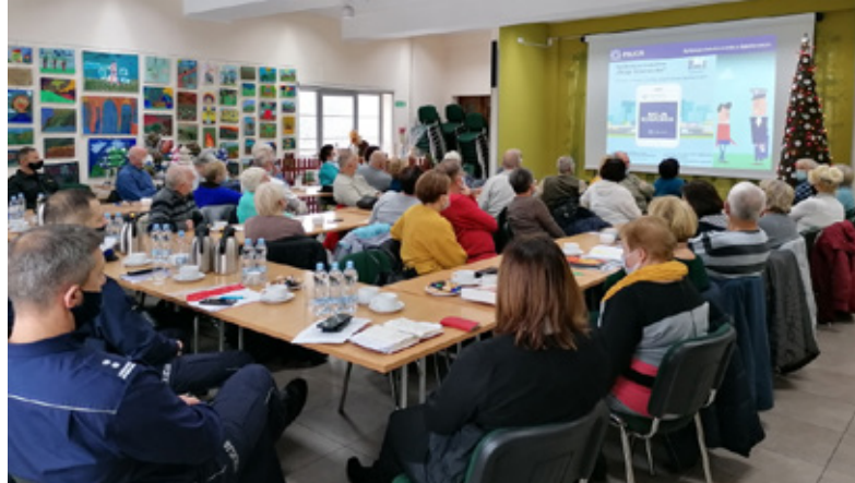
Uczestnicy debaty ewaluacyjnej pt. „Porozmawiajmy o bezpieczeństwie – Możesz mieć na nie wpływ” Istebna 2021 | fot. Aneta Legierska

– po raz pierwszy przeznaczono kilkanaście tysięcy złotych na dodatkowe, płatne patrole policji, które pracowały na terenie gminy od sierpnia do listopada br.;