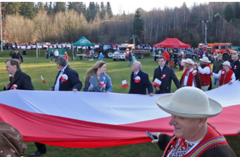
Przemarsz z flagą

za duszpasterzy, za zgodę i dobrą współpracę w ojczyźnie i w gminie Istebna, a także za Naród Polski oraz poległych w walce za Ojczyznę. Ksiądz dziekan wygłosił Słowo Boże w oparciu o prozę i poezję wieszczów narodowych, w którym podkreślił znaczenie patriotyzmu, które od wieków wyróżnia nasz kraj na światowej arenie. Usłyszeć można było m.in. słowa wiersza Aleksandra Fredro „Ojczyzna Nasza”: