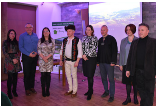
Organizatorzy konferencji „Przyroda i kultura pogranicza”

Podczas konferencji odbyła się promocja folderu przedstawiającego dziedzictwo przyrody i kultury Gminy Istebna, Kysuc i Małej Fatry. Prelegent Andrzej Suszka omówił w formie prezentacji przykłady dziedzictwa kulturowego stanowiące jednocześnie atrakcje turystyczne gminy Istebna. Zaprezentował najciekawsze miejsca zarówno po stronie polskiej i słowackiej.