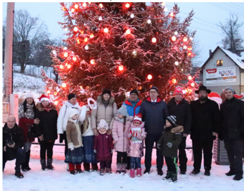
Rozpalenie choinki I fot. Jacek Kohut

Następnie prowadząca zaprosiła wszystkich do udziału w dalszych atrakcjach przygotowanych przez organizatorów. W saniach wraz z prezentami i pomocnikami czekał już św. Mikołaj. Z funduszy Gminy Istebna zakupiono ponad 600 zabawek i kilkadziesiąt czekolad, które święty rozdał najmłodszym. Radości nie było końca. Przy stajence znajdowało się także stoisko Nadleśnictwa Wiśła, które ufundowało ponad 50 bezpłatnych drzewek świątecznych dla mieszkańców