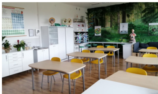
Zielona Pracownia „Laboratorium świerka istebniańskiego”