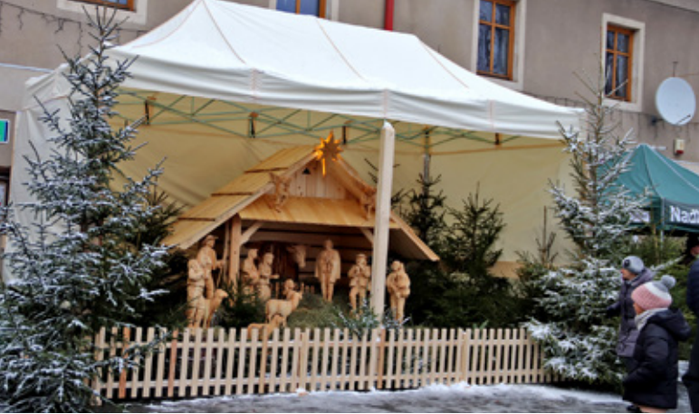
Istebniańskie Betlejem