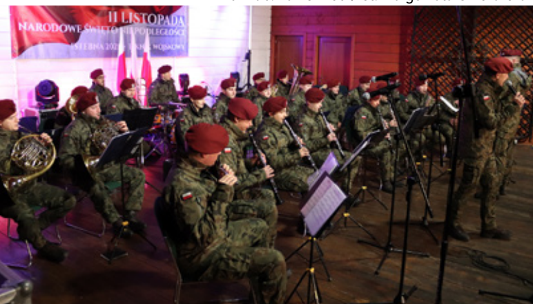
Orkiestra Wojskowa z Krakowa Prezentacja wozów wojskowych