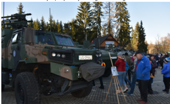
Prezentacja sprzętu wojskowego