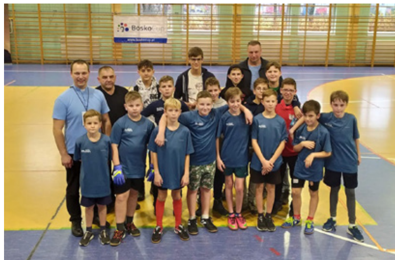
Na zdjęciu: ekipa służby liturgicznej Parafii Dobrego Pasterza w Istebnej