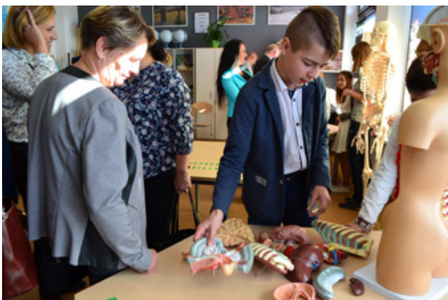
Zielona Pracownia „Z Beskidów w Świat”

Gmina Istebna pozyskała w 2021 roku dofinansowanie z Wojewódzkiego Funduszu Ochrony Środowiska i Gospodarki Wodnej na realizację dwóch Zielonych Pracowni. Przy zaangażowaniu pedagogów w Szkole Podstawowej nr 1 w Koniakowie powstała Zielona Pracownia pn. „ Życie nicią malowane... ”, której wartość dofinansowania wynosi 40 000,00 zł oraz pracownia pn. „ Laboratorium świerka istebniańskiego ” w Szkole Podstawowej nr 2 w Istebnej z kwotą dofinansowania 37 897,30 zł. Wkład własny do obu pracowni stanowiły nagrody pozyskane w pierwszym etapie konkursu w kwotach: 10 000 zł dla SP1 Koniaków, 9 779,46 zł dla SP2 Istebna.