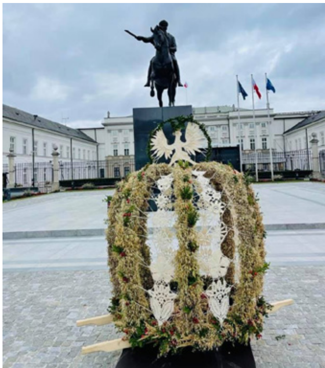
Wieniec Dożynkowy

18 i 19 września zdecydowanie zapisze się w pamięci wydarzeń naszej gminy. Centrum Koronki Koniakowskiej wraz z Grupą śpiewaczą „Kóniokowanie” reprezentowała Województwo Śląskie podczas tegorocznych Dożynek Prezydenckich.