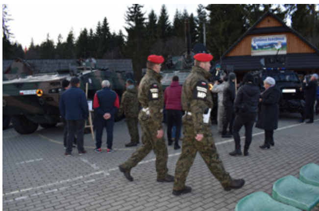
Prezentacja sprzętu wojskowego