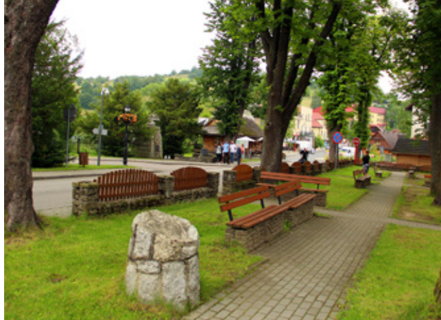
Park im. Pawła Stalmacha w Istebniej-Centrum

Punkt ten otworzono w styczniu 2020 r. dzięki adaptacji pomieszczeń dawnej narciarni, umiejscowionej w budynku szkolno-przedszkolnym w Istebniej-Dzielcu. Lokal przystosowany jest dla osób niepełnosprawnych i składa się z pomieszczeń biurowych, poczekalni oraz toalety. Koszt adaptacji wyniósł ok. 87 tys. zł. Z bezpłatnych usług prawnych i psychologicznych mogą korzystać wszyscy mieszkańcy gminy Istebna. Więcej: w podsumowaniu Roku 2020 w Gminie Istebna.