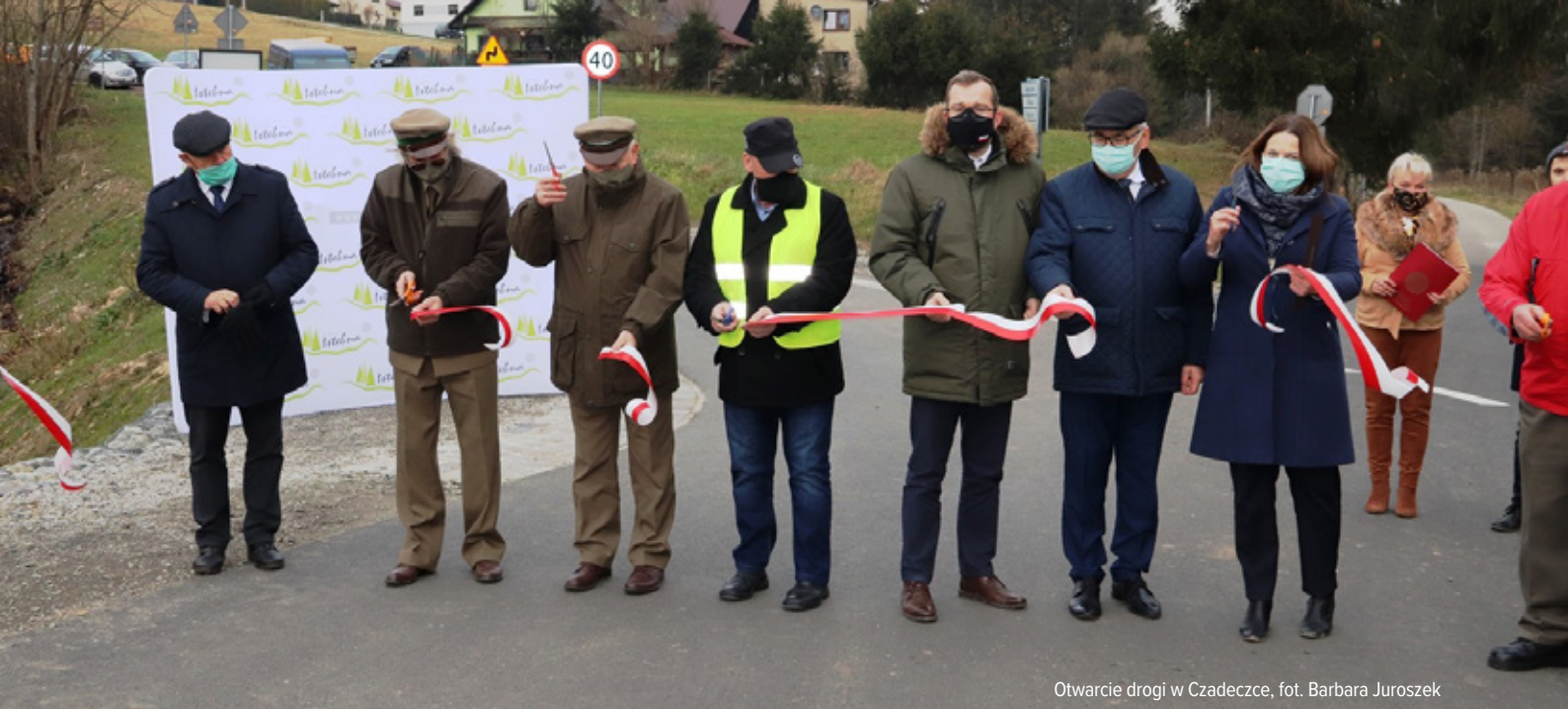
Otwarcie drogi w Czadeczcze