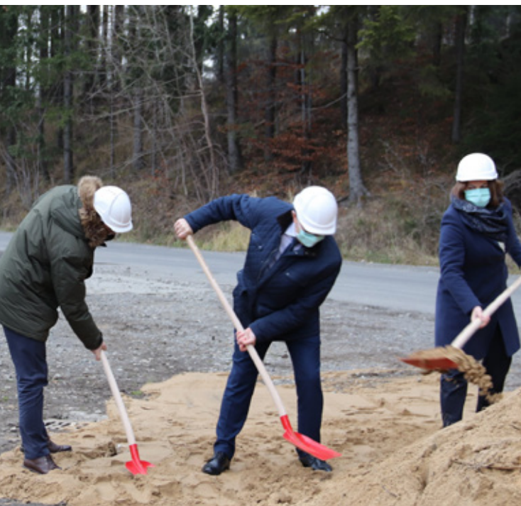
Przedstawiciele Rządu i UG Istebna podczas symbolicznego rozpoczęcia prac przy rozbudowie drogi

Na podstawie informacji z Urzędu Gminy opracował Artur Jackowski