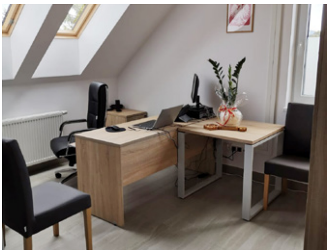
Wnętrze pomieszczenia posterunku policji