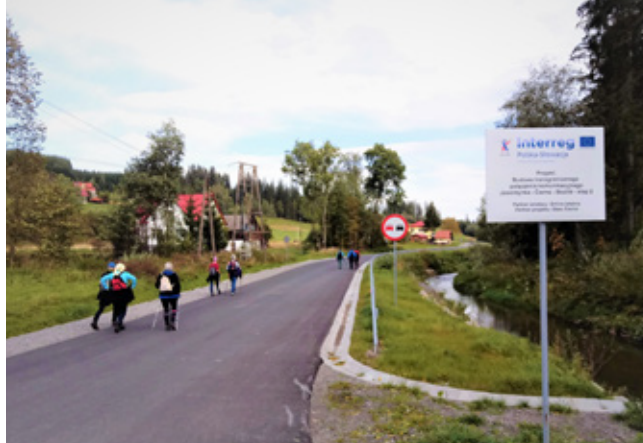
Rozbudowa drogi gminnej w Jaworzynce-Czadecze