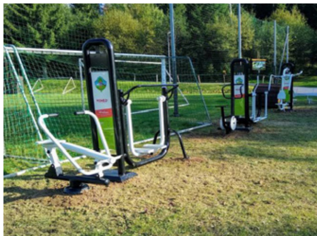
Siłownia zewnętrzna w Istebniej-Zaolziu

W ramach konkursu marszałkowskiego „Inicjatywa sołecka” 2020 w Trójwsi zrealizowano dwie inwestycje. Pierwszą jest powstanie – składającej się z 8 urządzeń – siłowni zewnętrznej przy boisku w Istebniej na Zaolziu. Drugie z kolei zadanie zrealizowano w Jaworzynce na Trójstyku, gdzie powstał miniplac zabaw i siłownia zewnętrzna z czterema urządzeniami do ćwiczeń. Więcej w poprzednim wydaniu NT.