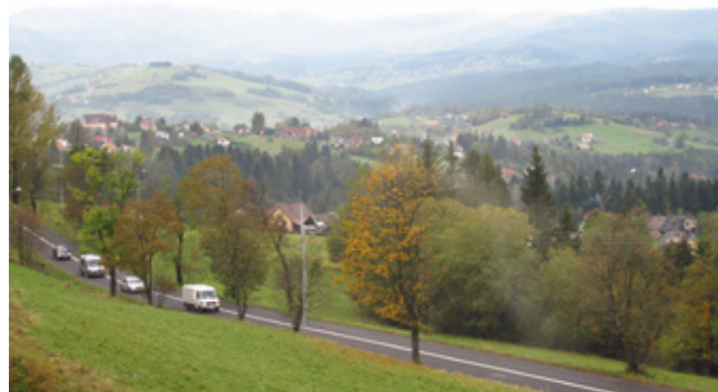
Droga wojewódzka DW 943 w Koniakowie, w tle widok na Koniaków i Istebną

K oniaków staje przed szansą na nowy chodnik i kompleksową modernizację drogi prowadzącej w stronę Ochodzitej i Koczego Zamku. Umowa na projektowanie przebudowy drogi wojewódzkiej nr 943 została już podpisana z Urzędem Marszałkowskim w Katowicach. Plany inwestycyjne obejmują odcinek liczący ok. 2,7 km, od budynku probostwa do przystanku na Pietraszynie. Oprócz nowej nawierzchni jezdni, mieszkańcy i turyści zyskają przede wszystkim bezpieczny trakt pieszy u podnóży Ochodzitej. Budowa chodnika na tak ruchliwym odcinku jest koniecznością. Projekt zakłada także stworzenie zatok autobusowych oraz zwiększenie potencjału parkingowego w centrum wsi. Wpłynie to z pewnością na płynność ruchu w miejscowości. Zakończenie prac projektowych przewiduje się do połowy 2021 r.