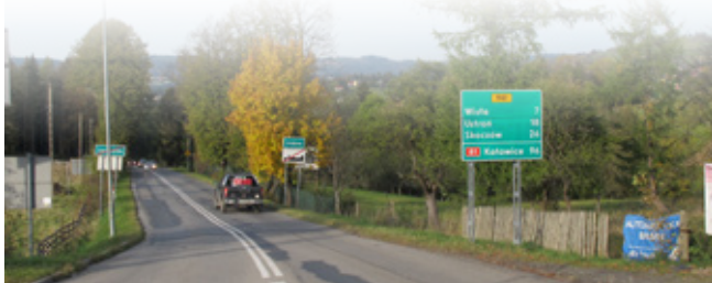
Droga wojewódzka DW 941 pomiędzy Istebną a Jaworzynką (stan przed remontem)

Ostatni segment prac drogowych od Istebnej-Centrum do mostu w Glinianym będzie wykonany w dalszej kolejności. Z uwagi na potrzebę większego zaangażowania środków finansowych (dodatkowe zabezpieczenie skarp oraz głównego korpusu drogi) planowany jest w miarę możliwości po zakończeniu zimowego utrzymania dróg.