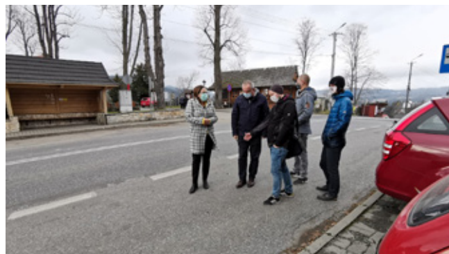
Spotkanie z projektantami, skrzyżowanie dróg wojewódzkich w Istebnej-Centrum

Inwestycja z pewnością wpłynie na poprawę funkcji komunikacyjnej w centrum Istebnej (w planach są dodatkowe pasy do skręcania, bezpieczne przejście dla pieszych oraz utworzenie zatok autobusowych poza ścisłym centrum). W znaczący sposób poprawi się też komfort poruszania się pieszych wzdłuż tej głównej arterii. Zakończenie prac projektowych przewiduje się w I poł. 2021 r. Plany wymagają jeszcze zatwierdzenia właściciela infrastruktury drogowej, czyli Zarządu Dróg Wojewódzkich w Katowicach.