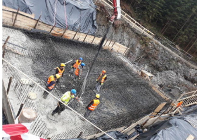
Modernizacja oczyszczalni Koniaków-Pustki