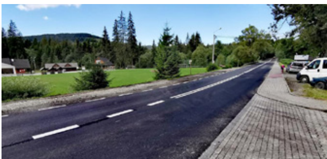
Wyremontowany odcinek drogi wojewódzkiej DW 941

Latem bieżącego roku udało się przeprowadzić remont newalgicznych fragmentów DW 941, z Istebnej Tartaku do zakrętu na Dzielcu oraz od szkoły podstawowej do parkingu „Pod Grapą” . Na odcinkach tych pojawiła się nowa nawierzchnia bitumiczna. W ramach prowadzonych prac zostało także wykonane czyszczenie rowów, przycięcie gałęzi oraz nowe oznakowanie poziome. Remont został sfinansowany ze środków Urzędu Marszałkowskiego Województwa Śląskiego.