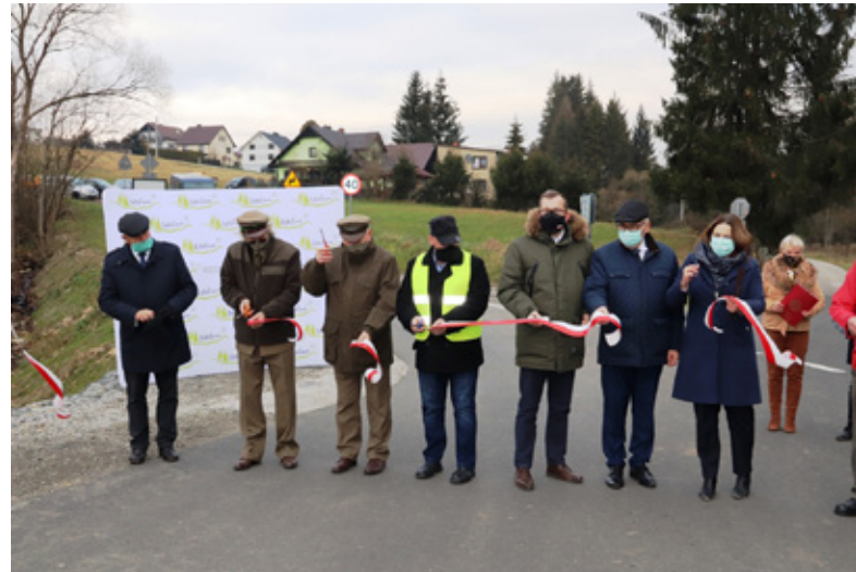
Przedstawiciele Rządu, władz Wojewódzkich, Lasów Państwowych, Nadleśnictwa Wisła, przedstawiciele Urzędu Gminy podczas oficjalnego otwarcia wyremontowanej drogi w Jaworzynce-Czadeczcze

W listopadzie 2020 r. uroczystym przecięciem wstęgi zakończono prace nad remontem drogi w Jaworzynce-Czadeczcze. Prace objęły strategiczny odcinek prowadzący od mostu do przysiółka Kikula do skrzyżowania z drogą na Kopanice. Remont drogi zrealizowano