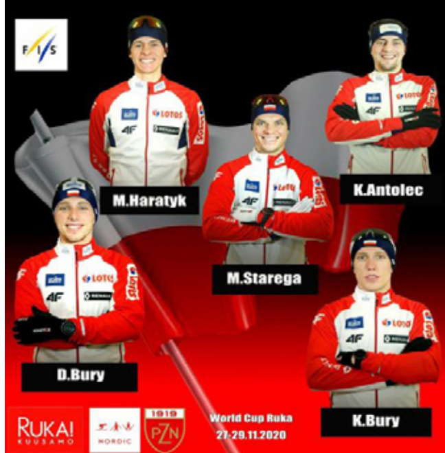
Kadra biegaczy PZN na zawody w Ruce