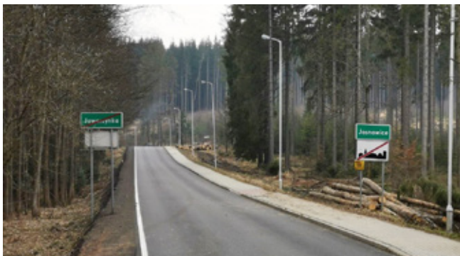
Wyremontowany odcinek drogi wojewódzkiej w stronę Jasnowic

D zięki dobrej współpracy z władzami województwa śląskiego sukcesywnie udaje się poprawiać stan dróg wojewódzkich przebiegających przez gminę Istebna. W 2019 r. całkowicie nową nawierzchnię zyskał fragment drogi wojewódzkiej prowadzący od ronda w Jaworzynce-Krzyżowej aż do byłego przejścia granicznego w Jasnowicach . Łączny koszt modernizacji wyniósł 2,2 mln zł.