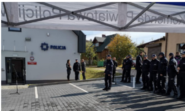
Budynek posterunku policji i przygotowania do oficjalnego jego otwarcia

W październiku 2019 r. otwarto nowy posterunek policji w Istebniej. Obiekt został wybudowany od podstaw na prośbę lokalnej władzy i społeczności. Placówka policji wróciła do Istebniej po 23 latach. Posterunek stanął w sąsiedztwie pogotowia ratunkowego. To dwukondygnacyjny budynek z dwustanowiskowym garażem. Wewnątrz znalazły się m.in. pokój przyjęć interesantów, pokoje biurowe i pomieszczenia gospodarcze. Przed budynkiem powstał także niewielki parking. Posterunek stanął przy ul. Dzielec 1919. Numer jest nieprzypadkowy i nawiązuje do setnej rocznicy powołania Policji Państwowej. Obsadę posterunku stanowi ośmiu funkcjonariuszy, a rejon ich działania obejmuje całą Trójwieś.