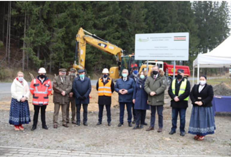
Przedstawiciele Rządu, władz Wojewódzkich, Lasów Państwowych, Nadleśnictwa Wisła, przedstawiciele wykonawcy firmy Strabag i przedstawiciele Urzędu Gminy podczas symbolicznego rozpoczęcia realizacji inwestycji rozbudowy drogi w dolinie Olzy w Istebnej