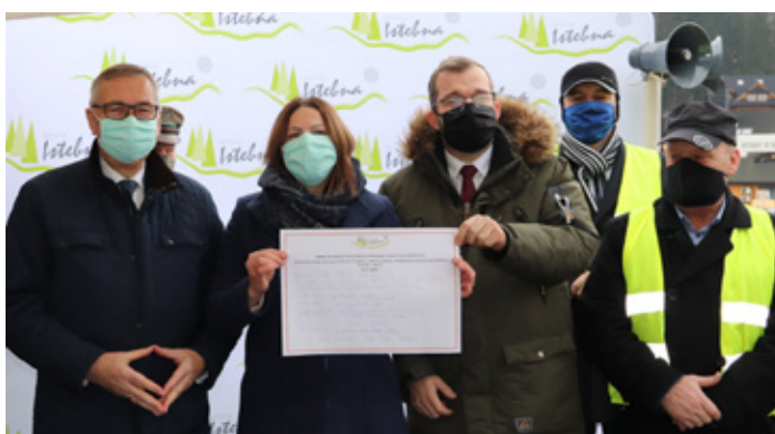
fot. Barbara Juroszek x2