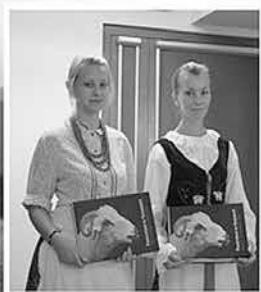
Promocja albumu: Pasterstwo w Karpatach