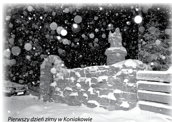
Pierwszy dzień zimy w Koniakowie