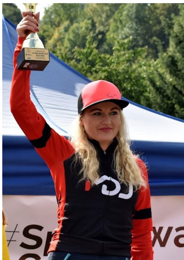
Uphill Klimczok - zdjęcie własne

Nagroda specjalna – Tytuł najlepszej zawodniczki pogranicza polsko-czesko-słowackiego