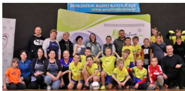
Uczestnicu turnieju II Edycji Ligi Ministranckiej wraz z organizatorami i opiekunami