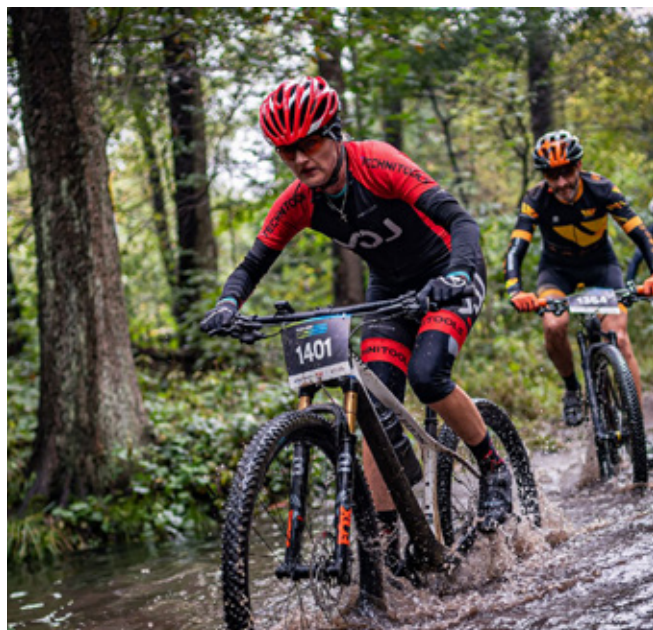
Agencja Reklamowa PAUSE - Dąbrowa Górnicza