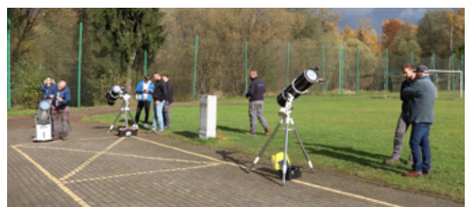
Uczestnicy wydarzenia podczas rozkładania sprzętu astronomicznego

Zdjęcie zostało wykonane w Istebnej "Pod Skocznią" w momencie największej fazy zaćmienia ok. godz. 12.20.