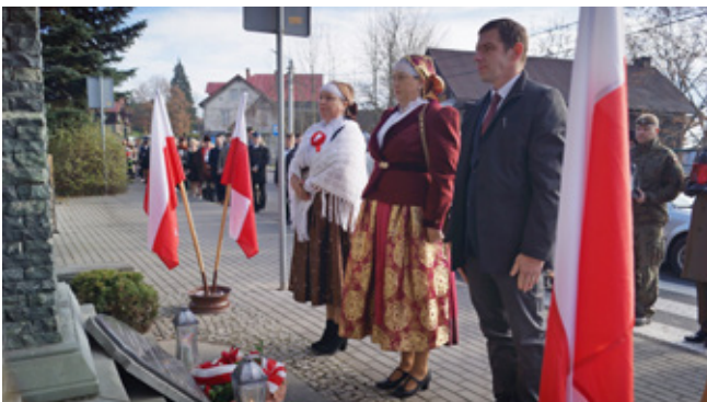
Delegacje składające kwiaty przy pomniku pomordowanych w Istebnej Centrum