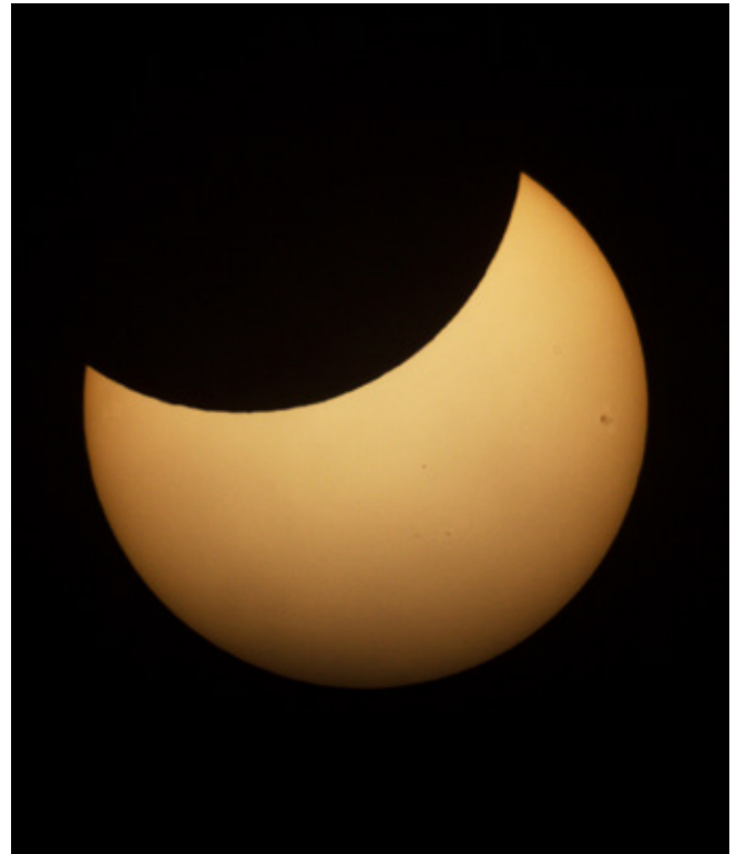
Częściowe zaćmienie słońca zaobserwowane w Istebnej

Mimo sporych obaw związanych z zachmurzeniem nieba ostatecznie aura okazała się łaskawa i wszyscy zainteresowani mogli bez problemów obejrzeć w Istebnej 25 października piękne zjawisko częściowego zaćmienia Słońca.