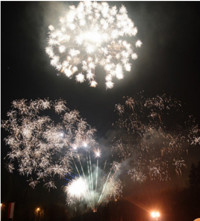
Pokaz sztucznych ogni na zakończenie obchodów Święta Niepodległości

Podczas wszystkich występów nad amfiteatrem unosił się zapach placków z blachy, herbaty z ziół i naleśników przygotowanych przez KGW „Jaworzynczanki” i KGW „Istebnianki” .