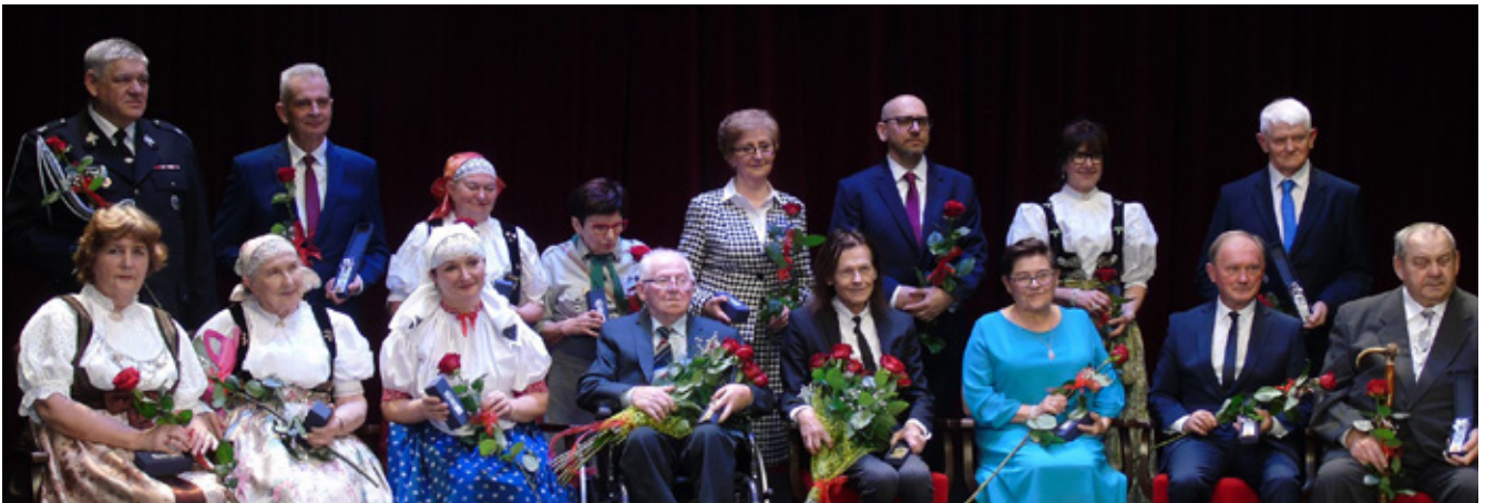
Laureaci Srebrnej Cieszyńianki