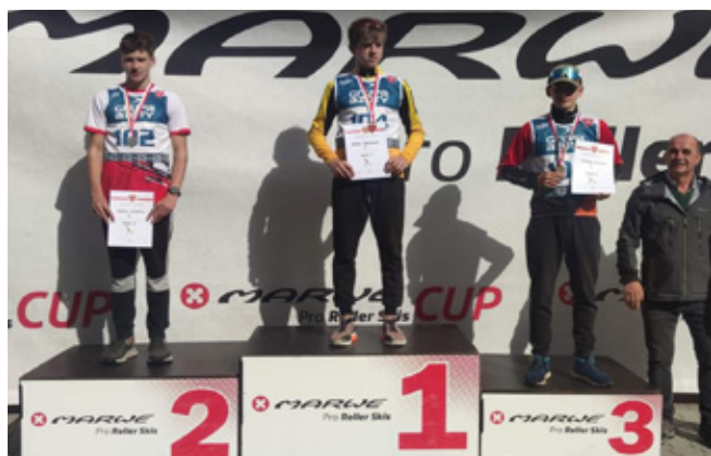
Dekoracja medalowa zawodników

Pięć razy stanęli na podium nasi młodzi biegacze podczas rozegranych w Ptaszkowej Mistrzostw Polski Młodzików w biegach na nartorolkach.