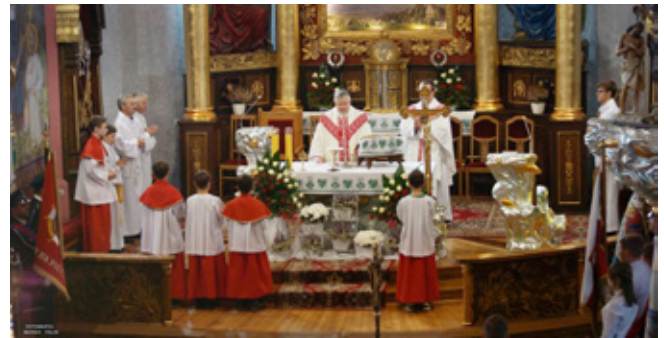
Uroczysta Msza Święta w intencji Ojczyzny

poległych w walce za Ojczyznę. Ksiądz dziekan wygłosił Słowo Boże w oparciu o prozę i poezję wieszczów narodowych, w którym podkreślił znaczenie patriotyzmu, które od wieków wyróżnia nasz kraj na światowej arenie. Usłyszeć można było m.in. cytaty z dzienniczka Siostry Faustyny, która przekazała swoje świadectwo miłości do ojczyzny. Pani Wójt w krótkiej wypowiedzi wyraziła wielkie wzruszenie i zadowolenie z tak licznej obecności mieszkańców, pocztów sztandarowych i uczniów z gminy Istebna. Podkreśliła jak ważna jest w obecnych czasach wartość pielęgnowania tradycji i przywiązania do rodzinnego domu, bo to z niego wnosimy wszystkie najważniejsze wartości, które należy pielęgnować całe życie.