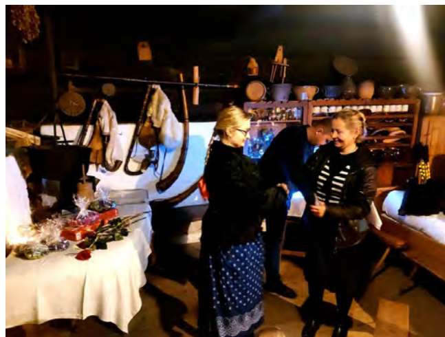
Spotkanie promocyjne w Chacie Kawuloka