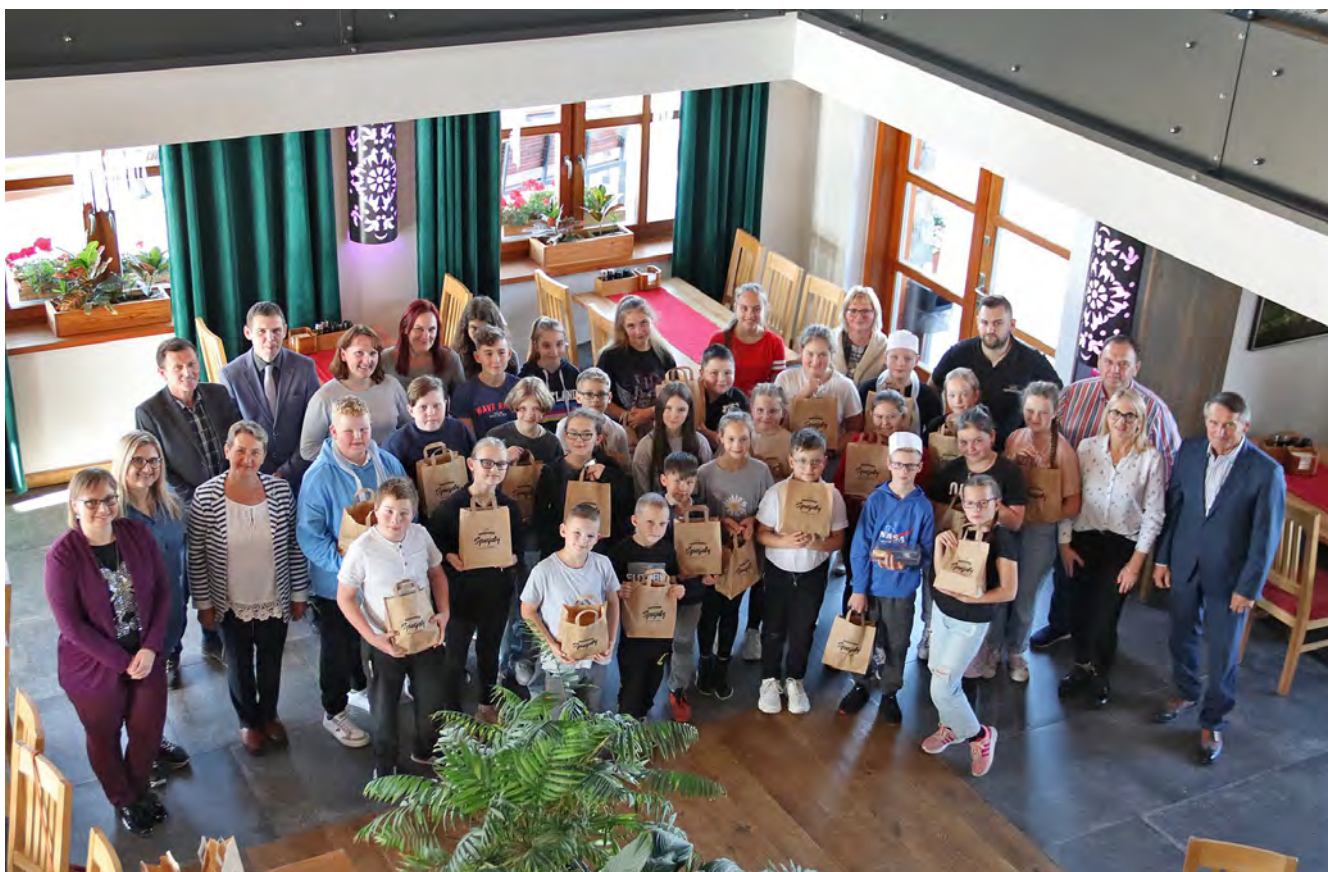
Konkurs Kulinarny