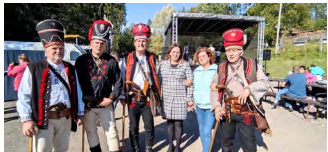
Rekonstrukcja na Hřčave i Beskidzcy Harnasie