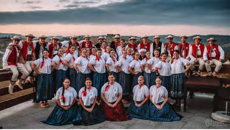
120 lat Zespołu Regionalnego Istebna