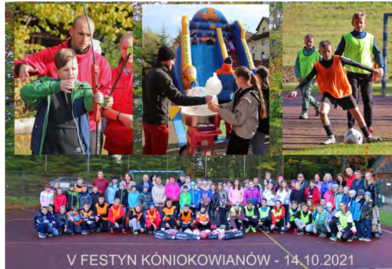
V FESTYN KÓNIAKOWIANÓW - 14.10.2021