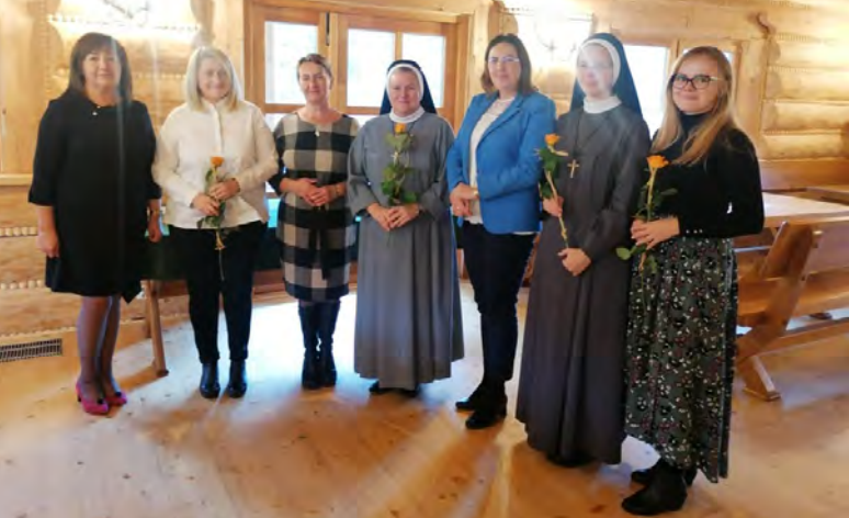
Dyrektorki przedszkoli niepublicznych oraz wójt gminy Istebna i dyrektor CUW I fot. Aneta Legierska