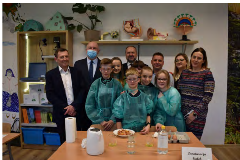
Otwarcie Zielonej Pracowni 2021 pn. „Życie nicią malowane” | fot. Małgorzata Owczarczak