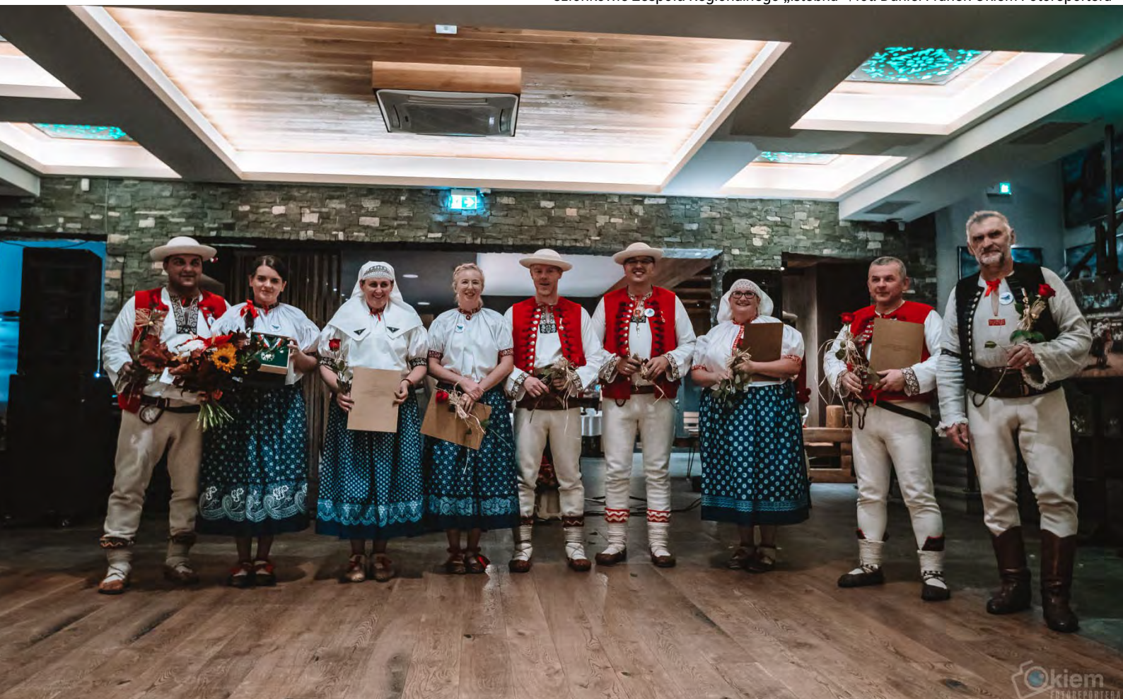
Członkowie Zespołu Regionalnego „Istebna”