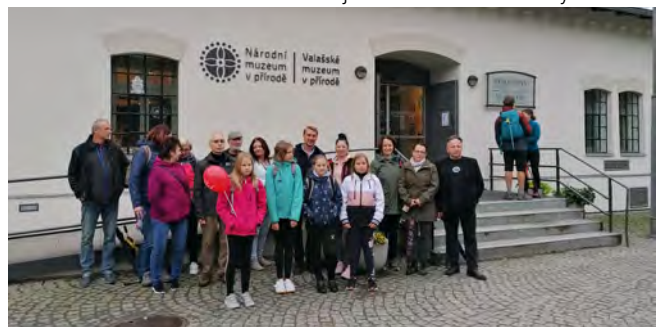
Uczestnicy wycieczki w Rožnovie pod Radhoštěm