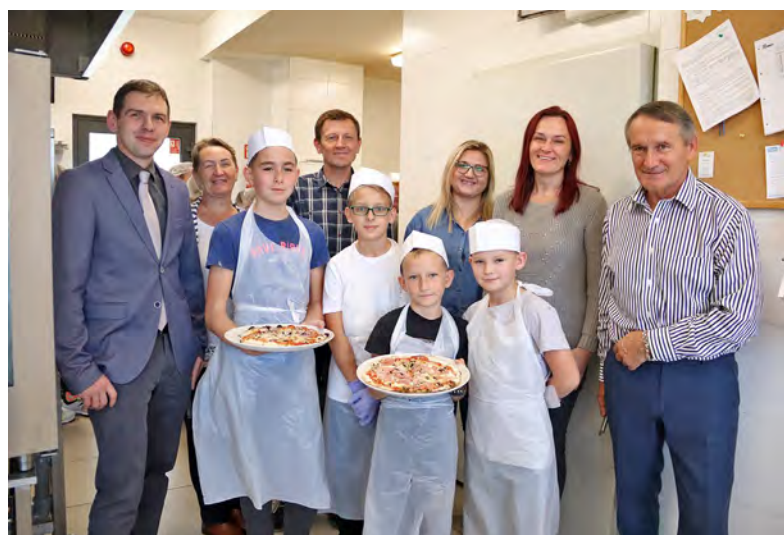
Konkurs Kulinarny