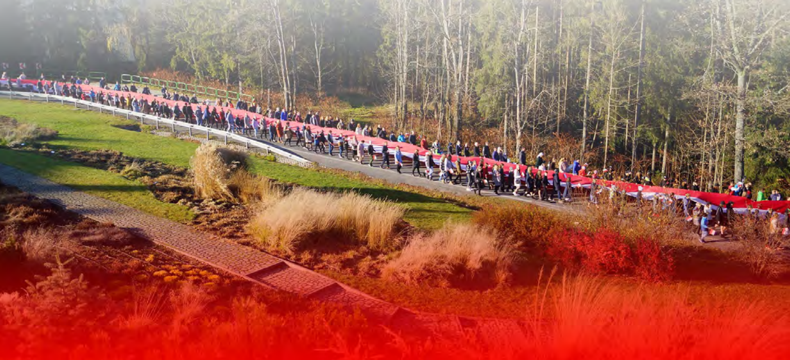
Święto Niepodległości. Marsz z biało-czerwoną flagą przez Istebną