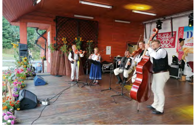
Fot. Fragment koncertu plenerowego Góralaska Jesień

W niedzielę 3 października 2021 r. odbyła się rekonstrukcja organizowana przez Obec Hřčava wraz z Gminnym