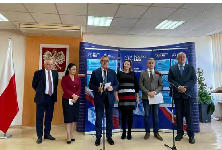
Spotkanie w sprawie programu Polski Łąd, przedstawiciele samorządów gminnych, powiatowych, wojewódzkich i krajowych