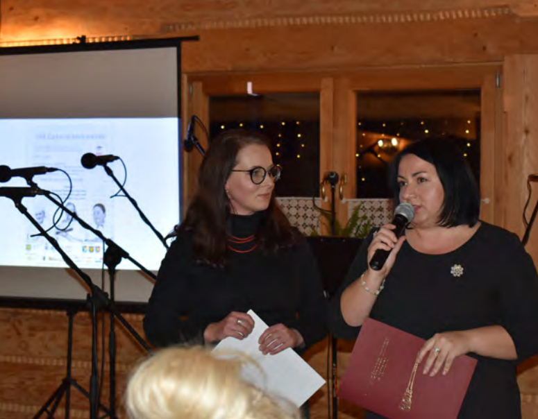
XXII Zaduszki Istebniańskie