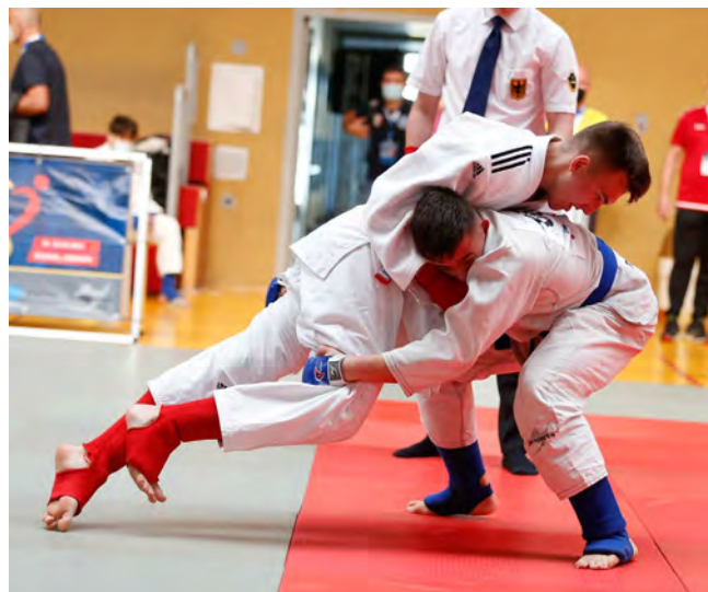
(z lewej)