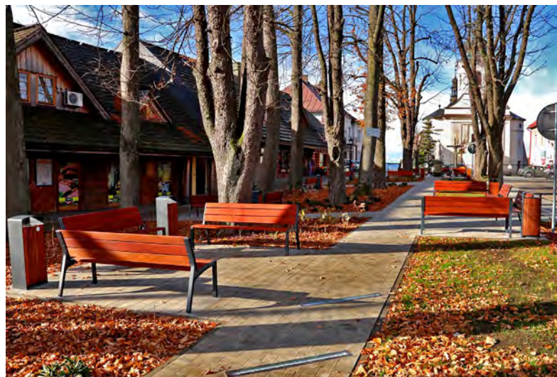
Zrewitalizowany park w centrum Istebnej

Park wdział nowe szaty: wymieniono chodniki, jak i podziemną linię energetyczną, zabezpieczono system korzeniowy starych drzew (kasztanów i lip), dokonano nasadzeń krzewów i roślin ozdobnych oraz trawnika, ustawiono nowe ławki i kosze na śmieci.