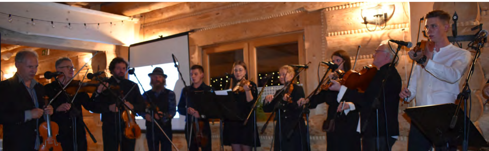
XXII Zadaszki Istebniańskie