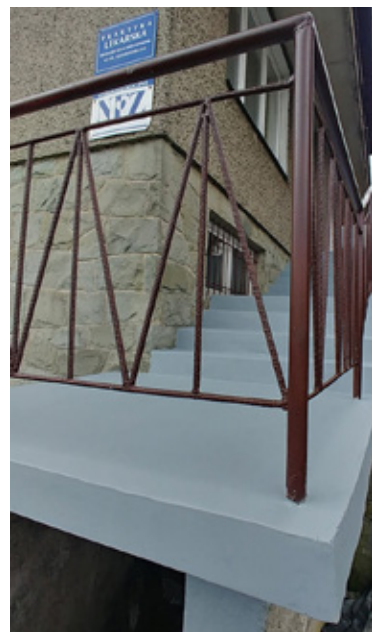
Nowe schody przy ośrodku zdrowia w Jaworzynce