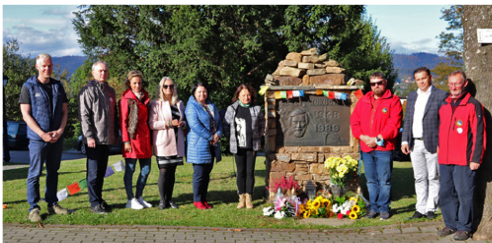
Uroczyste złożenie kwiatów pod pomnikiem Jerzego Kukuczki