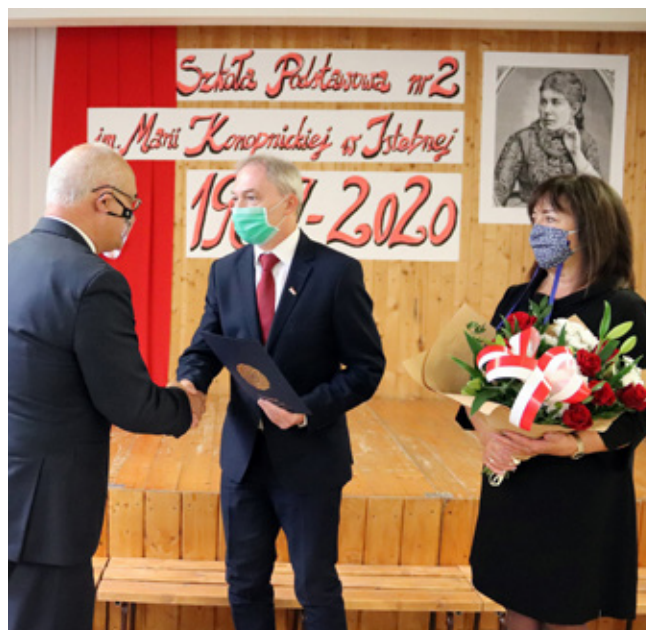
Przekazanie listu gratulacyjnego Dyrektorowi Szkoły