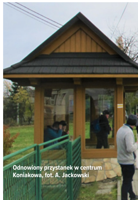
Odnowiony przystanek w centrum Koniakowa