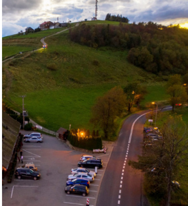
Fragment DW 943 pod Ochodzitą