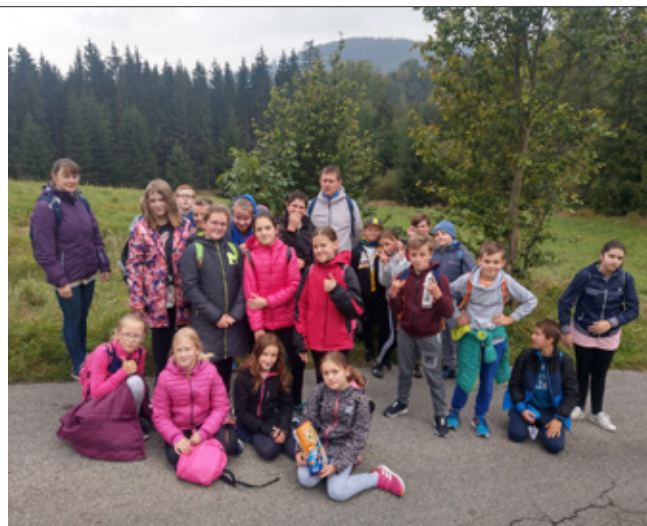
Uczniowie SP nr 1 w Jaworzynce podczas wycieczki