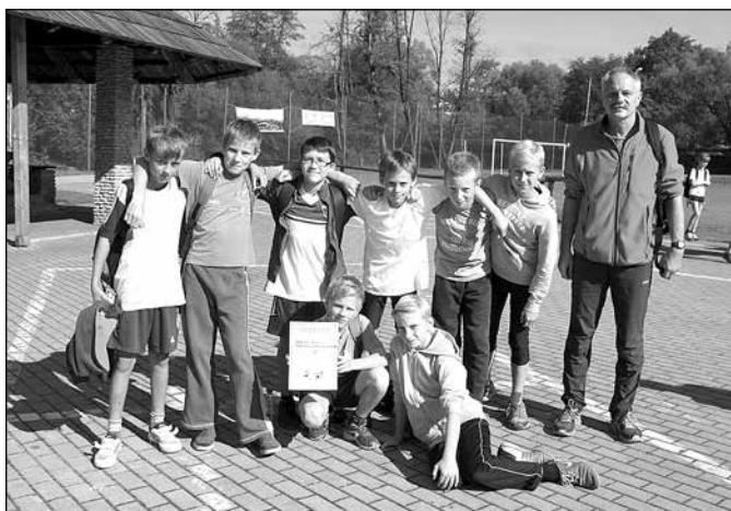
Najlepsi wśród chłopców biegacze z ZSP SP 1 Istebna