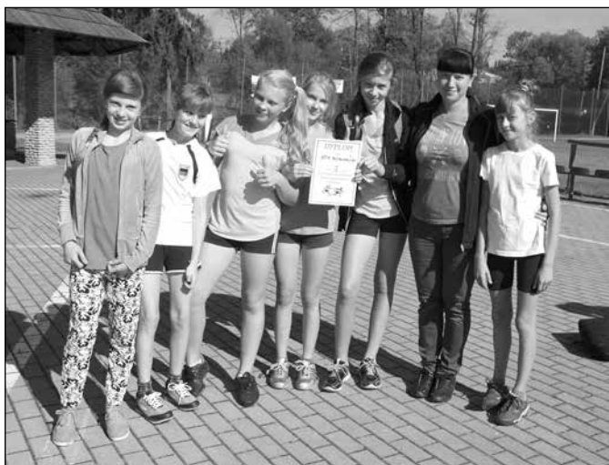
Zwycięska sztafeta dziewcząt z SP 1 Koniaków