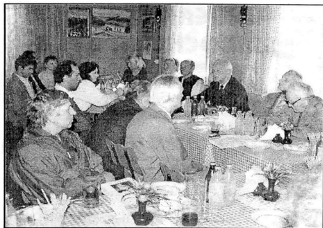
Obrady plenarne ZG MZC w Jaworzynce-Zapasiakach

Po dyskusji doszło do uzgodnienia, że wspólnie z GOK w Istebnej MZC zorganizuje w przyszłości warsztatowe spotkania dzieci z Cieszyna celem poznania i przybliżenia kultury ludowej naszego regionu z zakresu kuchni, twórczości literackiej, folkloru itp.