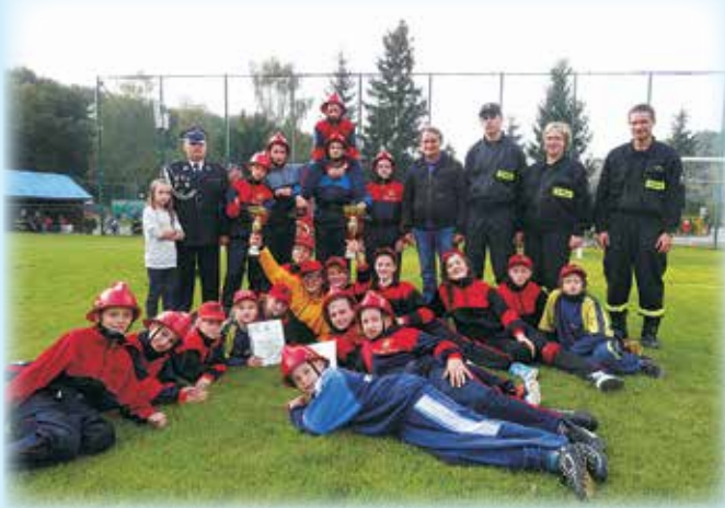
Zwycięskie drużyny w zawodach z opiekunami