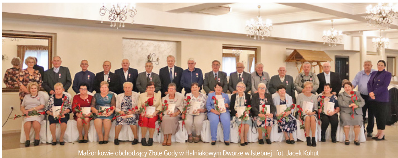
Małżonkowie obchodzący Złote Gody w Halniakowym Dworze w Istebnej