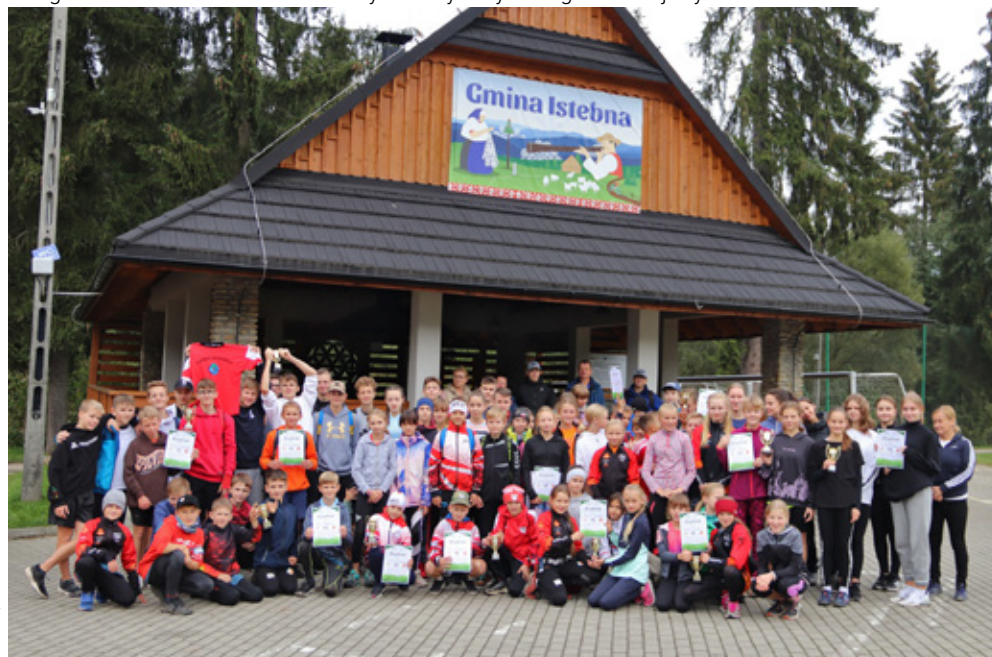
Fotografia zbiorowa uczestników Gminnych Drużynowych Biegów Przełajowych I fot. Jacek Kohut