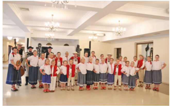
Zespół Regionalny "Mała Istebna" uświetnił spotkanie