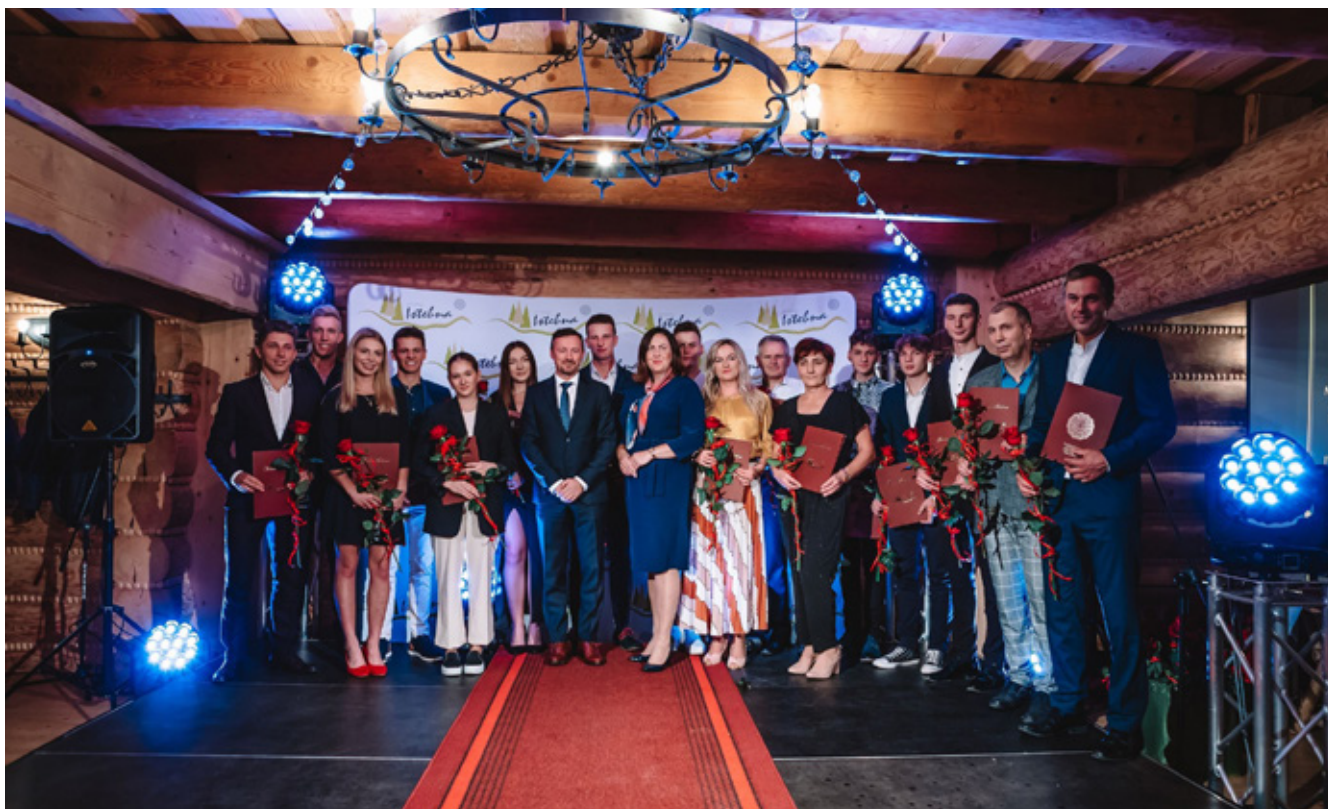
Laureaci Nagrody Wójta Gminy Istebna