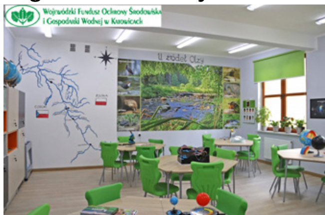
Zielona Pracownia „U źródeł Olzy” w ZSP Istebna