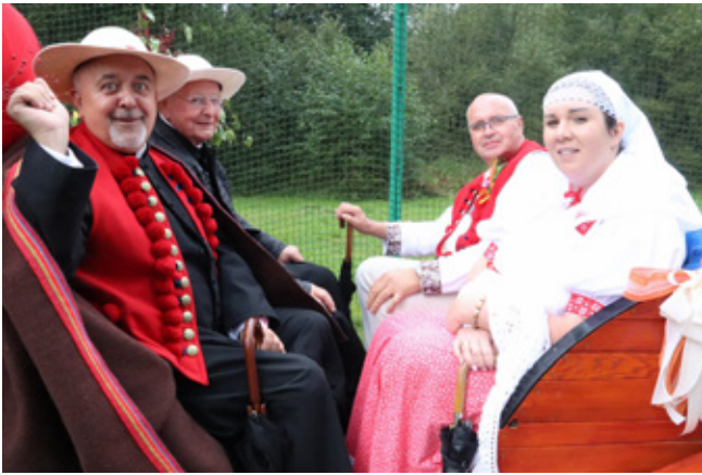
Uczestnicy korowodu w drodze do amfiteatru „Pod Skocznią”

Gazdowie z Jaworzynki reprezentowali place: Małysze, Czeczory, Jasie i Byrty oraz Wawrzaczów Groń, Małejurki i Szkarwany na Trzycatku.