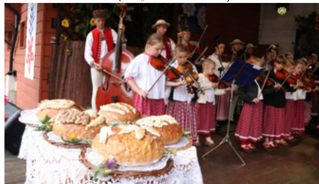
Kapela „Jetelinka z Jaworzynki”

Roksana Klamka – Dział Promocji Gminnego Ośrodka Kultury w Istebnej