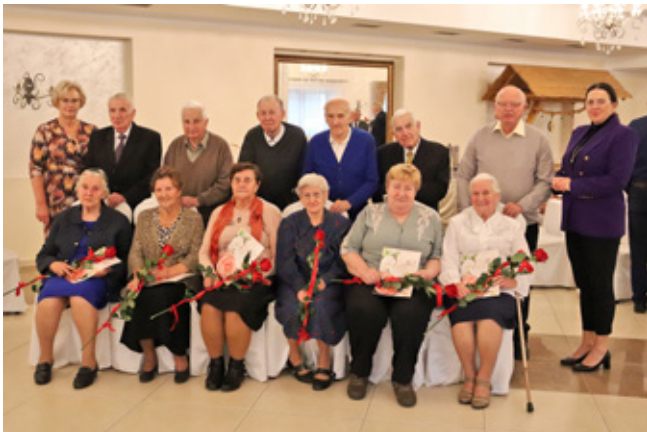
Jubilaci obchodzący 60-lecie małżeństwa (Diamentowe Gody) | fot. Jacek Kohut

Niezwykle uroczysty charakter miało spotkanie małżonków obchodzących w tym roku Złote i Diamentowe Gody, które zgodnie z coroczną tradycją odbyło się w dniu 21 września w Halniakowym Dworze w Istebnej.