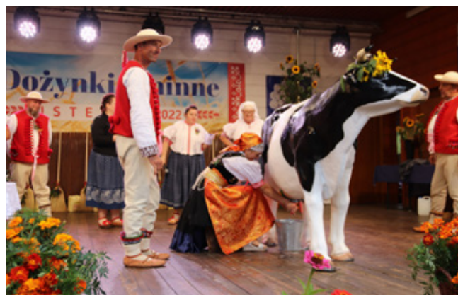
Dożynkowe konkurencje dla gazdów, w roli głównej krowa „Krasula”

Gazdowie z Koniakowa reprezentowali plące: Dejówka, Jasiówka, Bombolówka, Gąszcz, Cisowe, Chrechlówki, Długa Czerchla, Mała Łączka.