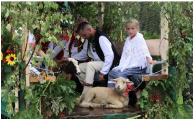
Uczestnicy dożynek jadący w barwnym korowodzie

Organizatorzy składają serdeczne podziękowania: