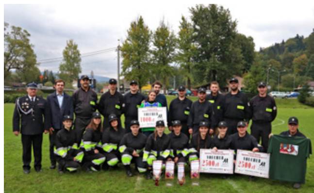
Zwycięskie drużyny kobiet i mężczyzn z OSP Koniaków