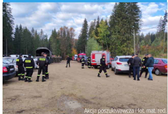
Akcja poszukiwawcza

Rodzina Bocek składa serdeczne podziękowania dla służb mundurowych, sąsiadów, rodziny i mieszkańców za udział w poszukiwaniu zaginionego brata.