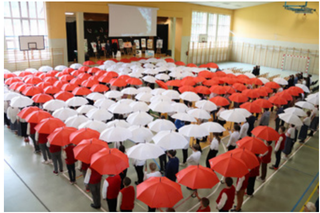
Ułożenie wojskowej szachownicy – symbolu polskich sił powietrznych, w hali ZSP w Istebnej, przez uczniów szkół z terenu Trójwsi

Wśród zaproszonych gości byli również: minister rodziny i polityki społecznej Stanisław Szwed , żołnierze 18 Bielskiego Batalionu Powietrznodesantowego, przedstawiciele XVIII Oddziału Ziemi Cieszyńskiej Związku Polskich Spadochroniarzy.