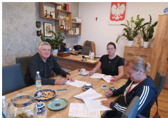
Podpisanie umowy z zarządem MKS Istebna

9 września w Urzędzie Gminy w Istebnej podpisana została umowa z Międzyszkolnym Klubem Sportowym Istebna z zakresu: Ochrona i promocja zdrowia – przeciwdziałanie alkoholizmowi pn: „Aktywne dzieci i młodzież w gminie Istebna poprzez popularyzację biegów narciarskich”. Projekt skierowany jest do grupy ok. 30 uczestników z terenu gminy Istebna, z podziałem na 3 grupy szkoleniowe po 10 osób. Zajęcia będą odbywać się po ok. 2 godz. 5 dni w tygodniu i będą mieć charakter wychowawczy ze wskazaniem na zdrowy tryb życia. Podczas realizacji zadania kadra trenersko-instruktorska zaprezentuje uczestnikom prelekcję dotyczącą zwalczania nałogów alkoholowych oraz skutków działania alkoholu. Dodatkowo uczestnicy otrzymają gadżety promujące profilaktykę antyalkoholową. Projekt będzie opierał się na trzech głównych dziedzinach: