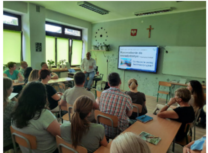
Nauczyciele podczas szkolenia