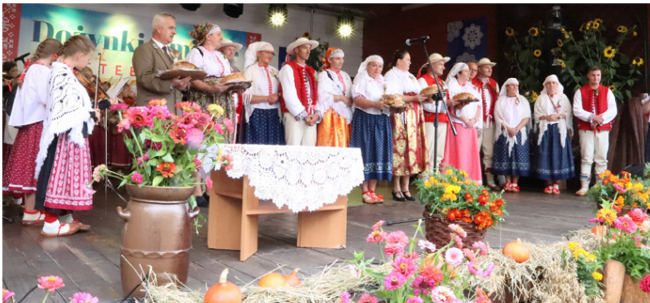
Dożynki Gminne 2022