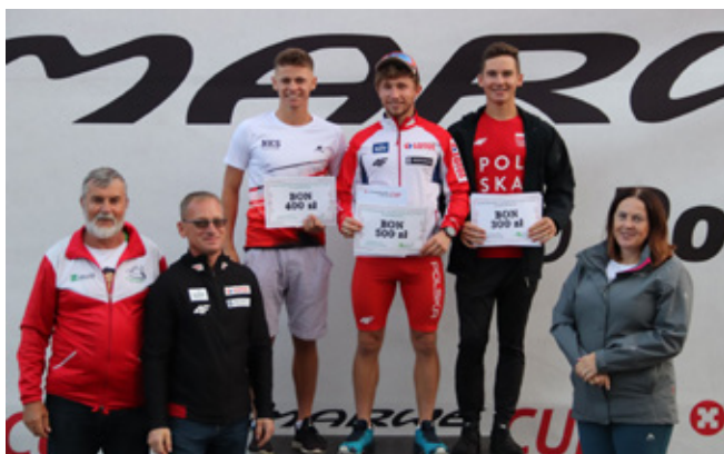
Podium w kategorii seniorów I