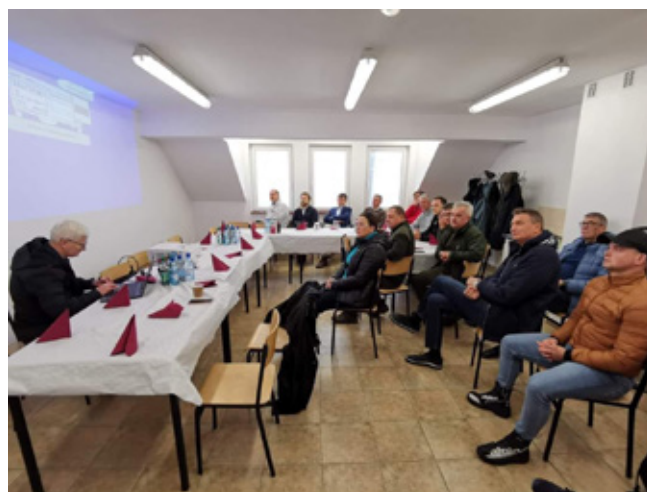
Prezentacja nowego systemu naśnieżania podczas spotkania dotyczącego tras biegowych na Kubalonce