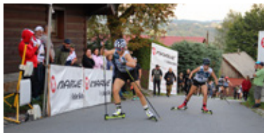
Rywalizacja na drogach Jaworzynki I fot. Jacek Kohut

W sobotę 10 września odbyły się II Zawody O Puchar Wójta Gminy Istebna oraz Marwe Cup – Puchar Polski na Nartorolkach .