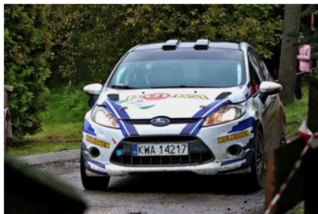
67. Rajd Wisły w Trójwsi