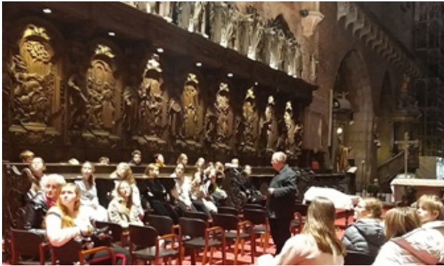
Zwiedzanie katedry wrocławskiej