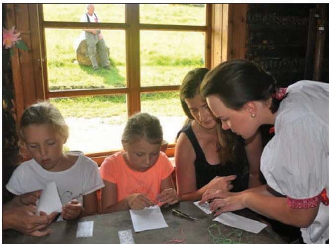
Warsztaty haftu krzyżykowego

Następnie kustoszki muzeum opowiedziały i pokazały także, jak kiedyś wyglądało bielenie Inianego płótna na słońcu. Co ciekawe był to proces długi i żmudny, a zajęcie to wykonywały najczęściej dzieci.