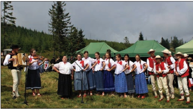
Zespół Koniaków na Hali Baraniej