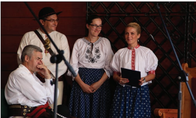
III Zjazd Karpacki

W czwartek od samego rana tłoczno było przy Ośrodku Szkoleniowo – Wypoczynkowym Szarotka w Istebnej. Tam bowiem zebrali się uczestnicy konferencji pt. „Wołosi w europejskiej i polskiej przestrzeni kulturowej. Migracje – osadnictwo – dziedzictwo kulturowe” przygotowanej przez prof.