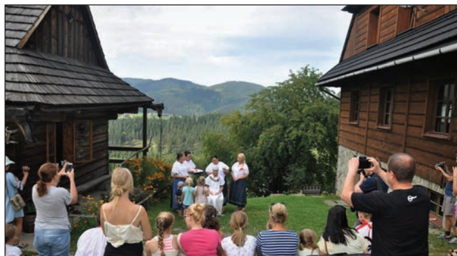
Pokaz czepienia młoduchy

Zadanie odbyło się w ramach zadania „Szkolenie zdobienia elementów stroju beskidzkim haftem krzyżykowym z