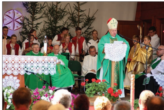
Uroczysta Msza Święta w amfiteatrze Pod Skocznią