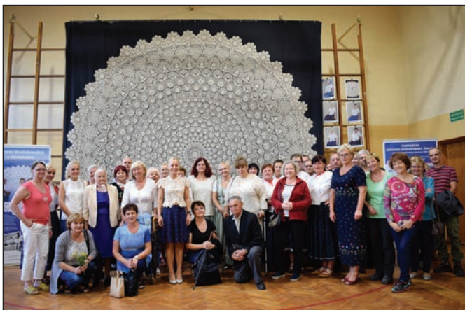
Uczestnicy i goście

W czasie Dni Koronki w Koniakowie było na co popatrzeć także za sprawą twórców ludowych, którzy prowadzili tutaj swoje stoiska. Prócz koronek można tu było zakupić biżuterię z motywami haftu, spódnice z modrzyńca czy folkowy