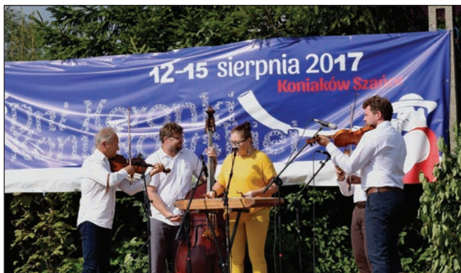
Koncert kapeli Wałasi