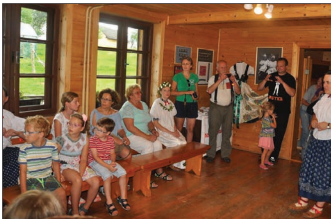
Wernisaż wystawy haftu beskidzkiego

odbył się również kiermasz rękodzieła , na którym można było zakupić haftowany obrus, zakładkę do książki, biżuterię, czy regionalną zabawkę.