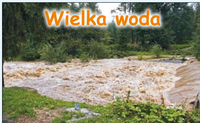
Rzeka Olza w okolicach Amfiteatru Pod Skocznią w dniu 1.09.2010