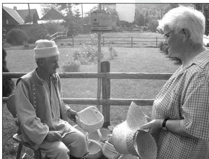
Twórca koszy podczas jarmarku

Swoje słowa uznania wyraził także przebywający wraz z małżonką w Koniakowie Marek Jurek .