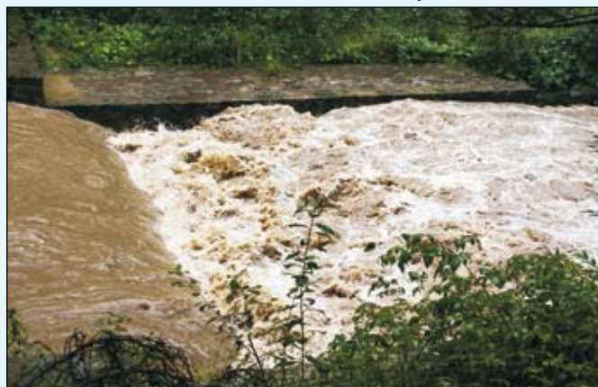
Splywająca do Olzy woda: z lewej z pól, a z prawej z lasów.