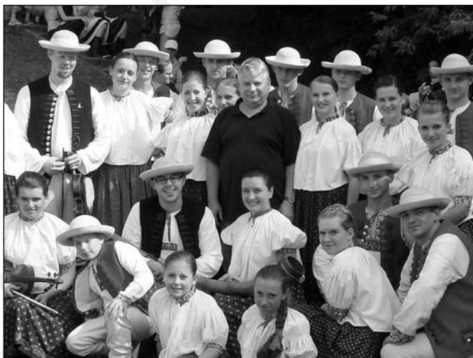
Istebna w Kościerzynie – wśród widzów był m.in. Marszałek Senatu Bogdan Borusewicz