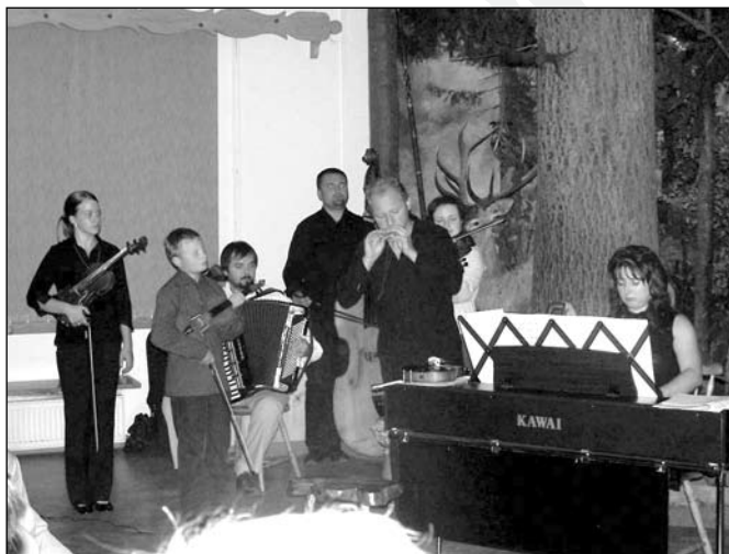
Koncert Chopinowski w Istebnej

Koncert przebiegł w bardzo eleganckim i nastrojowym klimacie. Oryginalne połączenie brzmień fortepianu ze skrzypcami, gajdami i fujarkami dało niepowtarzalne wrażenia. Liczni goście byli zachwyceni, a wiele osób spoza Isteb-