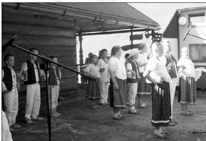
„Mali Zgrapianie” podczas Dni Koronki

Dodatkową atrakcją dla uczestników były stoiska z twórczością ludową rozstawione wokół „Karczmy Kopyrtołka”, na której terenie odbywała się impreza. Można było zobaczyć nie tylko koronkę koniakowską, ale i klockową prezentowaną