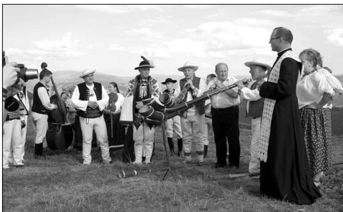
Odsłonięcie pamiątkowego pomnika na Ochodzitej