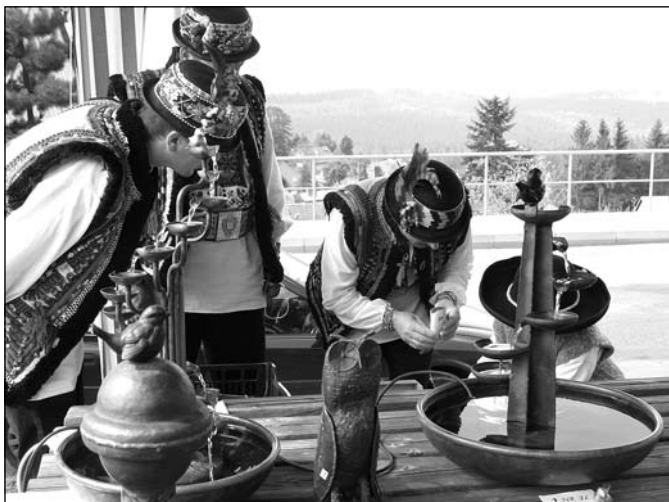
Kapela huculska ogląda kotły w Koniakowie