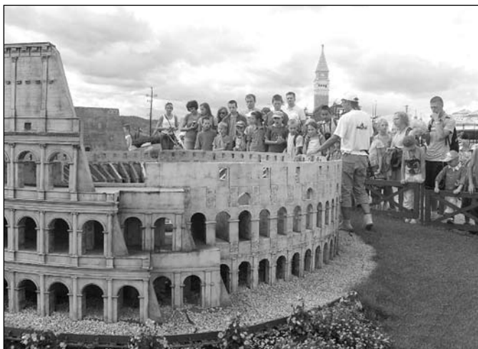
W Parku Miniatur w Inwałdzie

„Dobrze widzi się tylko sercem” – ten cytat z „Małego księcia” towarzyszył dzieciom oraz młodym animatorom – wolontariuszom podczas 4. już akcji wakacyjnej.