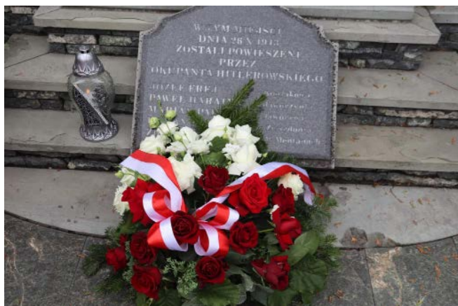
Złożone kwiaty przed tablicą upamiętniającą pomordowanych w centrum Istebnej w czasie II wojny światowej