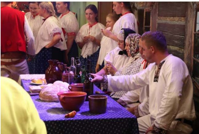
Zespół Regionalny „Koniaków”