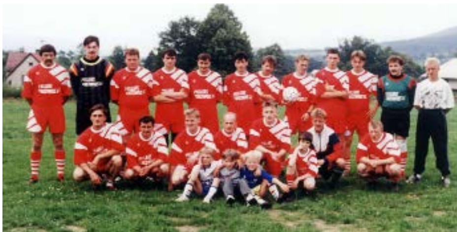
Pierwsze oficjalne zdjęcie drużyny po rejestracji, wiosna 1997