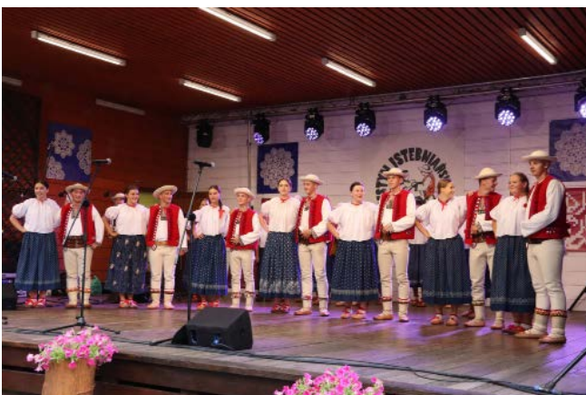
Fot. Zespół Regionalny „Istebna” | fot. Jacek Kohut