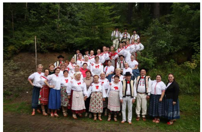
Fot. Zespół „Watra” | fot. Jacek Kohut