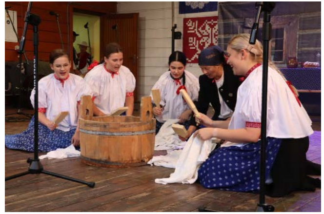
Zespół Regionalny „Koniaków”