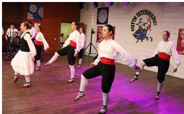
Zespół „Goizaldi” z Kraju Basków

Przyszedł czas na pierwszych zagranicznych gości – zespół „Zemplín” z Michalovic ze wschodniej Słowacji. Pokazali folklor i tańce swojego regionu – Zemplína. Tancerze wystąpili w trzech różnych strojach, prezentując prawdziwie światowy poziom, co nagrodzone zostało gromkimi brawami.