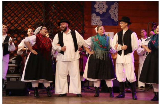
Zespół „Varaždin” z Chorwacji