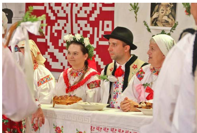
Zespół „Watra”

W niedzielę deszcz pokrzyżował nam szyki i korowód zespołów niestety się nie odbył. Atmosfera w amfiteatrze była jednak tak gorąca, że wspólnie udało się przegonić deszcz i wywołać pierwsze tego weekendu, nieśmiałe promienie słońca.