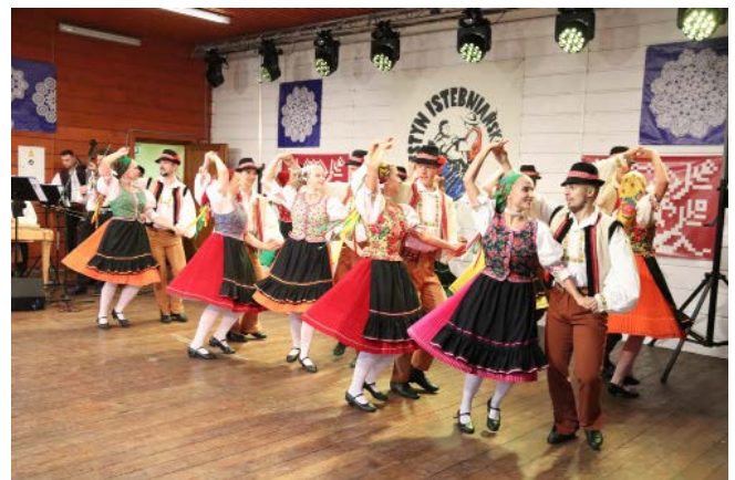
Zespół „Zemplín” z Michalovic – Słowacja