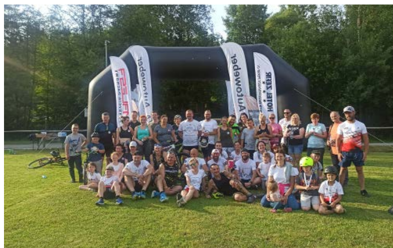
Uczestnicy biegu „Przełoń raka dla dzieciaka”