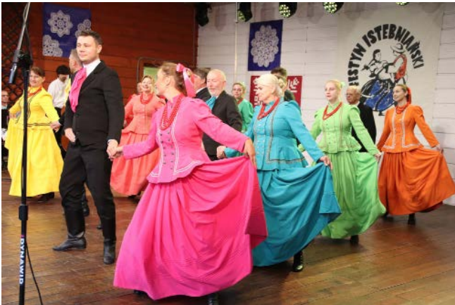
Zespół Pieśni i Tańca „Rybarzowice”