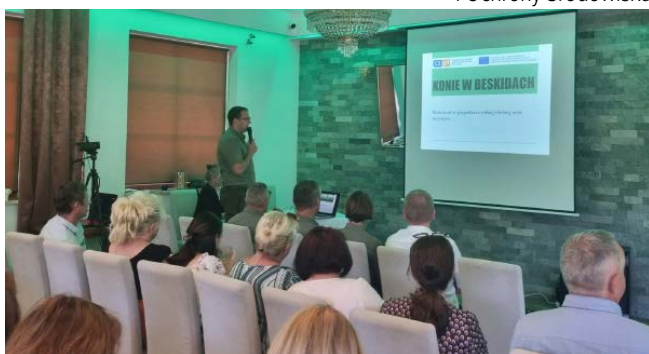
Konferencja kończąca projekt „Konie w Beskidach”

Wioleta Golik – podinspektor w Referacie Rozwoju, Infrastruktury i Ochrony Środowiska