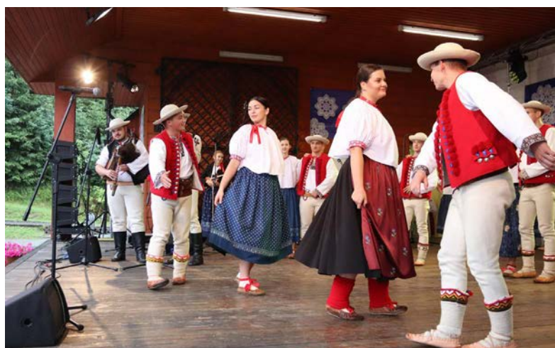
Zespół Regionalny „Istebna”