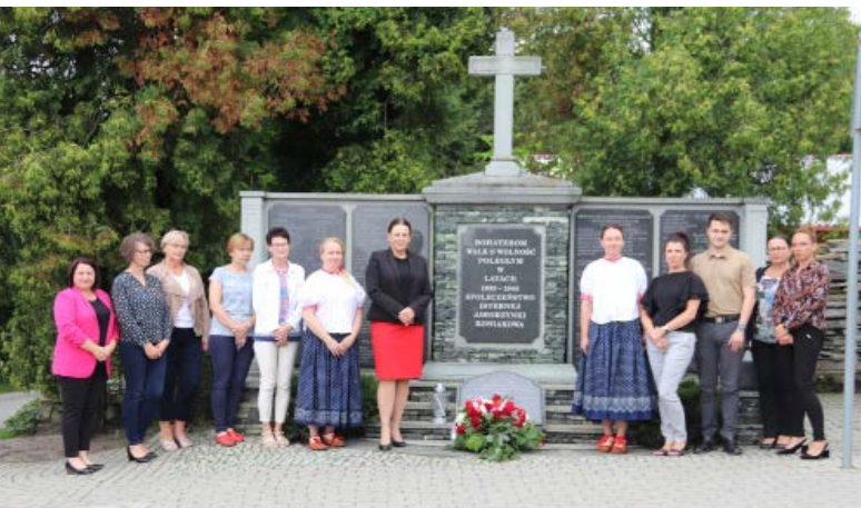
Delegacja UG i GOK w centrum Istebnej przed pomnikiem Bohaterów Walk o Wolność poległym w latach 1939 – 1945