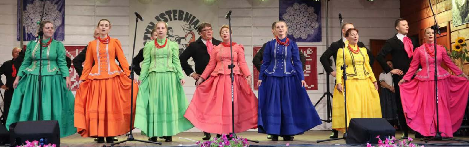
Zespół Pieśni i Tańca „Rybarzowice”