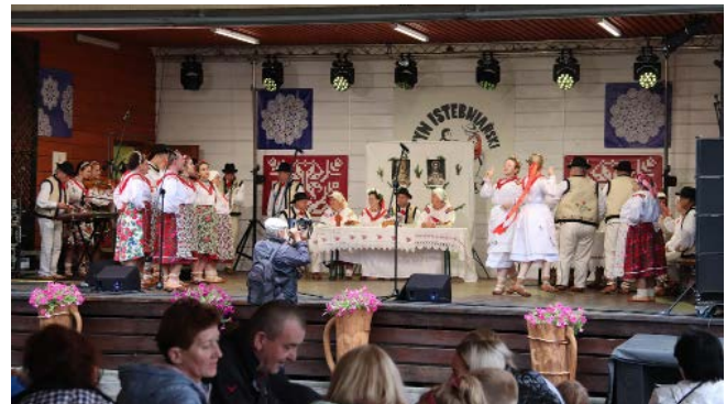
Zespół „OwCoK” z Jabłonki