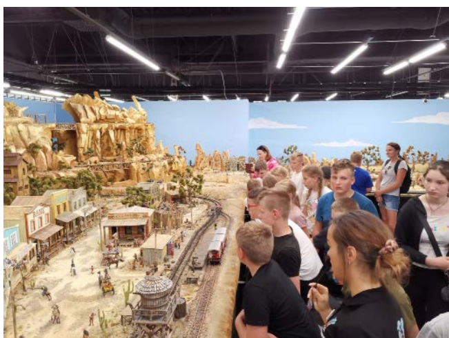
„Wakacje z Wójtem”, wizyta na wystawie Kolejkowo