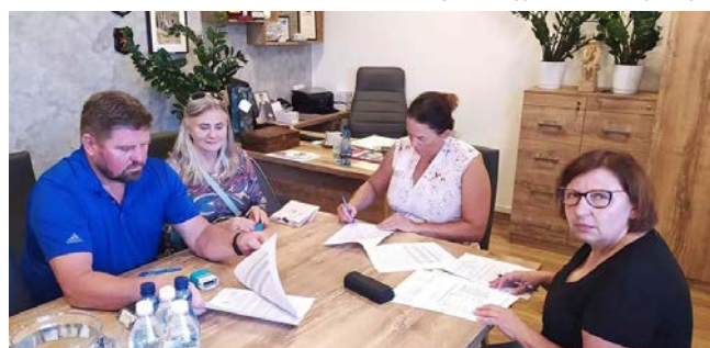
Podpisanie umowy z przedstawicielami SPTTK

Edyta Jałowiczor – podinspektor w Referacie Społeczno-Organizacyjno-Informatycznym