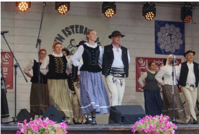
Zespół „OwCoK” z Jabłonki