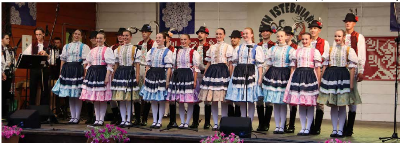
Zespół „Zemplín” z Michalovic – Słowacja