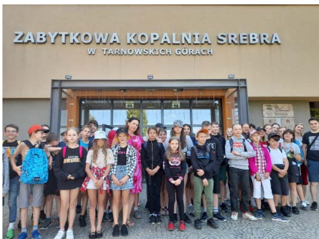
„Wakacje z Wójtem”, wizyta w kopalni srebra w Tarnowskich Górach