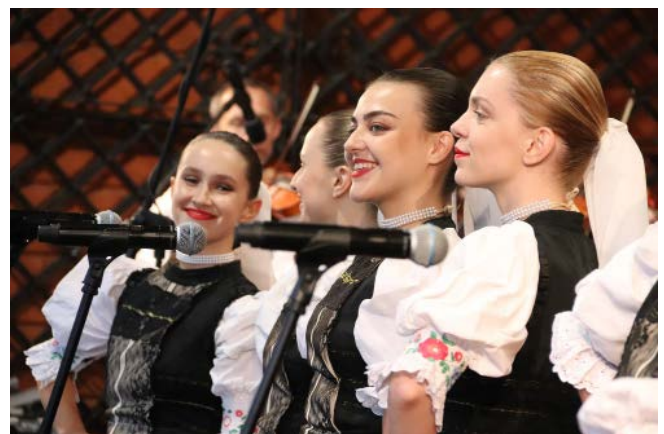
Zespół „Zemplín” z Michalovic – Słowacja