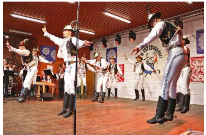
Zespół „Zemplín” z Michalovic – Słowacja