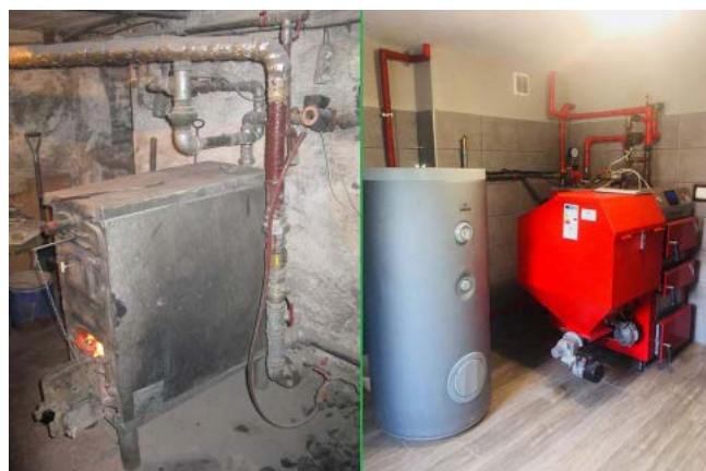
Wymiana pieców