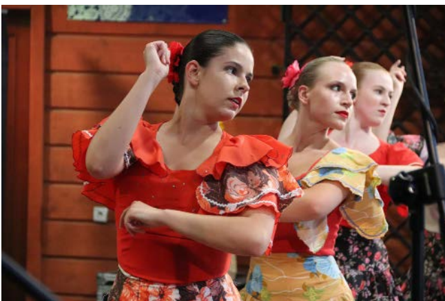
Zespół „Zemplín” z Michalovic – Słowacja