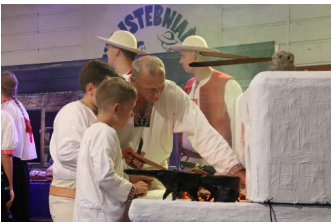
Zespół Regionalny „Koniaków”