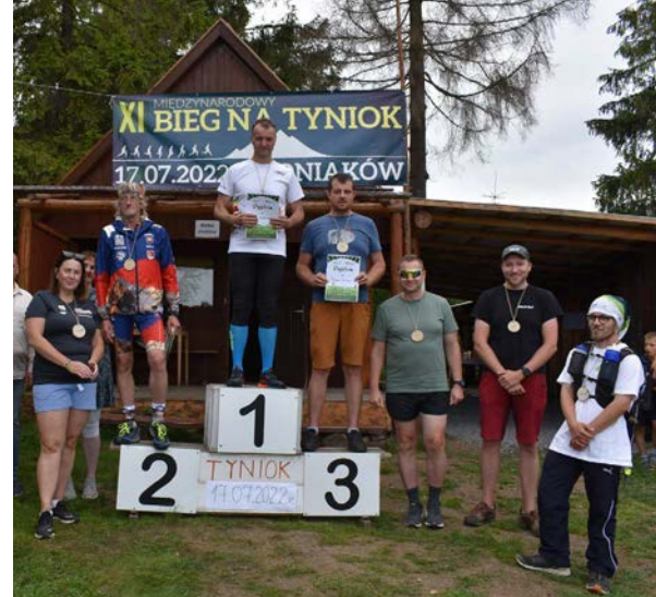
11. Międzynarodowy Bieg na Tyniok