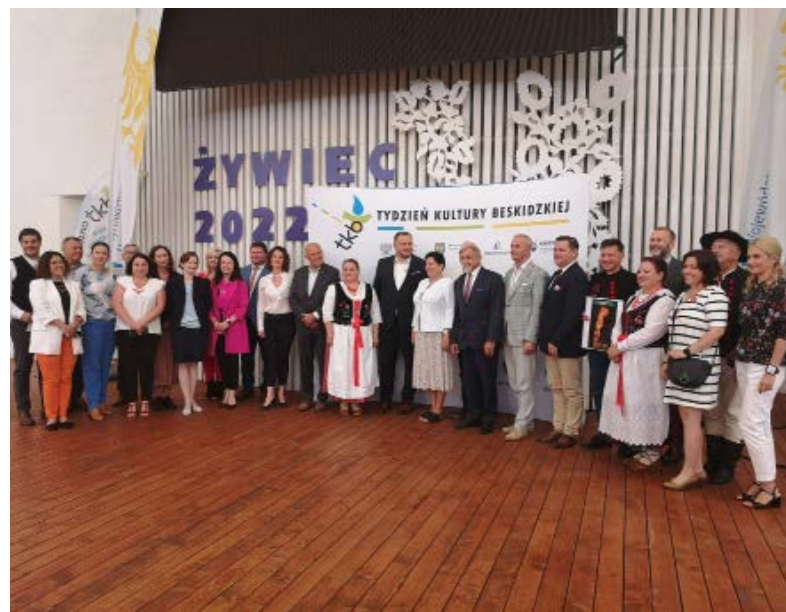
Uczestnicy konferencji TKB