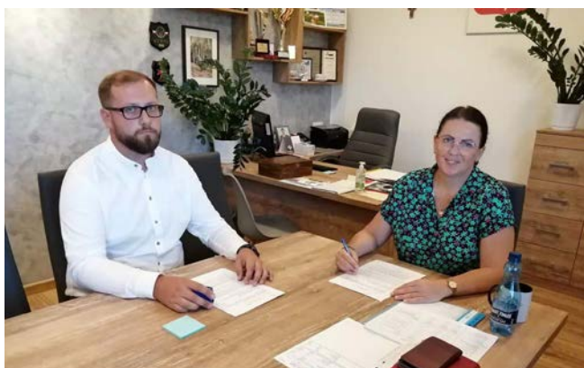
Podpisanie umów z przedstawicielami OSP