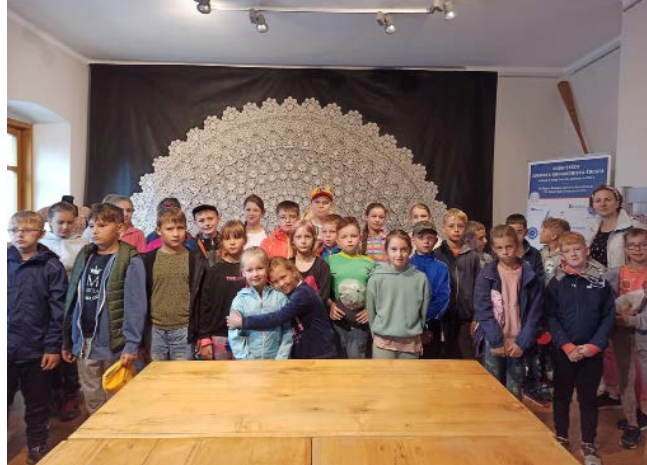
Półkolonie SP2 Istebna