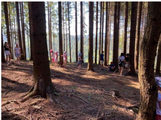
Półkolonie SP2 Jaworzynka

W Szkole Podstawowej Nr 2 w Koniakowie-Rastocze pierwszy dzień przebiegał w temacie malarstwa. Dzieci pod czujnym okiem wychowawców przenosiły swoje pomysły na drewno, z czego powstały piękne obrazy. Twórczości uczestników towarzyszyła piękna muzyka Vivaldiego „Cztery pory roku”. Dodatkowo czas wypełniony był zajęciami sportowymi oraz pracą grupową, podczas której każda z grup opracowywała swoją nazwę, okrzyk i piosenkę.