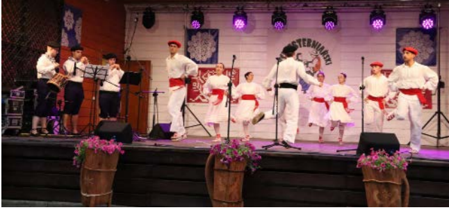
Zespół „Goizaldi” z Kraju Basków