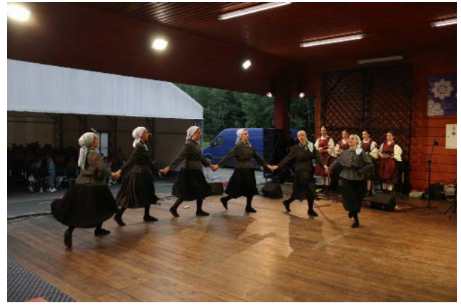
Zespół „Varaždin” z Chorwacji