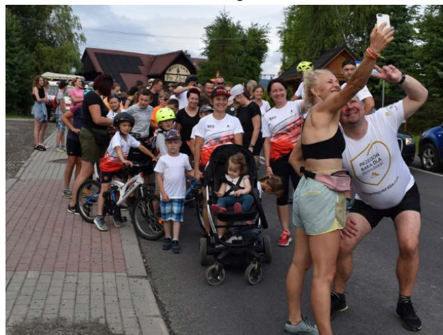
Uczestnicy biegu „Przełoń raka dla dzieciaka”