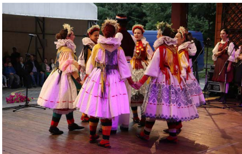
Zespół „Varaždin” z Chorwacji