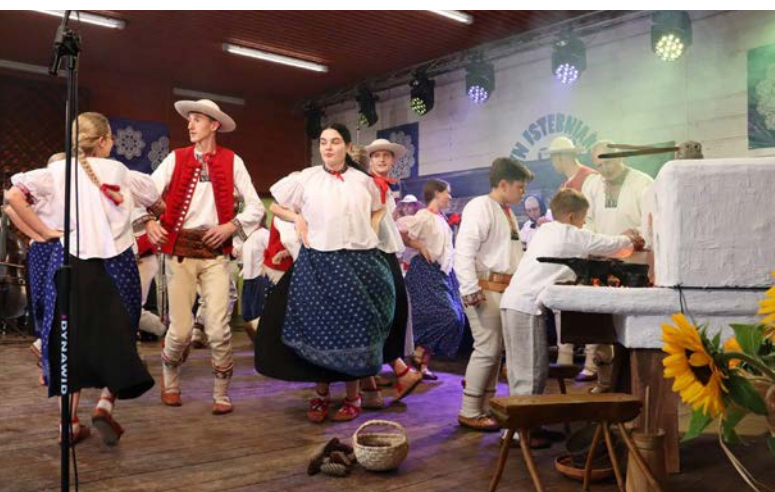
Fot. Jacek Kohut | Zespół Regionalny „Koniaków”