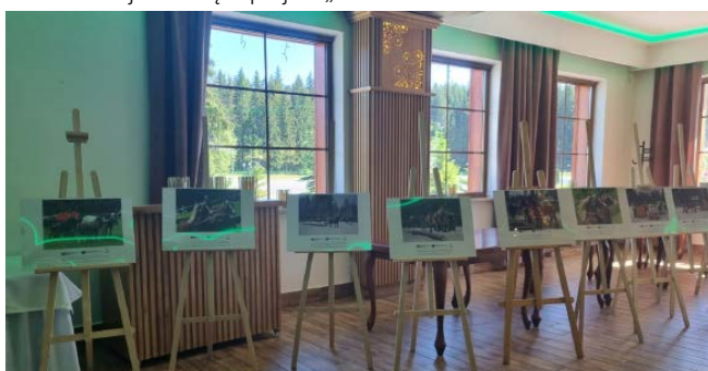
Wystawa zdjęć „Konie w Beskidach”