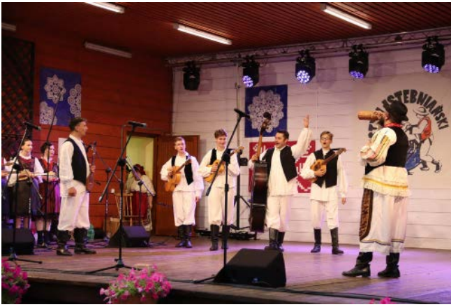
Zespół „Varaždin” z Chorwacji