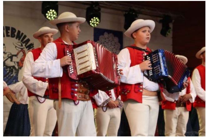
Zespół Regionalny „Istebna”

Oczywiście nie zabrakło pysznej kuchni – placki, golonko, czy krupnioki serwowali Zajazd Pecio oraz Kompleks