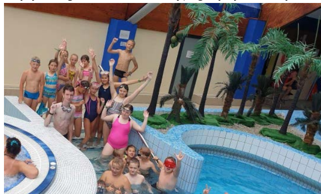
Półkolonie SP 2 Koniaków