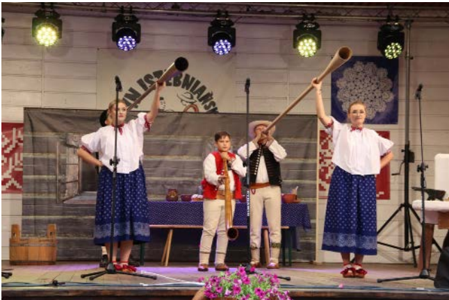
Zespół Regionalny „Koniaków”

Podczas bogatego programu przedstawili m.in. owiynzioki, świnszczok, masztołkę, czworoka, a także typowo kobiecy taniec kapusta oraz wykonywany przez mężczyzn zbójnicki. Na bis wspólnie z publicznością zatańczyli polkę.