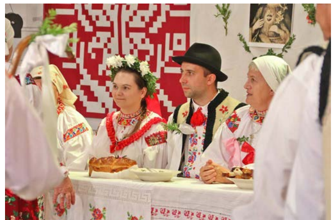
Zespół „Watra”