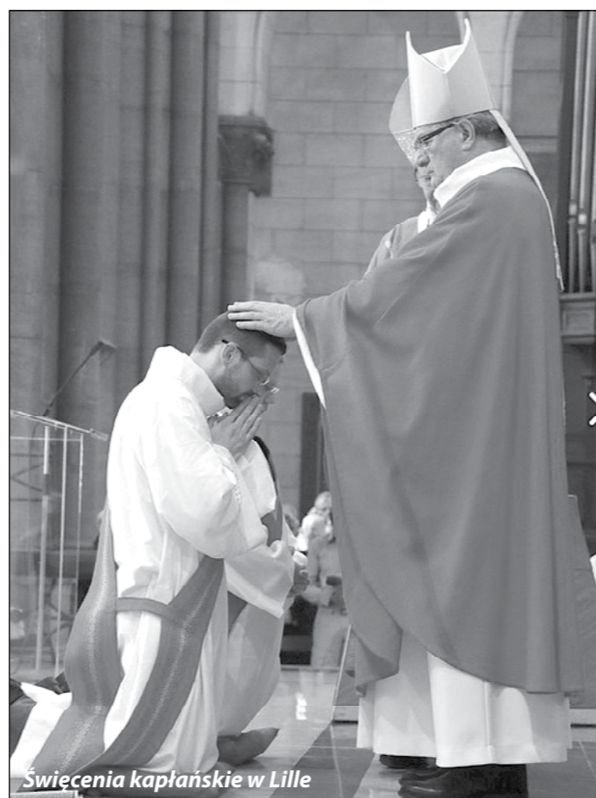
Święcenia kapłańskie w Lille