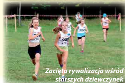
Zacięta rywalizacja wśród starszych dziewczynek