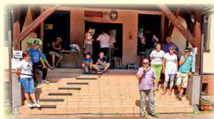
Tradycyjnie wszystko rozpoczęło się przy Szkole w Rastoce