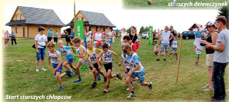
Start starszych chłopców