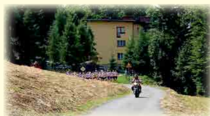
Start biegu pod kierunkiem pilota Genka