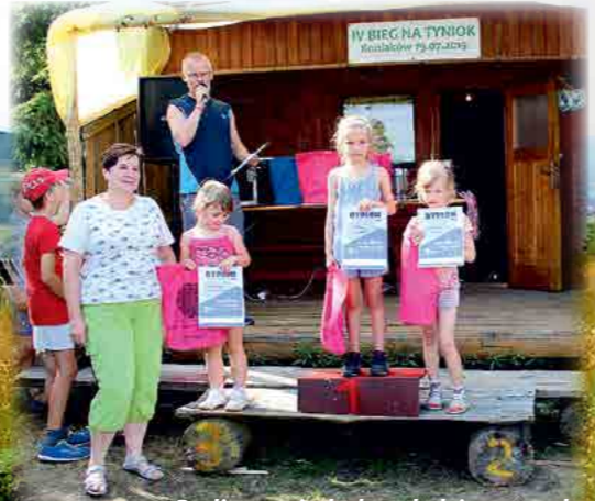
Podium najmłodszych dziewczynek