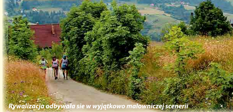
Rywalizacja odbywała się w wyjątkowo malowniczej scenerii