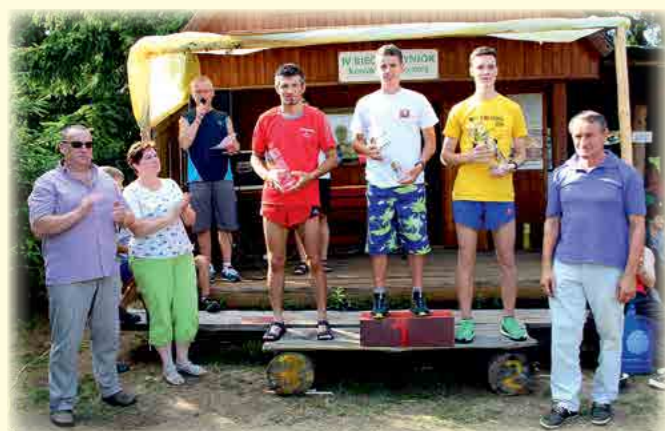
Podium Open mężczyzn