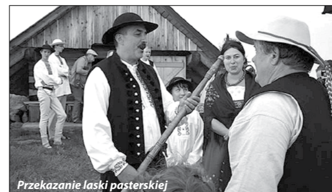
Przekazanie laski pasterskiej