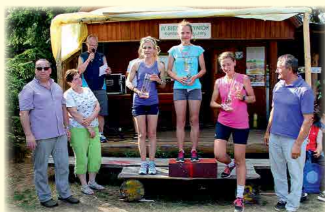
Podium Open kobiet