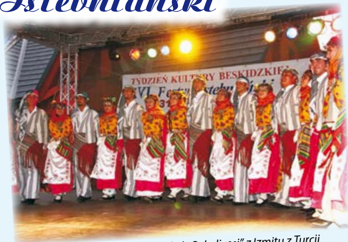
„Başıskele Belediyesi” z Izmitu z Turcji