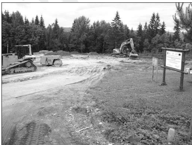
Roboty ziemne przy parkingu