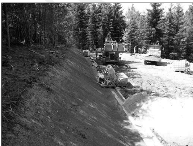
Plac pod wiatę edukacyjną 1