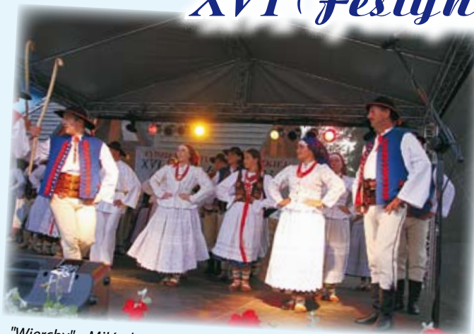
"Wierchy" z Milówki