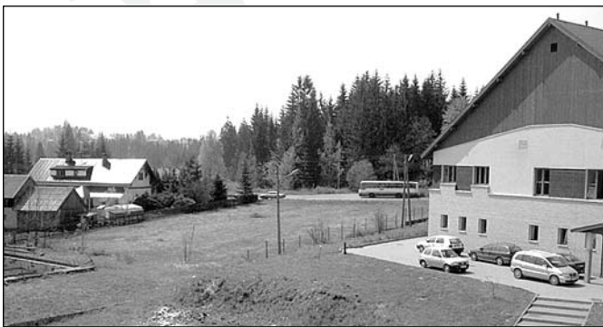
Tu powstanie „ORLIK”