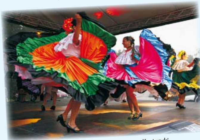
Zespół Inspiraciones Costarricenses” z San Jose z Kostaryki