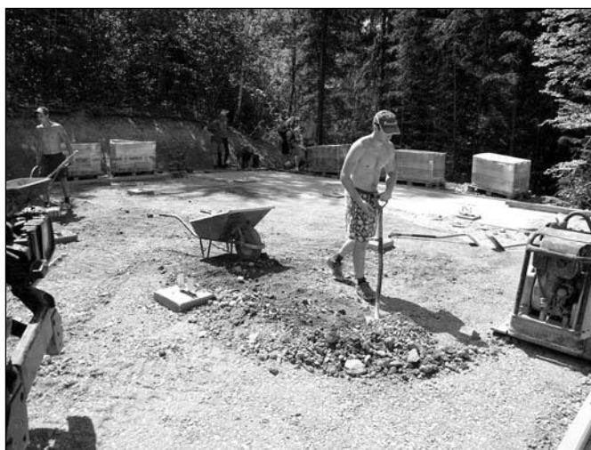
Plac pod wiatę edukacyjną 2