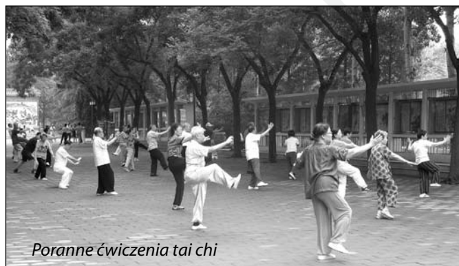
Poranne ćwiczenia tai chi

Będąc w Mongolii koniecznie chcieliśmy zobaczyć prawdziwe życie na stepach mongolskich, z dala od miast i szerzej rozumianej cywilizacji. Organizatorzy zabrali nas ok 60 km za miasto, aby pokazać nam potężny, 40-metrowy blaszany pomnik Czingis-Chana. Najciekawszy był jednak fakt, iż mogliśmy odwiedzić autentycznych pasterzy mieszkających w jurtach na środku stepu, z całą rodziną i stadami zwierząt. Było to dla nas trudne do wyobrażenia, jak jedna rodzina może spędzać życie w niewielkim przecież namiocie, gdzie