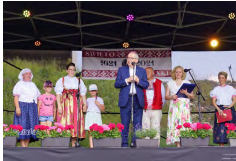
Przemawiający Stanisław Szwed, wiceminister Rodziny i Polityki Społecznej podczas Święta Jaworzynki