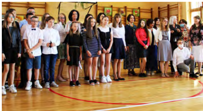
XIV Powiatowy Konkurs Poetycki im. Jana Kubisza „Kwiaty Ziemi Cieszyńskiej”, na zdjęciu uczestnicy konkursu

Pamiętam babcie, szum potoku, małe niezapominajki i ciszę westchnień! Chwilę, którą trzymam ze sobą w oku w niebieskim pudełeczku wspomnień.