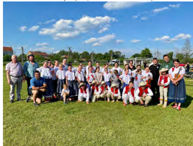
Uczestnicy Zespołu „Mała Istebna”