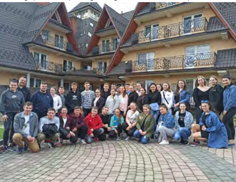
Zgrupowanie Zespołu Regionalnego „Istebna”