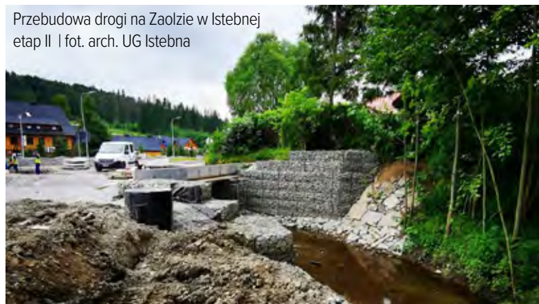
Przebudowa drogi na Zaolzie w Istebnej etap II