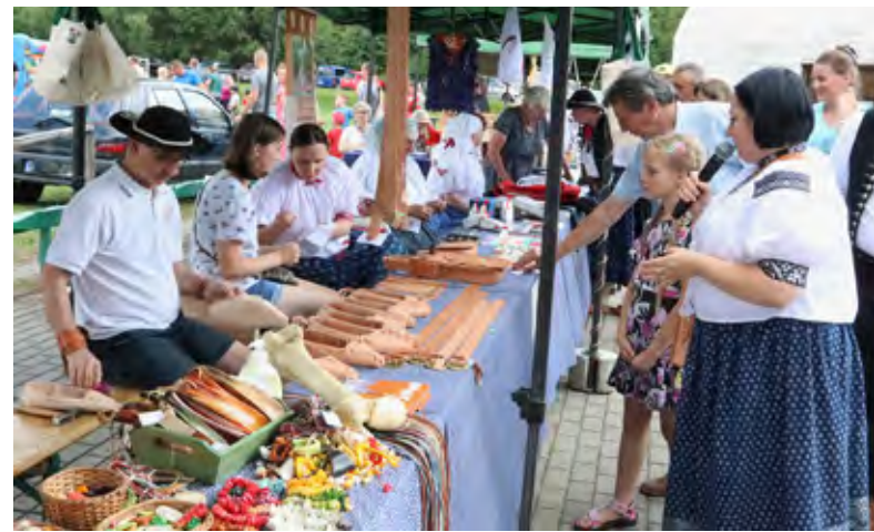
Międzynarodowa Wystawa Twórczości Ludowej