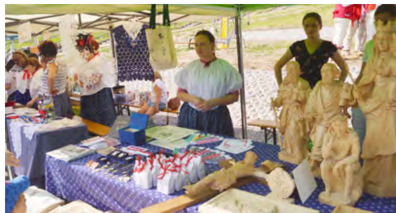
Wystawa Twórczości Ludowej