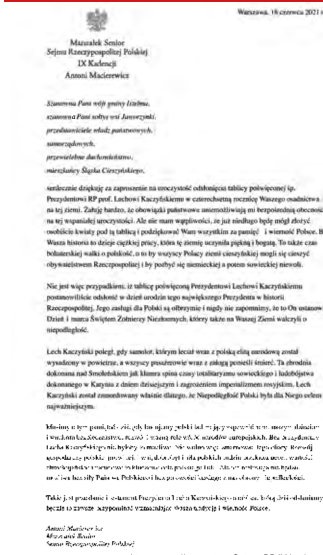
List marszałka seniora Sejmu RP IX kadencji Antoniego Macierewicza z okazji odsłonięcia tablicy upamiętniającej śp. Lecha Kaczyńskiego, skan pisma