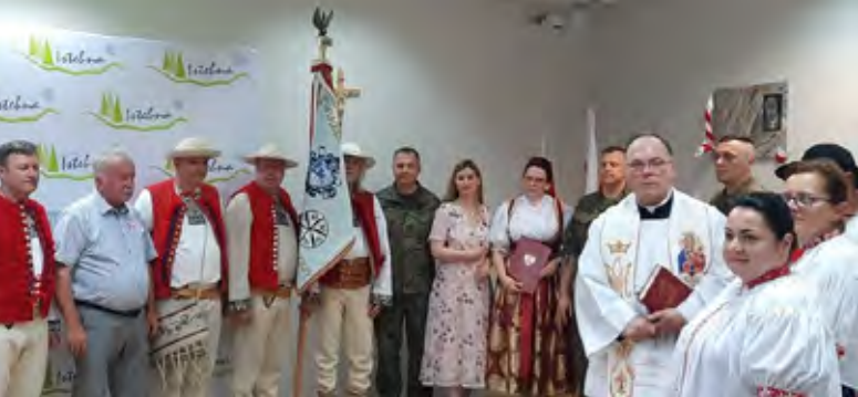
Odsłonięcie tablicy Lecha Kaczyńskiego