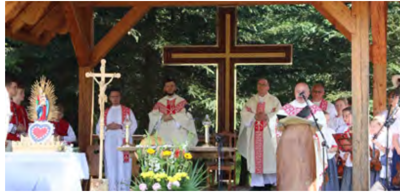
Księża odprawiający mszę na Trójstyku