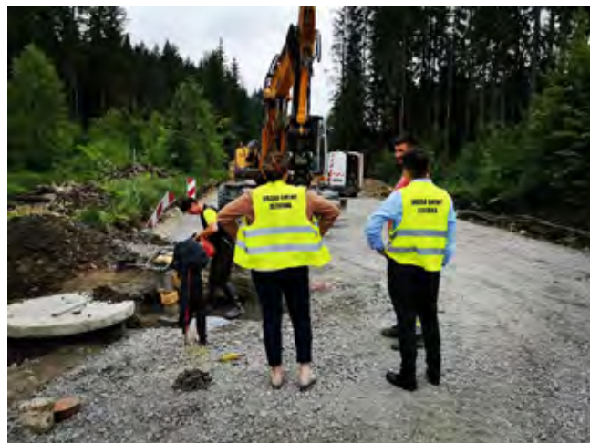
Nadzór przebudowy drogi na Zaolzie w Istebnej etap II

Zrealizowane zostały już prace związane z układaniem nowego systemu kanalizacji deszczowej i sanitarnej, wymiany gruntu, podbudowy i stabilizacji pod drogą oraz zabudowy koszy kamienno-siatkowych w korycie rzeki Olza.