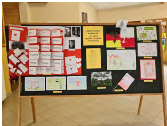
Tablica z pracami wyróżnionymi na I Gminnym Konkursie Historycznym „100-lecie Powstań Śląskich”