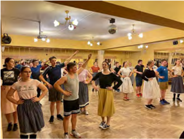
Zgrupowanie Zespołu Regionalnego „Istebna”

W dniach 20-22 maja 2021 r. odbyło się zgrupowanie wszystkich członków Zespołu Regionalnego „Istebna” wraz z instruktorami oraz muzykantami w Murzasichle koło Zakopanego. Był to dla nas bardzo intensywny czas. Podczas trzydniowego pobytu poświęciliśmy czas na próby, ćwiczenia i przygotowania do letniego sezonu. Nasz wyjazd został dofinansowany ze środków Urzędu Gminy Istebna w ramach Uproszczonej Oferty Realizacji Zadania Publicznego z zakresu: kultury, sztuki, ochrony dóbr kultury i dziedzictwa narodowego, przez co mogliśmy pokryć koszty noclegów wraz z pełnym wyżywieniem w Ośrodku Wczasowym „U Zbójnika”, a także ubezpieczenie członków zespołu.