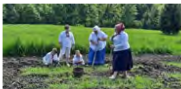
Nagrania do filmu edukacyjnego o Inie I fot. arch. zespołu

W wydarzeniach biorą udział członkowie Zespołu Regionalnego „Koniaków” oraz inni zainteresowani. Film „Jako to ze Inym było” zostanie opublikowany online stając się doskonałym materiałem