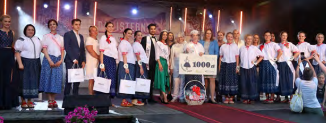
Wybory Najpiękniejszej Góralki 2021