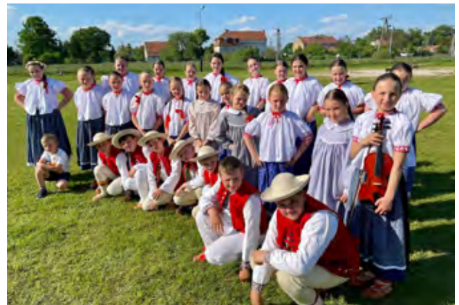
Uczestnicy Zespołu „Mała Istebna”

Nasz wyjazd został dofinansowany ze środków Urzędu Gmina Istebna w ramach Uproszczonej Oferty Realizacji Zadania Publicznego z zakresu: kultury, sztuki, ochrony dóbr kultury i dziedzictwa narodowego, złożonej przez Fundację „Dziedzictwo” działającą przy Ognisku Pracy Pozaszkolnej w Koniakowie. Dzięki dofinansowaniu mogliśmy pokryć koszty transportu oraz noclegów wraz z pełnym wyżywieniem.