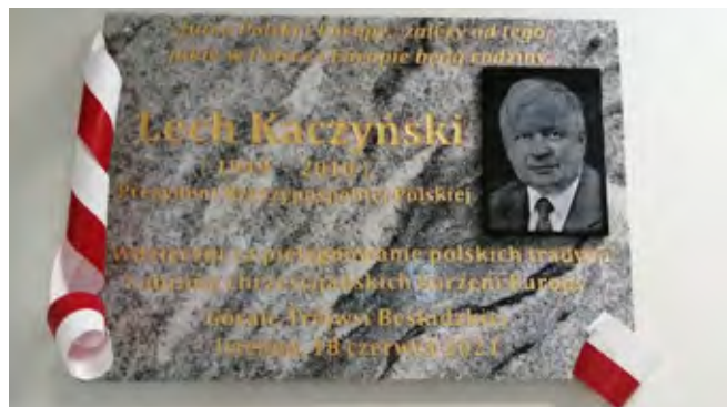
Tablica upamiętniająca śp. Lecha Kaczyńskiego

W wydarzeniu uczestniczyła delegacja cieszyńskiego batalionu 13. Śląskiej Brygady Obrony Terytorialnej Związku Podhalan Oddziału Górali Śląskich, radny powiatowy Janusz Juroszek, radni oraz pracownicy Urzędu Gminy Istebna.