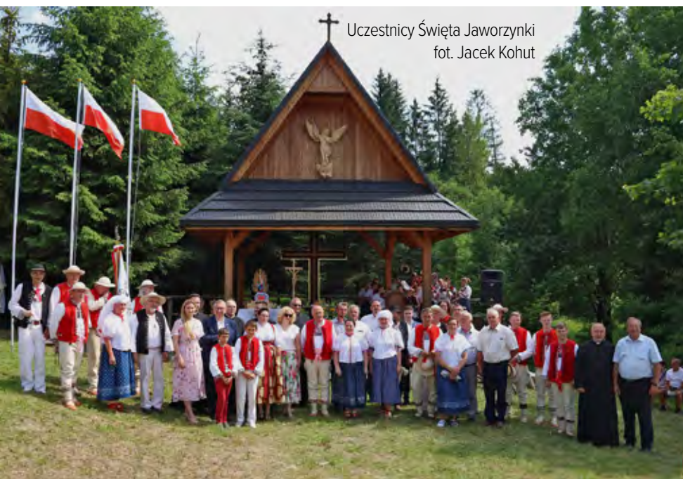
Uczestnicy Święta Jaworzynki