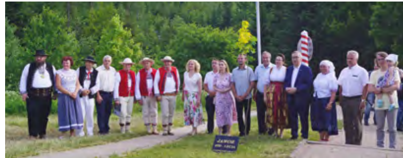
Uczestnicy wydarzenia Święto Jaworzynki