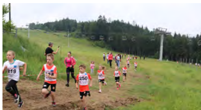
Młodzi zawodnicy w trakcie Jubileuszowego Biegu na Złoty Groń