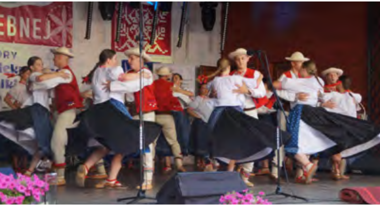
Zespół Regionalny „Istebna” podczas XXIV Dni Istebnej | fot. Bogdan Szeliga