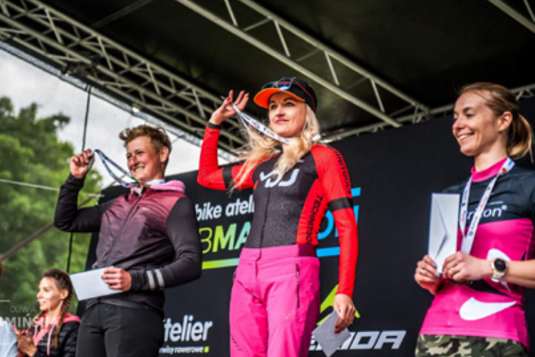
Bike Atelier MTB Maraton 2022 – Tarnowskie Góry