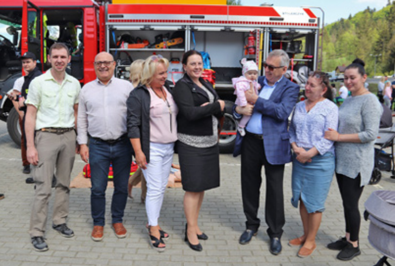
Istebniański Dzień Rodziny