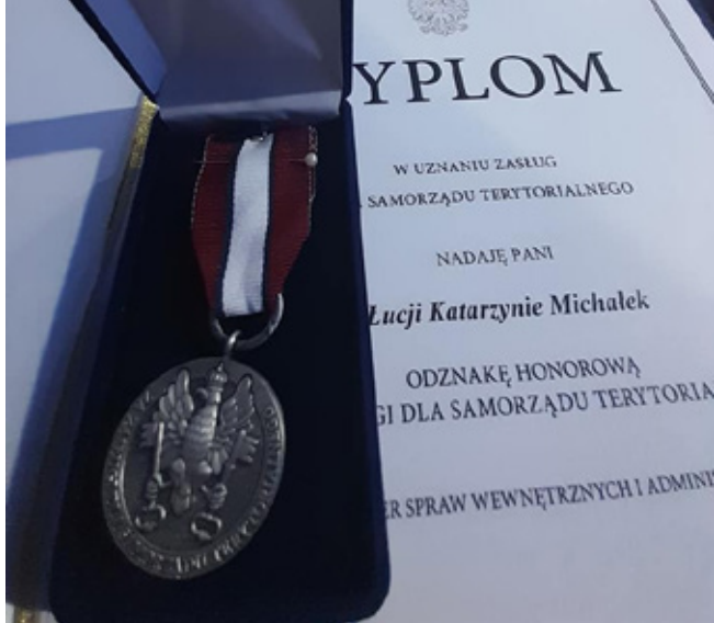
Dyplom i medal MSWiA Odnaka honorowa za zasługi dla samorządu terytorialnego