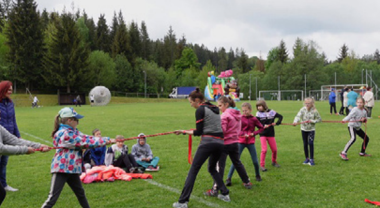
Dzień Dziecka