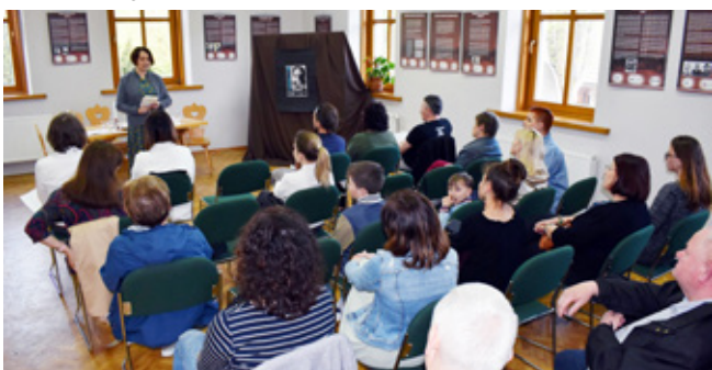
Spotkanie literackie „Miłosz w GOKu”