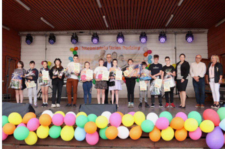
Istebniański Dzień Rodziny

U honorowane zostały także rodziny, które były na miejscu w amfiteatrze i wzięły udział w konkursie na najliczniejszą rodzinę z Istebnej, Jaworzynki, Koniakowa i rodzinę ukraińską.