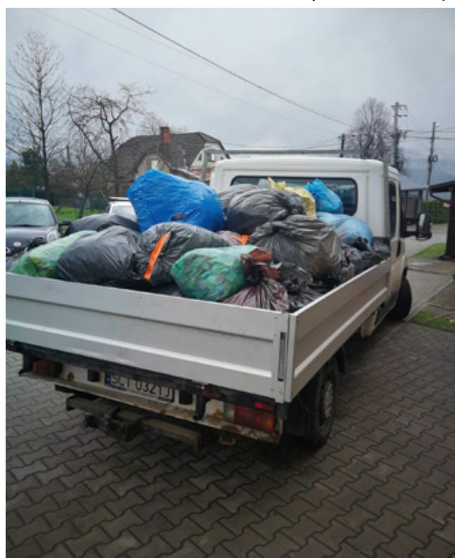
Zebrane nakrętki