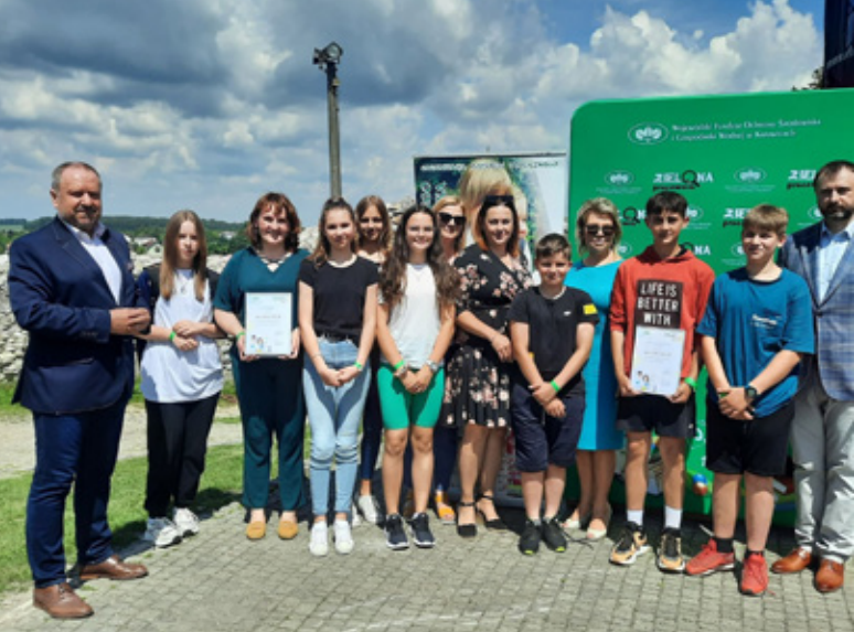
Otrzymałe promesy na utworzenie Ekopracowni w Szkole Podstawowej nr 2 w Koniakowie-Rastoce oraz Zespole Szkolno-Przedszkolnym w Istebnej