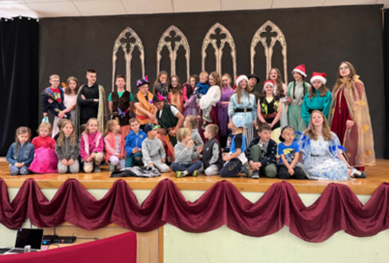
Aktorzy z przedszkolakami