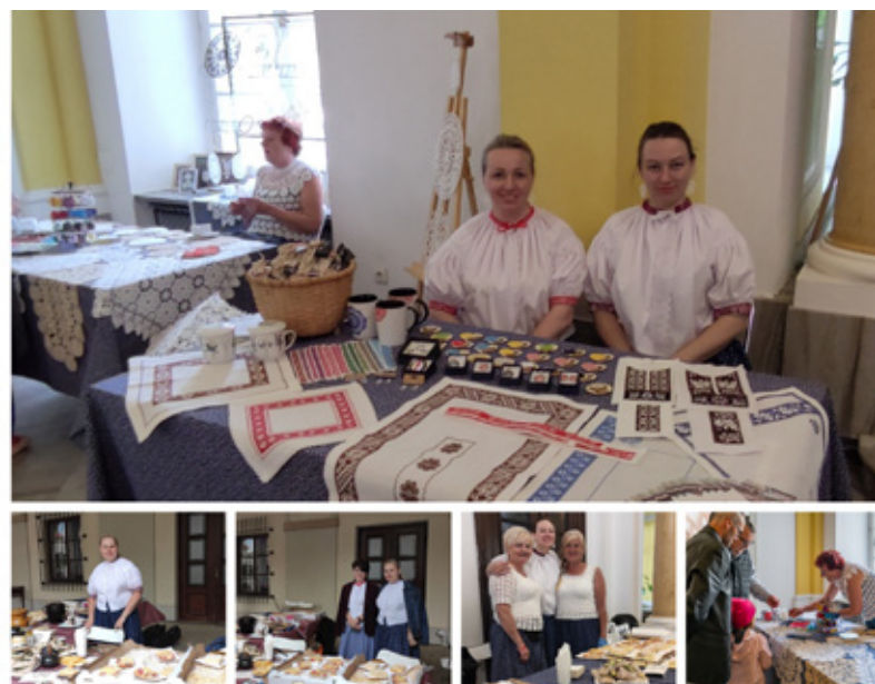
Reprezentacja Gminy Istebna na „Letniej Scenie” w Narodowym Instytucie Kultury i Dziedzictwa Wsi