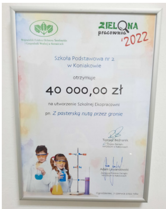
Otrzymałe promesy na utworzenie ekopracowni w Szkole Podstawowej nr 2 w Koniakowie-Rastoce