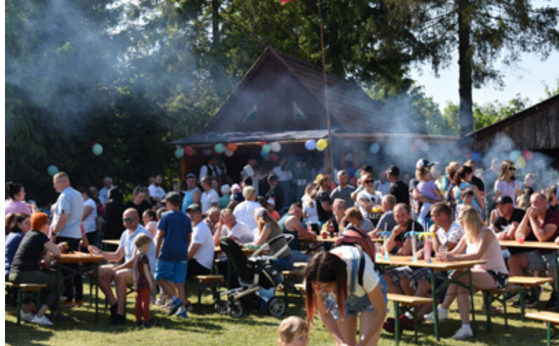
Fot. Małgorzata Owczarczak | Gminny Dzień Dziecka na Tynioku x4