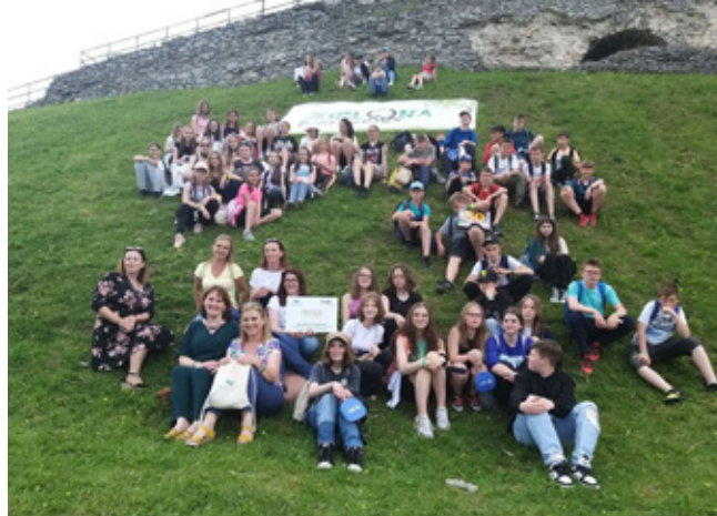
Fot. ZSP Istebna | Zielone pracownice