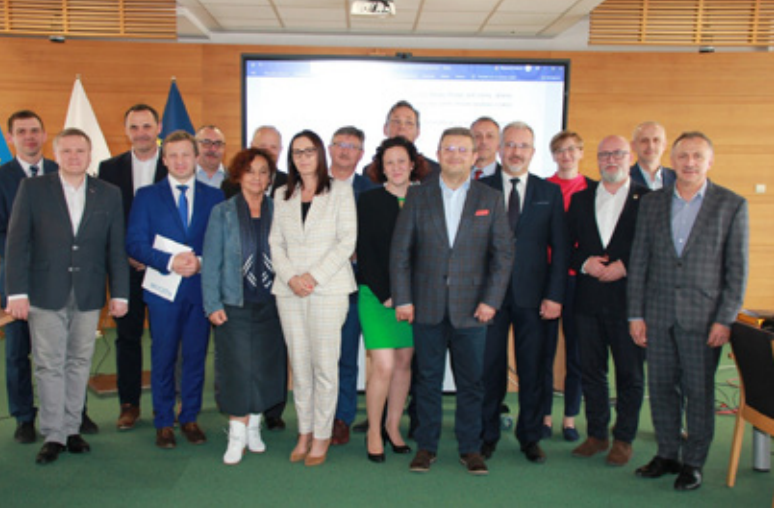
Spotkanie delegacji samorządów powiatu cieszyńskiego