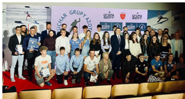
Uczestnicy uroczystości IV edycji Pucharu Grupy Azoty