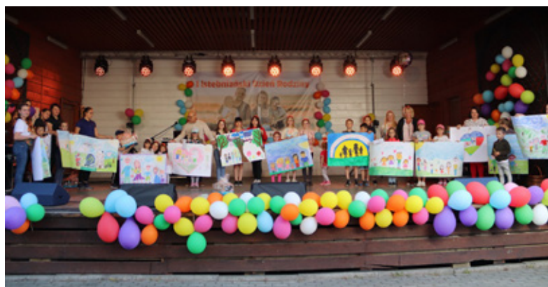
Istebniański Dzień Rodziny