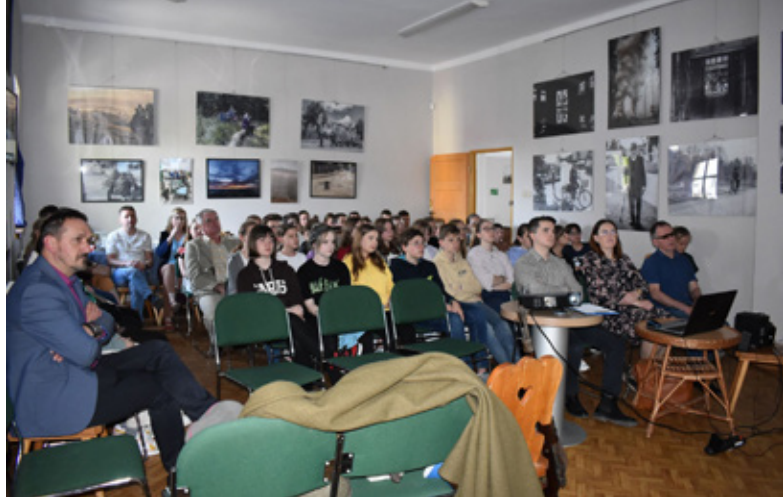
V Spotkanie z Historią „Cieszyński Pułk Podhalański w historii i pamięci”