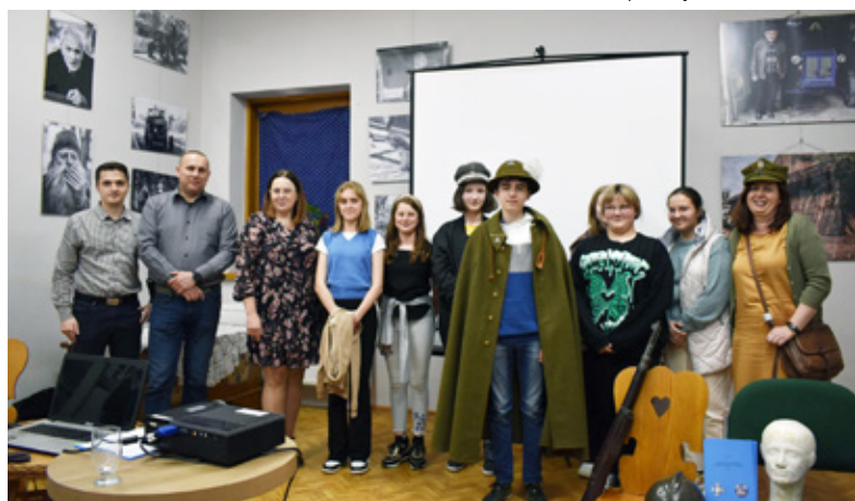
V Spotkanie z Historią „Cieszyński Pułk Podhalański w historii i pamięci”