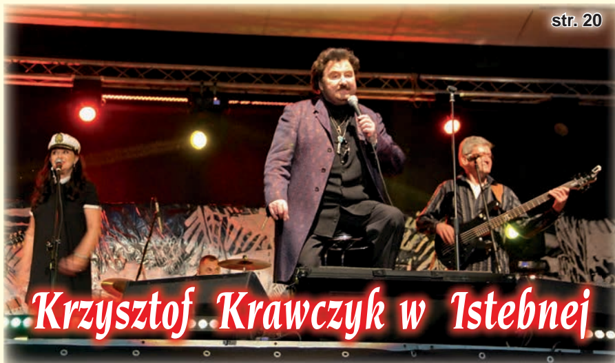
Krzysztof Krawczyk w Istebnej

Dzień Samorządu Terytorialnego w Pałacu Prezydenckim