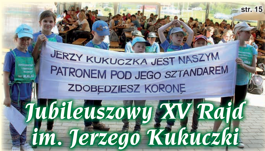
Jubileuszowy XV Rajd im. Jerzego Kukuczki