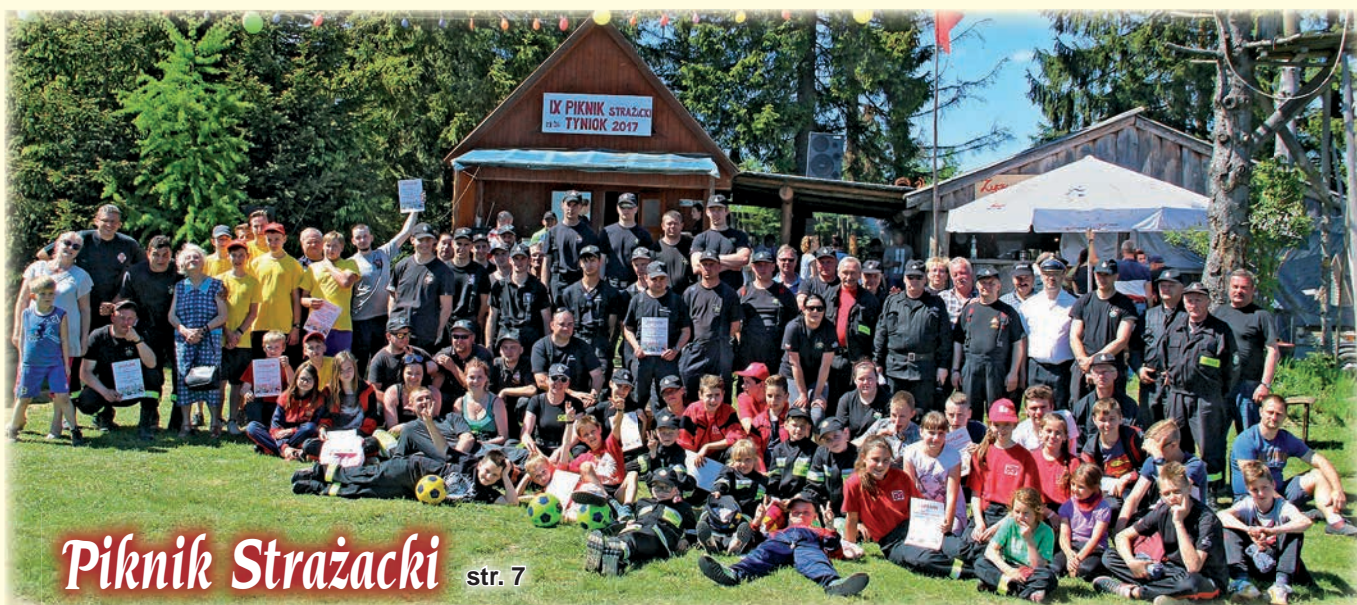
Piknik Strażacki str. 7