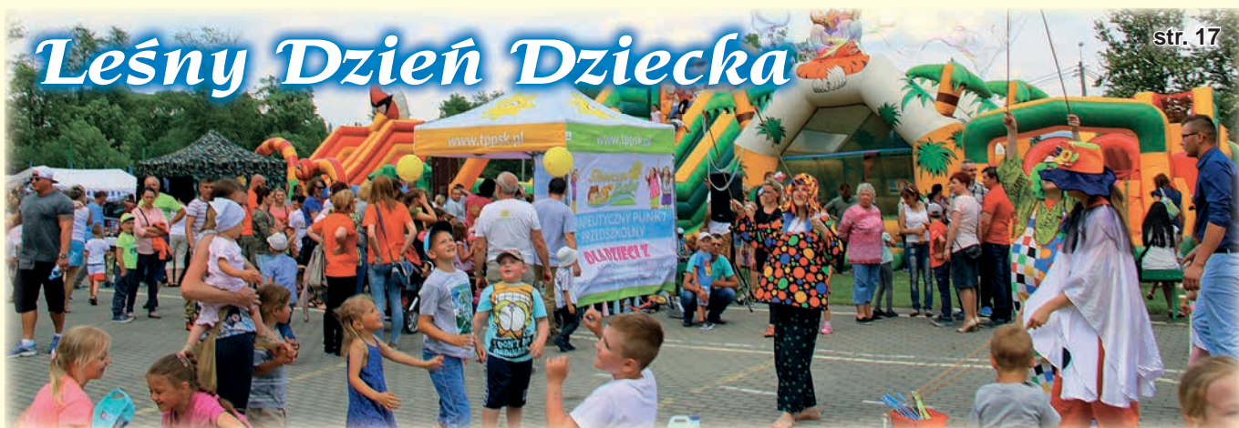
Leśny Dzień Dziecka