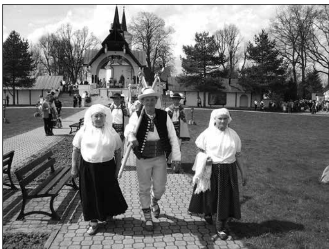
Przy Sanktuarium w Ludźmierzu

Wielkim dla nas zaszczytem był udział w europejskim integracyjnym projekcie pt.: „Taniec to jest życie” od 12.03 do 19.03.2015 r., który odbył się w tureckiej Antalyi. Wzięło w nim udział 7 państw, między innymi Turcja, Polska, Bułgaria, Grecja, Serbia, Mołdawia, Włochy.