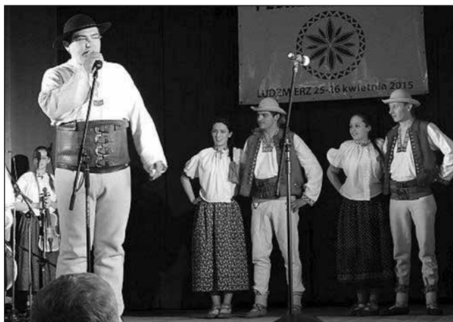
I Zjazd Karpacki w Ludźmierzu, występ Zespołu Koniaków

Każdy uczestnik otrzymał certyfikat uczestnictwa w warsztatach. Organizatorem wydarzenia był Międzynarodowy Folk Dance.