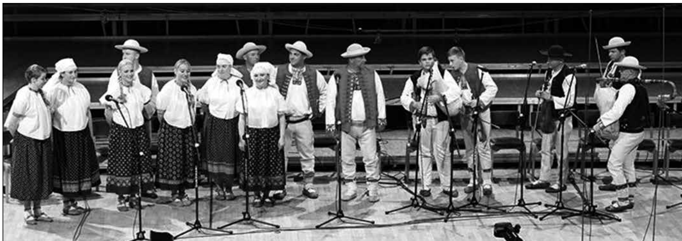
Siplączka na festiwalu Nowa Tradycja