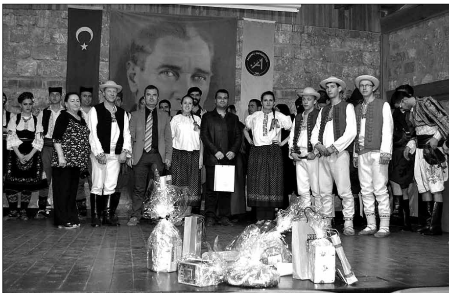
Warsztaty taneczne Dance is Life w Antalyi

Honorowy patronat objął prezydent RP Bronisław Komorowski, który na koniec zapalił „Watrę” wraz z baczami. Natomiast w niedzielę w Ludźmierskim Sanktuarium odbyło się, jak każdego roku Baczowskie Święto, czyli nasze Miyszani Łowiec. Poświęcono łowieczki, które poszły na wypas. W uroczystości tej wzięli udział pierwsza dama RP Anna Komorowska.