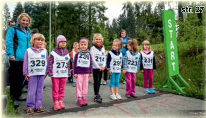
Najmłodszy uczestnicy zawodów