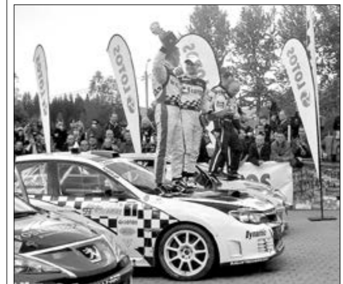
Zwycięska załoga na mecie 59 Rajdu Wisły

Rajdowe rywalizacje odbywały się na następujących odcinkach specjalnych: