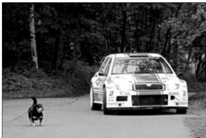
Nietypowa „rywalizacja” na trasie

Ceremonia Mety Rajdu i rozdanie nagród miały miejsce w późnych godzinach popołudniowych 26 maja w Amfiteatrze „Pod Skocznia” w Istebnej.