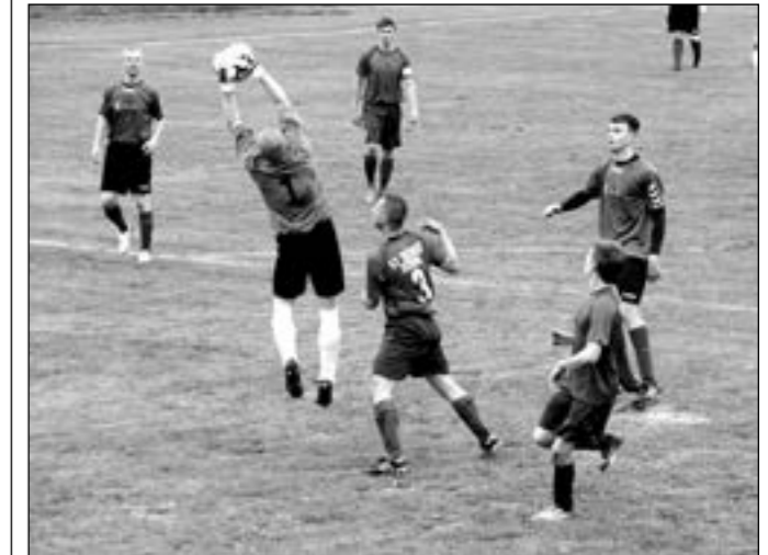
Fragment meczu KP Trójwieś - Pruchna