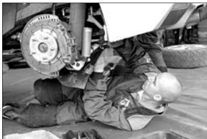
Rajd samochodowy to też spore wyzwanie dla mechaników

Specyfika trasy sprawiła, że Rajd był trudny dla kierowców, ale dzięki temu bardzo emocjonujący dla kibiców.