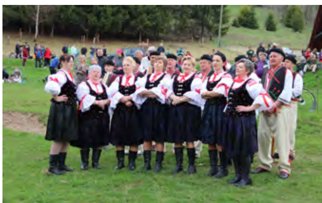
Fot. Jacek Kohut | FS Ozvena Fot. Jacek Kohut | Zespół Regionalny Mała Istebna