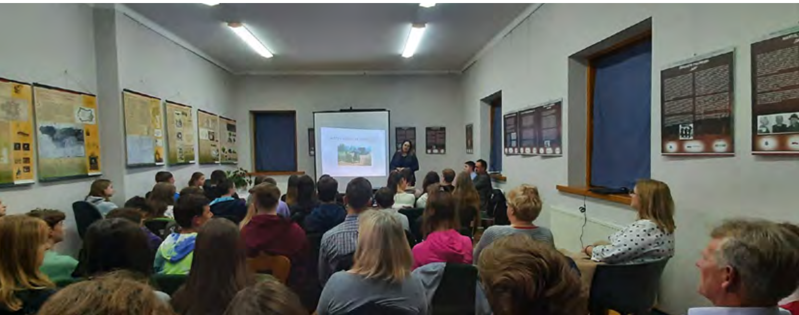
„IV Spotkanie z Historią – Wspomnienia katyńskie” x2