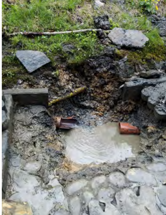
Sieć kanalizacyjna

Edyta Kukuczka – kierownik Referatu Usług Komunalnych