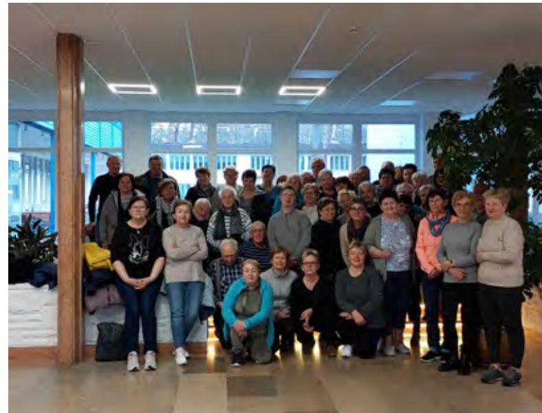
Członkowie Istebniańskiego Uniwersytetu Seniora