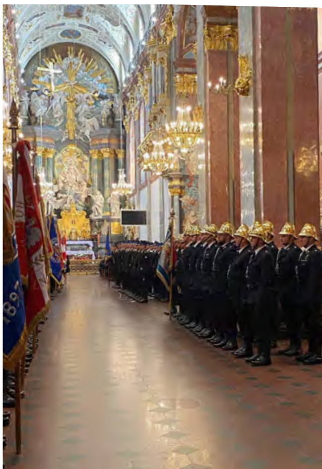
Uroczystość św. Floriana na Jasnej Górze