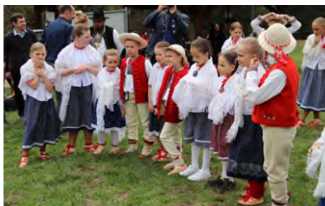
Fot. Jacek Kohut | Zespół Regionalny Mała Istebna Fot. Jacek Kohut | Włodarze Polski, Czech i Słowacji oraz mieszkańcy