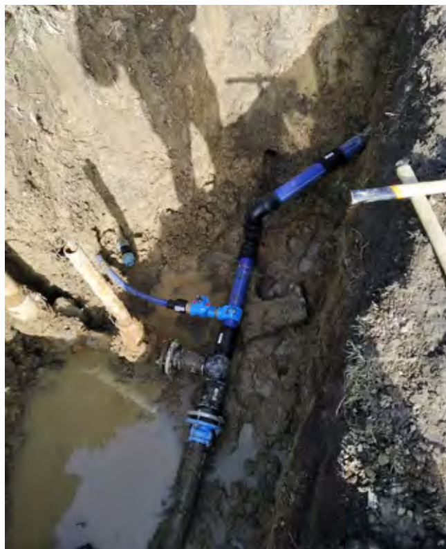
Koniaków-Bukowina – wymiana sieci