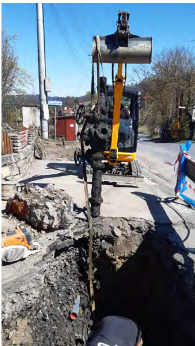
Istebna-Centrum – awaria wymiana sieci