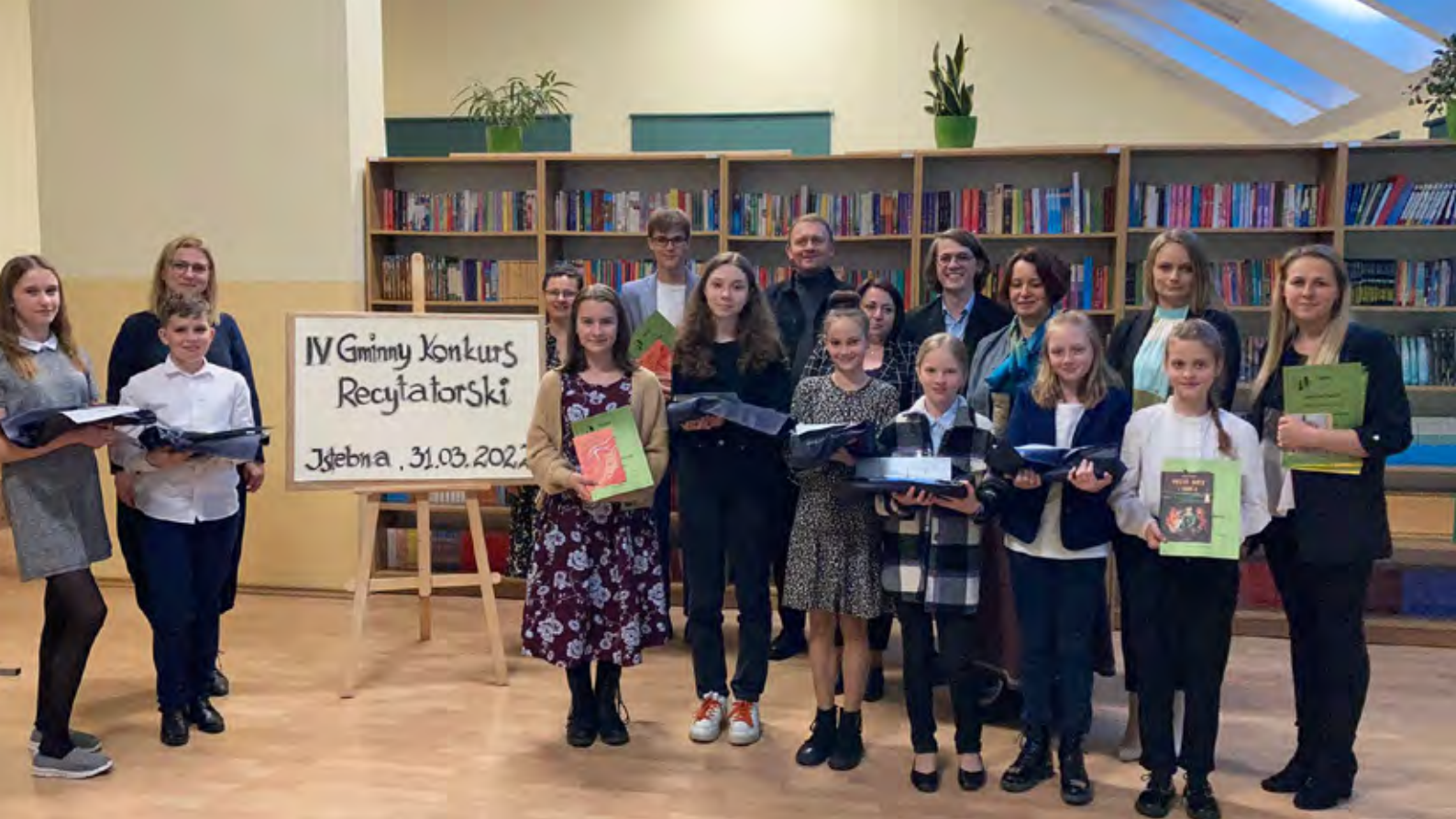
Laureaci z opiekunami oraz jury