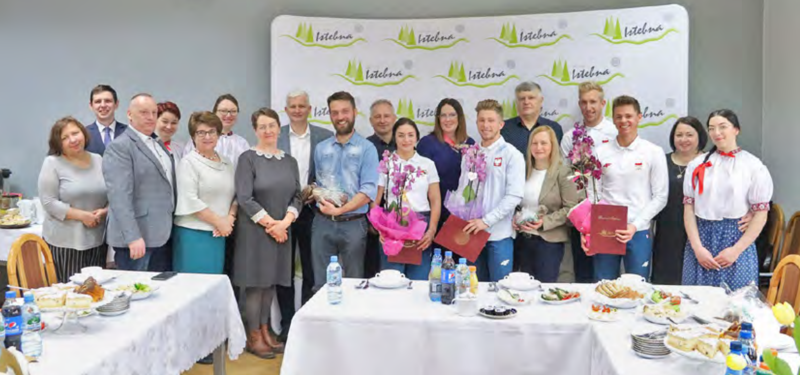
Uroczyste śniadanie z olimpijczykami w sali sesyjnej UG Istebna