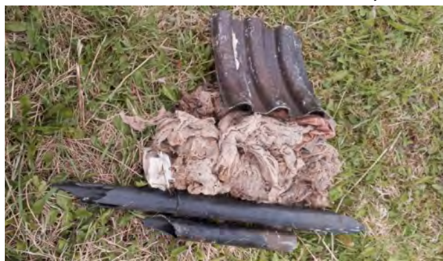
udrożnienie studzienki kanalizacyjnej