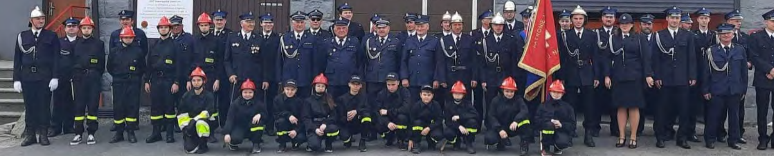
Dzień Strażaka