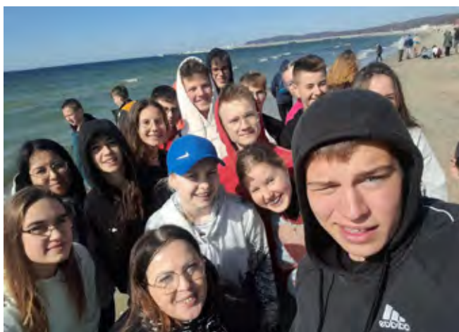
Wycieczka do Sopotu, plaża