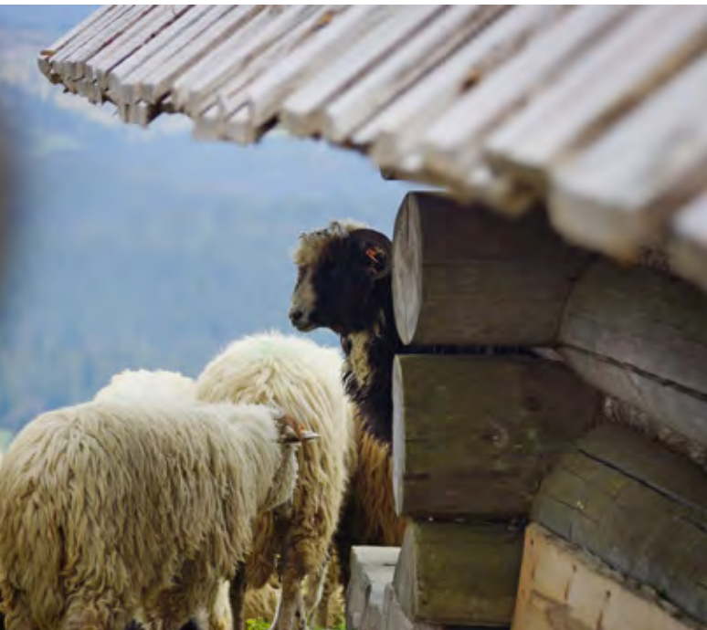
Wiosenny redyk u Piotra Kohuta – owca na hali