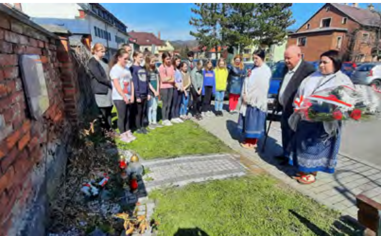
Złożenie kwiatów w Jabłonkowie