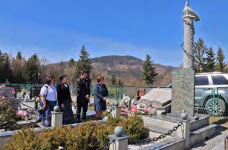
Złożenie kwiatów w Istebnej