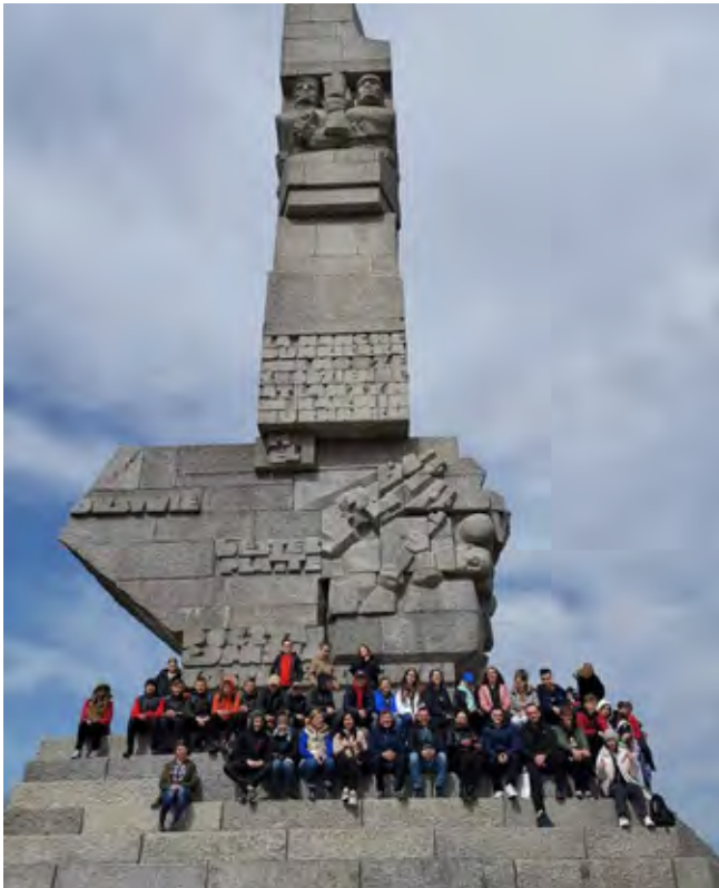
Westerplatte, Gdańsk