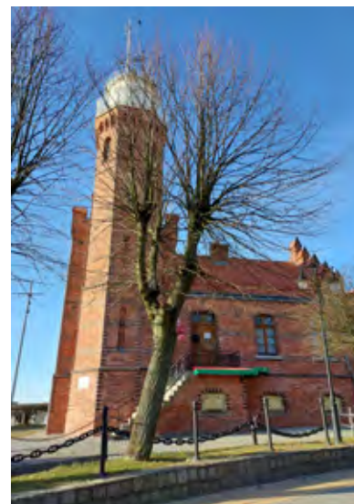
Latarnia morska w Ustce