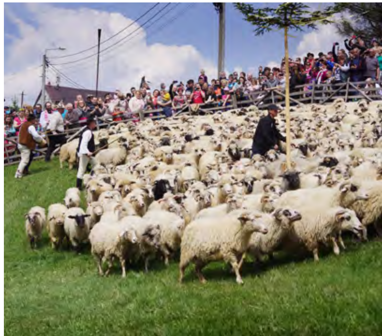
Wiosenny redyk u Piotra Kohuta w Koniakowie-Szańcach