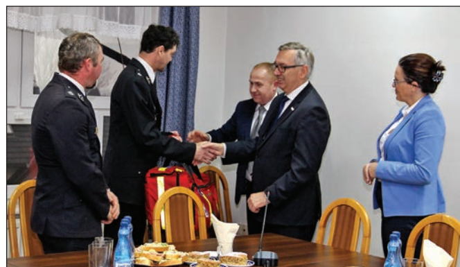
Przekazanie sprzętu strażackiego – torby ratowniczej PSP R1 do Jednostki OSP Jaworzynka Zapasieki

Sukcesem zakończyły się starania o przyznanie nowego samochodu bojowego dla jednostki OSP Jaworzynka Centrum. Postulat ze strony jednostki o potrzebie takiego zakupu został zgłoszony już w grudniu. „OSP Istebna i OSP Koniaków dysponują nowym samochodem bojowym. Pozostało jedno sołectwo, o które należało zadbać. Jako wójtowi zależy mi na zrównoważonym rozwoju gminy. Podjęłam zatem działania prowadzące do pozyskania takiego samochodu. W tym zakresie pomógł nam Wiceminister Stanisław Szwed, który interweniował w tej sprawie. Sami beneficjenci wykazali również bardzo duże zaangażowanie. Pomimo wielu trudności otrzymaliśmy w ostatnim czasie informację, że wniosek wystosowany przez jednostkę został rozpatrzony pozytywnie i znaleźliśmy się na liście dofinansowania. Wartość zakupu to 400 000 zł. 60 000 zł przekaże MSWiA, 40 000 zł pochodzić będzie ze środków własnych jednostki, 100 000 zł - z budżetu Gminy, zaś pozostałą część pokryje WFOŚiGW w Katowicach. Rada Gminy podczas sesji 25 kwietnia podjęła uchwałę o przekazaniu środków dla OSP w Jaworzynce.