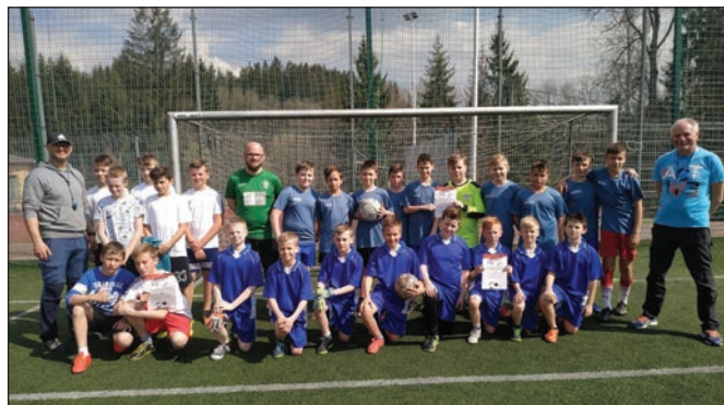
Uczestnicy Turnieju z opiekunami