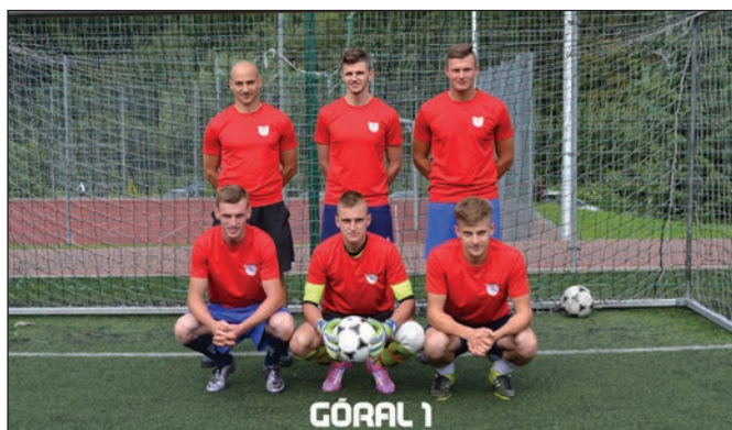
Zwycięzcy ubiegłorocznej edycji Turnieju

Drużyny, które zajmą miejsca od I do III otrzymują puchary oraz drobne nagrody rzeczowe. Pozostałe drużyny otrzymują pamiątkowe statuetki oraz dyplomy.