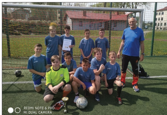
Drużyna ZSP w Istebnej

W drodze do finału powiatowego drużyna chłopców ZSP w Istebnej wygrała rozegrany w Goleszowie Turniej Piłki Nożnej Igrzysk Dzieci Grupa I. Nasi piłkarze pozostawili w pokonanym polu ekipy z Wisły oraz Goleszowa. J. Kohut