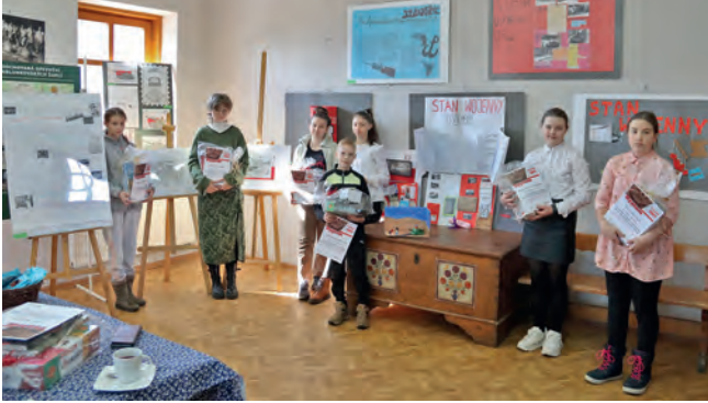
Laureaci konkursu