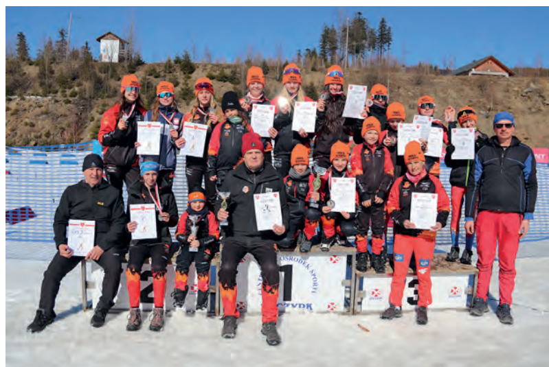
Medalowe sztafety MKS Istebna