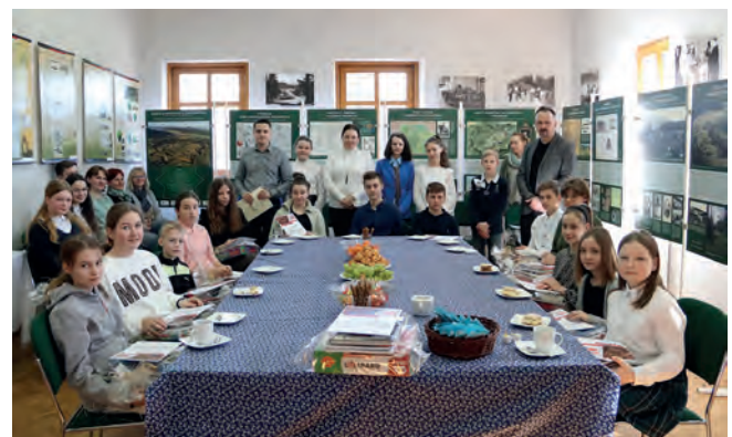
Gminny Konkurs Historyczny x2