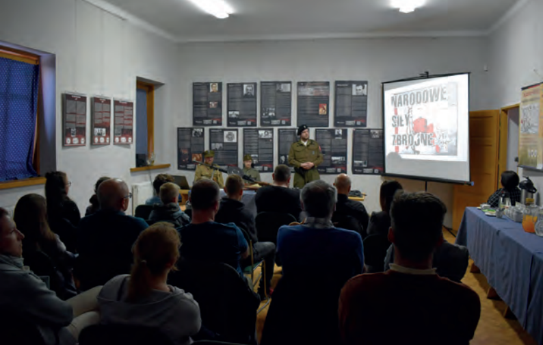
Spotkanie z historią pt. Żołnierze Wyklęci Bohaterowie z Beskidów