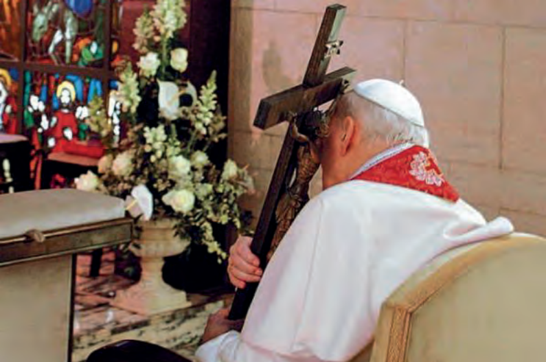
Krzyż, przy którym umierał Jan Paweł II