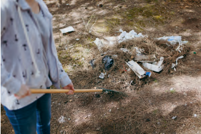
Wiosenne porządki

W związku z okresem wiosennym zwracamy się do Państwa z apelem dotyczącym utrzymania porządku i czystości na terenie naszej gminy, gdyż zachowanie odpowiedniego stanu naszego otoczenia stanowi nie tylko o estetyce krajobrazu, ale również sprzyja zdrowiu i dobremu samopoczuciu wszystkich mieszkańców. W akcji mogą wziąć udział wszyscy niezależnie od miejsca zamieszkania. Wystarczy przygotować kilka worków na śmieci i pójść na dłuższy spacer po okolicy. Zbierając każdy papierek czy butelkę lub inne porzucone w nieodpowiednim miejscu śmieci starajmy się w miarę możliwości segregować odpady do odpowiednich worków na surowce wtórne. Zebrane odpady należy złożyć w workach w widocznym i łatwo dostępnym miejscu, najlepiej w pobliżu drogi.