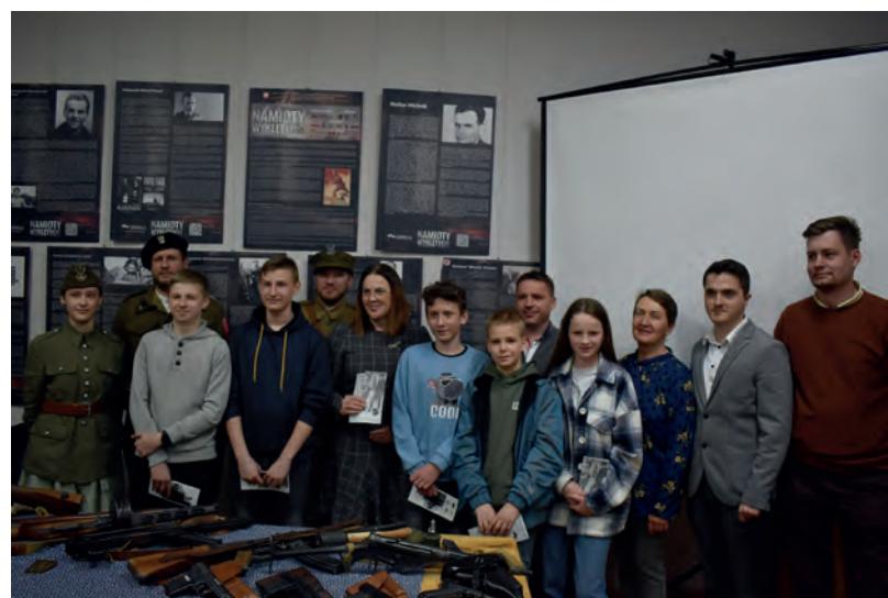
Spotkanie z historią pt. Żołnierze Wyklęci Bohaterowie z Beskidów