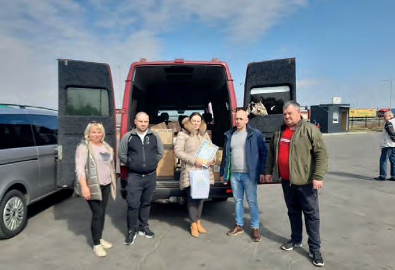
Przekazanie darów rzeczowych dla gminy partnerskiej Delatyn na Ukrainie