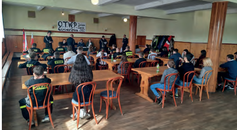
Uczestnicy turniej