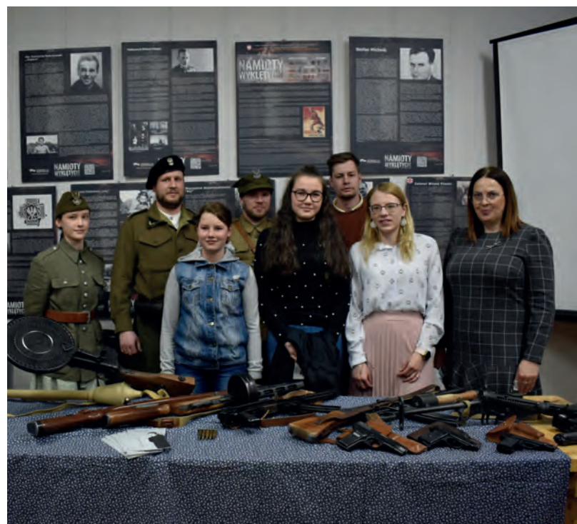
Spotkanie z historią pt. Żołnierze Wyklęci Bohaterowie z Beskidów