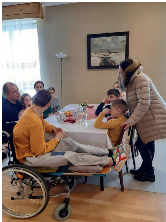
Spotkanie z uchodźcami w Zameczku Prezydenckim