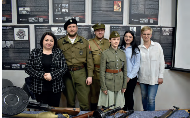
Spotkanie z historią pt. Żołnierze Wyklęci Bohaterowie z Beskidów