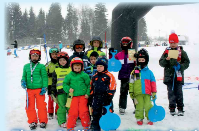
Zima z Radiem Zet w Istebnej