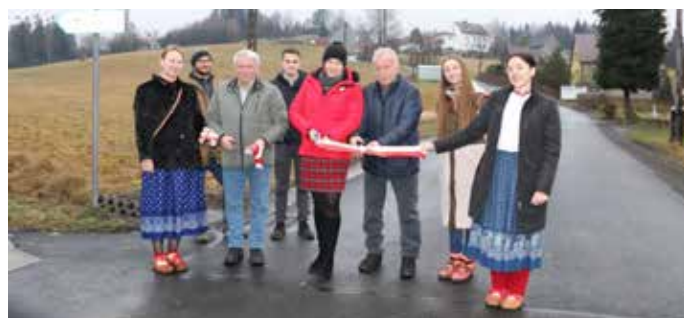
Podinspektor w Refarecie Rozwoju Infrastruktury i Ochrony Środowiska

Modernizację wykonano na długości 303 m. Zadanie realizowane ze środków własnych gminy w kwocie 196 864,06 zł.