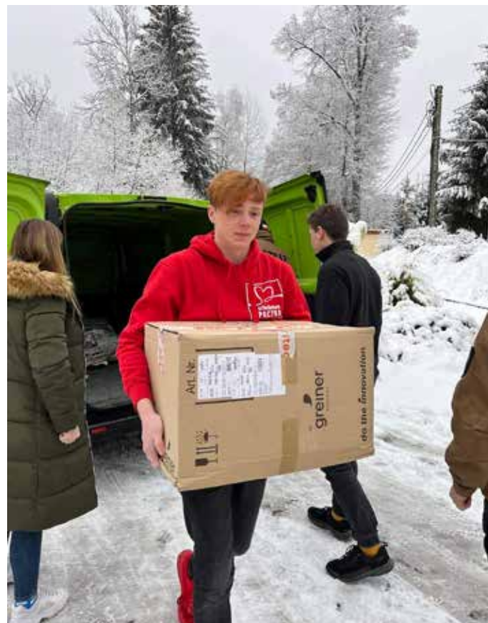
> Wolontariusze z Istebnej podczas „Weekendu Cudów”