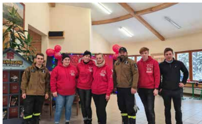
> Wolontariusze Szlachetnej Paczki z Istebnej wraz ze strażakami OSP Istebna Centrum

KD – Pomagają nam w tym instytucje takie jak GOPS czy MOPS w zależności od rejonu działania. Lider danego rejo-