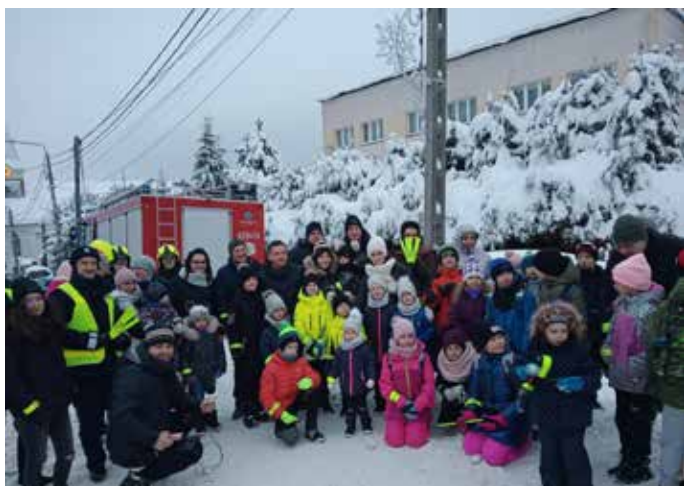
> Rozdawanie odblasków przy SP nr 1 w Koniakowie