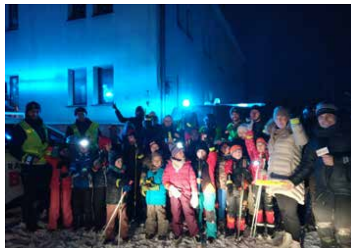
> Rozdawanie odblasków przy budynku SP nr 1 w Jaworzynce

Gmina Istebna już kolejny rok „Świeci Przykładem” dzięki wspólnej akcji naszej gminy Policji oraz Radio Bielsko.