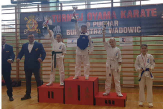
Zwycięzcy na podium w Oyama karate