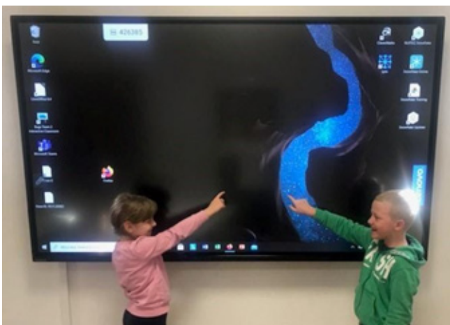
Edukacyjna tablica

Tym samym po edycji z roku 2019, wszystkie szkoły naszej gminy zostały zaopatrzone w monitory interaktywne z programu „Aktywna tablica”, pozwalające na ciekawe lekcje i dające możliwość korzystania z nowoczesnych technologii informacyjno-komunikacyjnych.