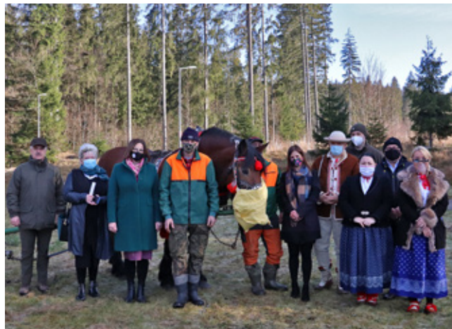
Uczestnicy spotkania promującego projekt „Konie w Beskidach”