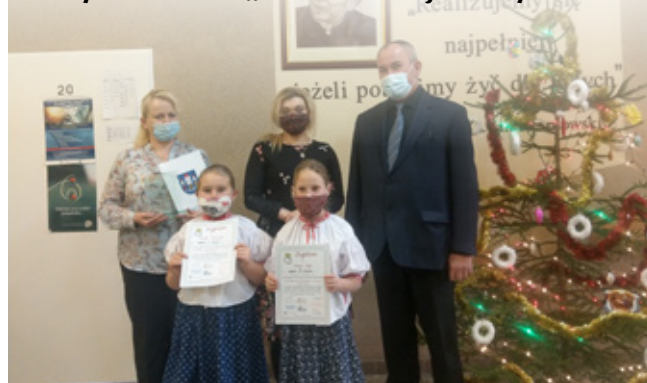
Laureatki w konkursie gwarowym

w Powiatowym Gwarowym Konkursie Recytatorskim „Tu sóm moji korzynie”