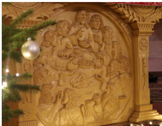
Rzeźba z ołtarza w kościele w Jaworzynie-Trzycatku wykonana przez Pawła Jałowiczora