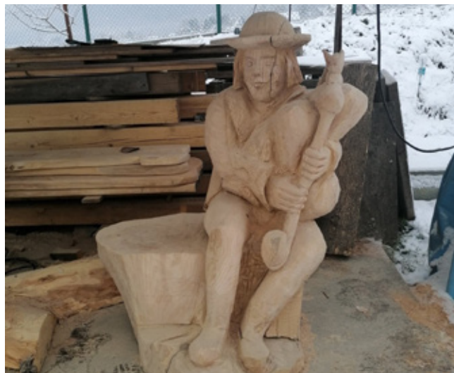
Rzeźba bacy-gajdosza i koronczarki – zrealizowane w ramach projektu „Fortyfikacje Szańce – společná historia, která łączy do dzisiaj”

Aneta Legierska – kierownik promocji i informacji turystycznej GOK