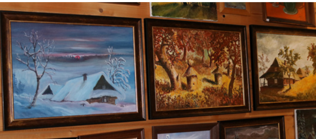
Kolekcja obrazów Tadeusza Ruckiego w Galerii na Szańcach I fot. arch. prywatne