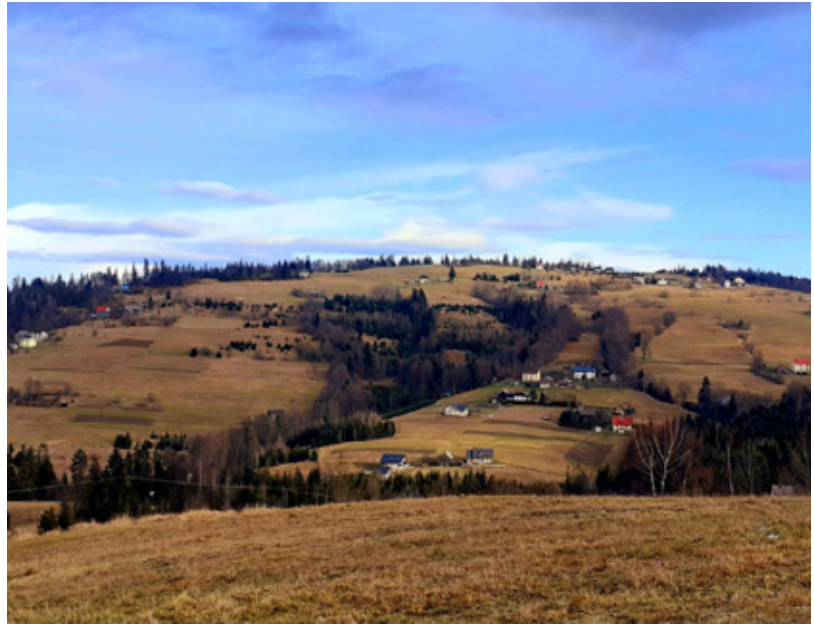
Widok na południową stronę Tynioka w Koniakowie

Panu Jackowi Kohutowi gratuluję znalezienia niezwykłego sposobu nobilitowania swojej góry życia - Tynioka i umiejętności przekazania tej miłości tym, którzy postanowili górę tę oswoić Inaczej - po sportowemu i turystycznie. Być może, że oprócz nagrody, w biegu dostrzegą, że całe nasze bogactwo mamy pod ręką, jest ono tu i teraz, wystarczy zatem go widzieć, czuć i umieć o nim opowiedzieć. Bez wątpienia potrafił to zrobić Jacek Kohut. Oswoił