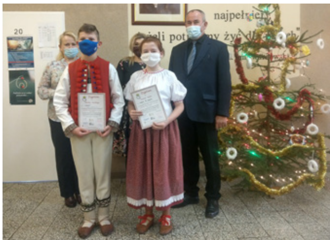
Laureaci w konkursie gwarowym