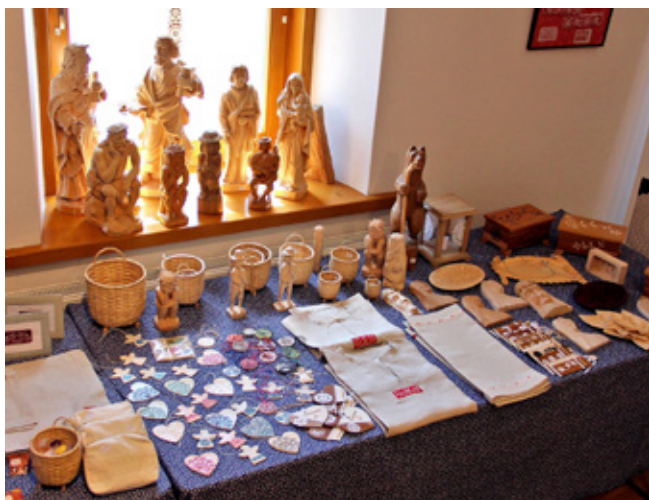
fol. arch. GOK | Wystawa twórczości ludowej