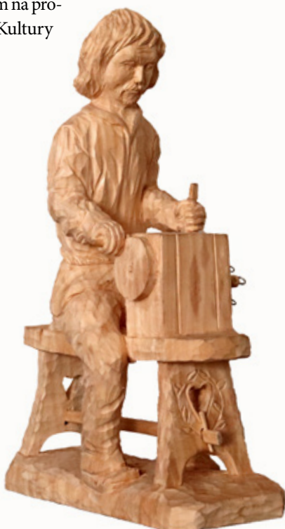
fol. Jacek kohut