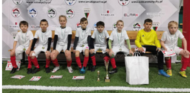
APN Góral Istebna rocznik 2010