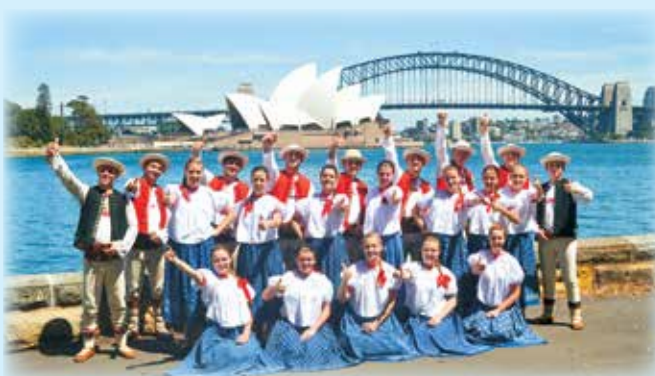
W bruclikach i kabotkach przed operą i Harbour Bridge w Sydney