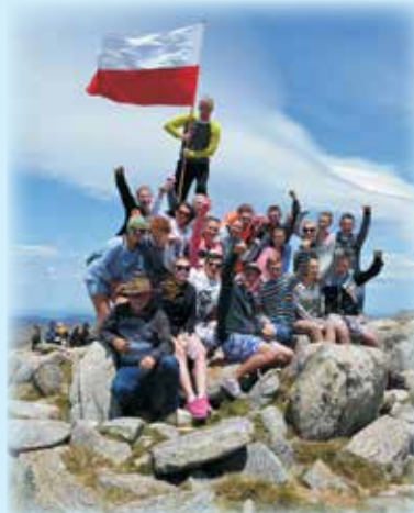
Zespół Istebna na szczycie Góry Kościuszki - najwyższego szczytu na kontynencie australijskim