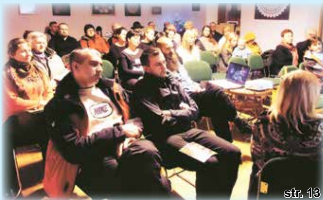
Spotkanie promujące album „Gajdosze”