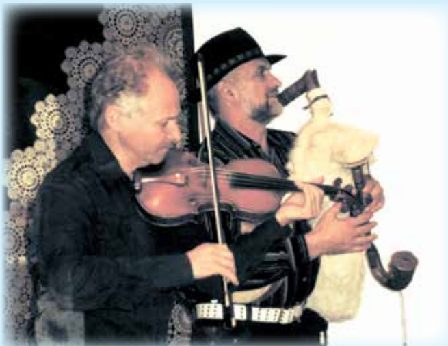
Strażacy OSP Koniaków Koszarzyska na Barbórkowym Turnieju Strażaków i Ratowników