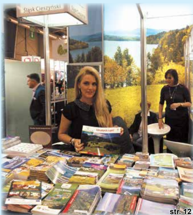
Targi Turystyczne w Warszawie