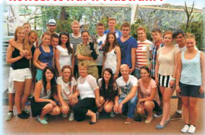
Z misiem koala w Brisbane