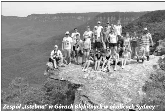
Zespół „Istebna” w Górach Błękitnych w okolicach Sydney

Ostatnim etapem wyprawy był dziesięciodniowy pobyt w Sydney, gdzie nasza „Istebna” dała 6 koncertów – w olbrzymiej sali przy polskiej parafii w Maryong, w polskich klubach w Blankstown i Ashfield, w domu opieki społecznej w Maryong, a także w odległym o prawie 200 km mieście Newcastle. Zwieńczeniem całej wyprawy był koncert na dziesiątej edycji festiwalu Polish Christmas w samym centrum Sydney.