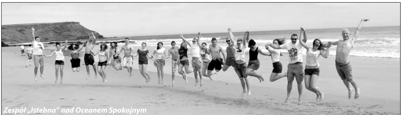
Zespół „Istebna” nad Oceanem Spokojnym