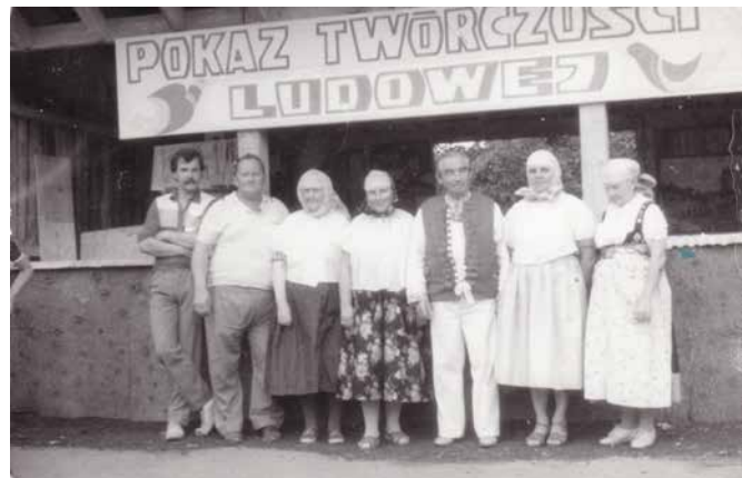
Twórcy ludowi podczas pokazu Twórczości Ludowej w Wiśle w czasie TKB około roku 1988.