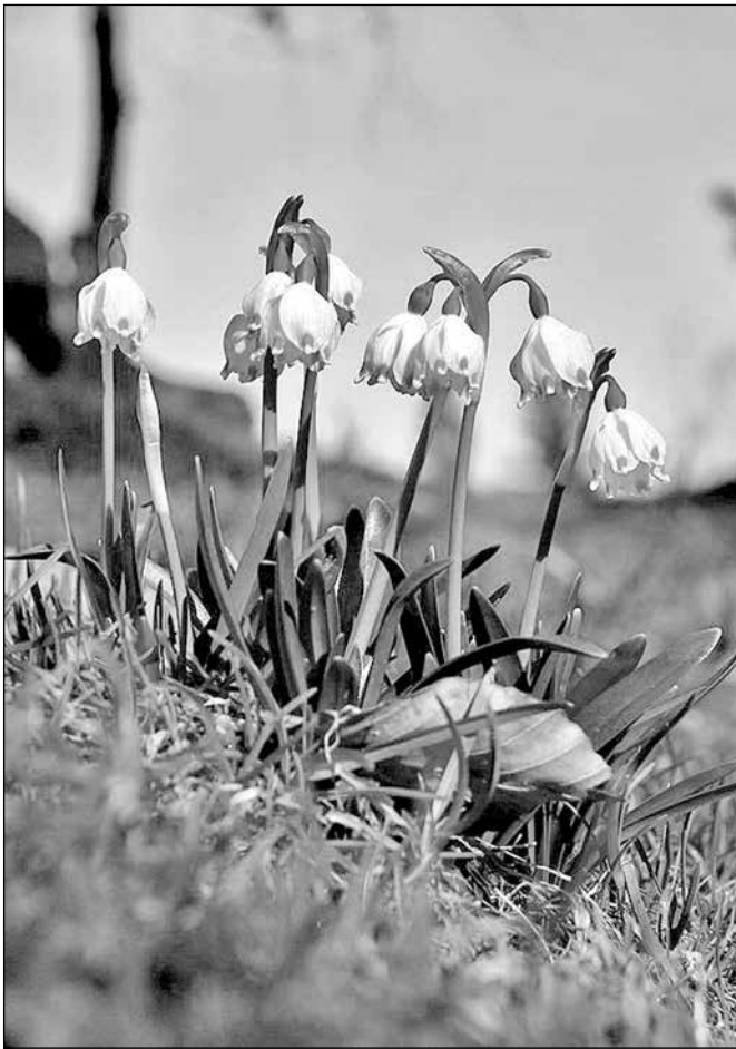
Pierwsze zwiastuny wiosny 2017